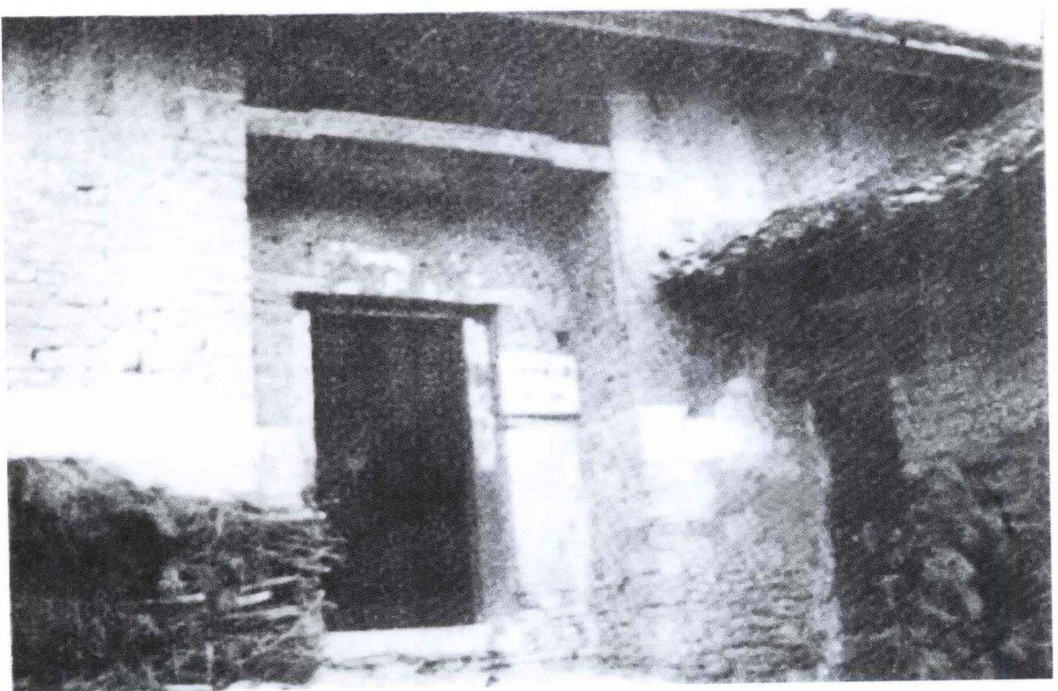
三阳店韩关 鄂中专署旧址