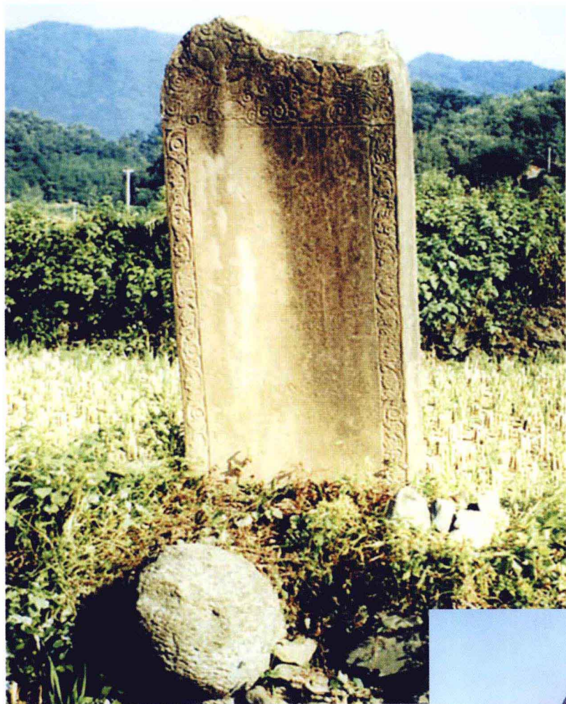
太阳寺大雄宝殿前龟碑