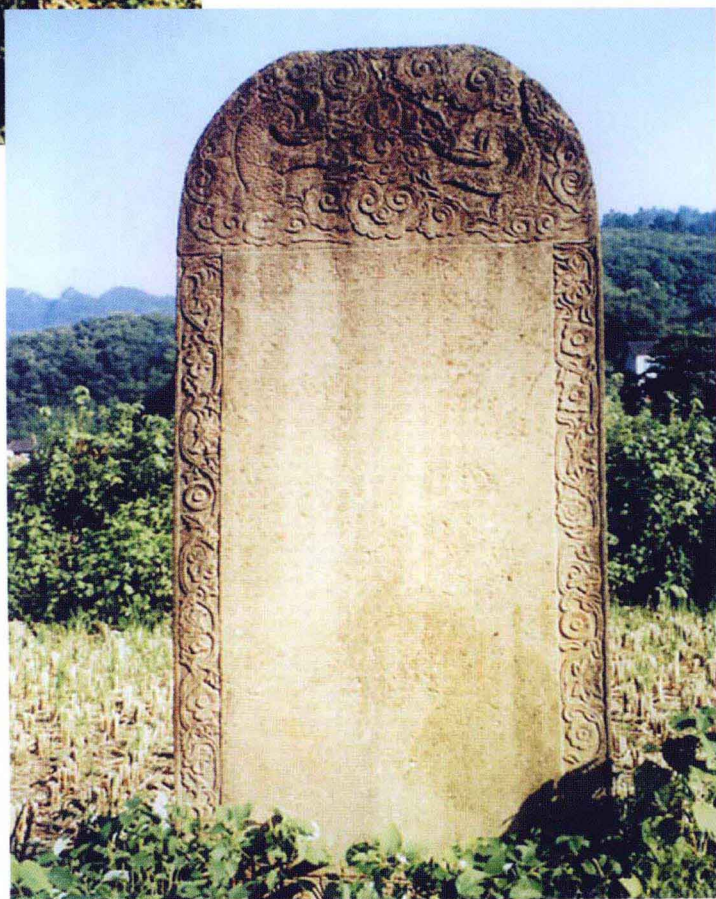
太阳寺大雄宝殿前龟碑