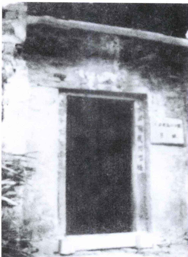
三阳店楼子湾鄂中军分区旧址