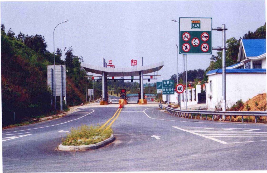
随岳高速公路三阳出入口