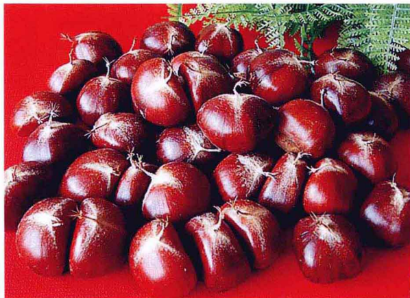
三阳长岭板栗基地