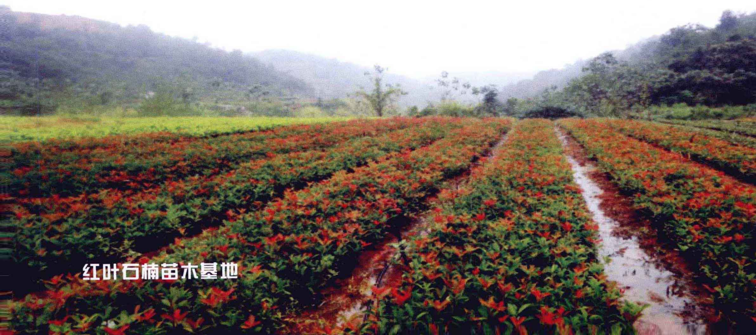
红叶石楠苗木基地