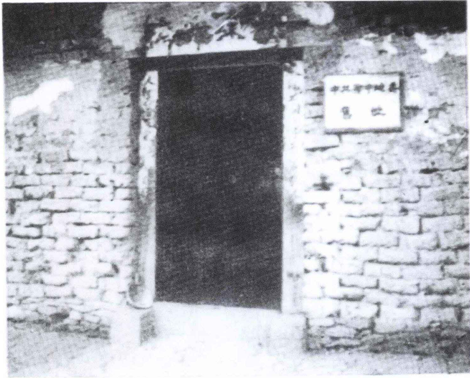
三阳店沈家畈 鄂中地委旧址