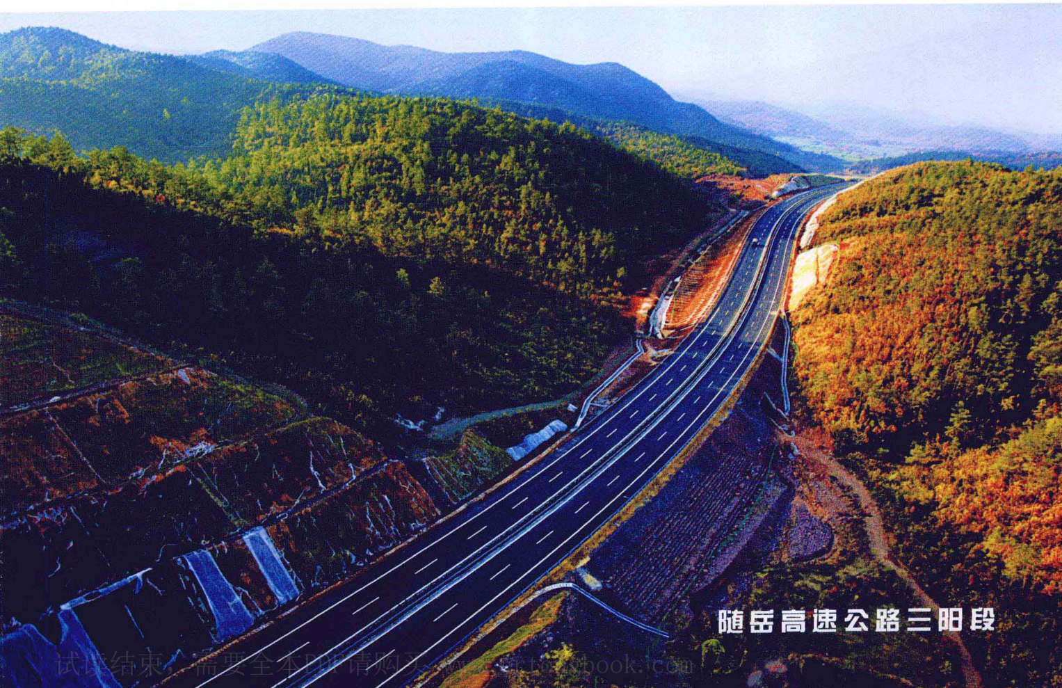
随岳高速公路三阳段