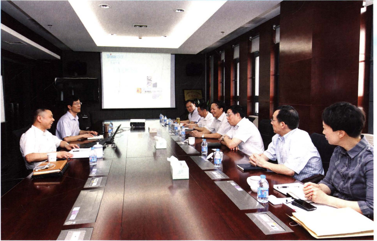
江苏省国家税务局局长胡道新来常调研、指导工作