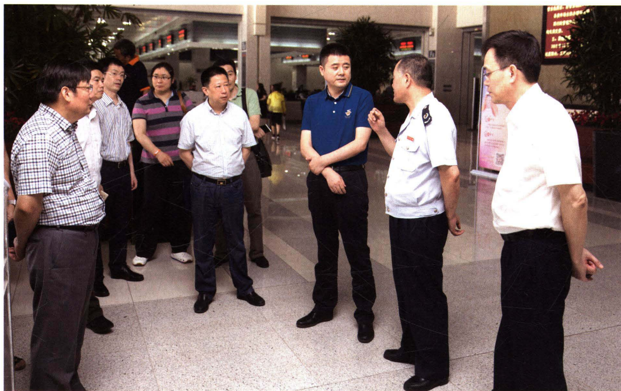
江苏省国家税务局总审计师张爱球来常开展“问需求 优服务 促改革”专题调研