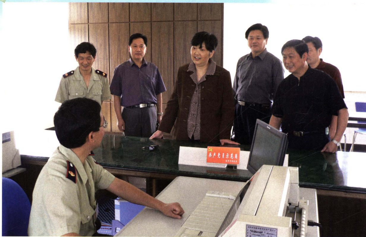
江苏省国家税务局局长周苏明到溧阳基层分局调研