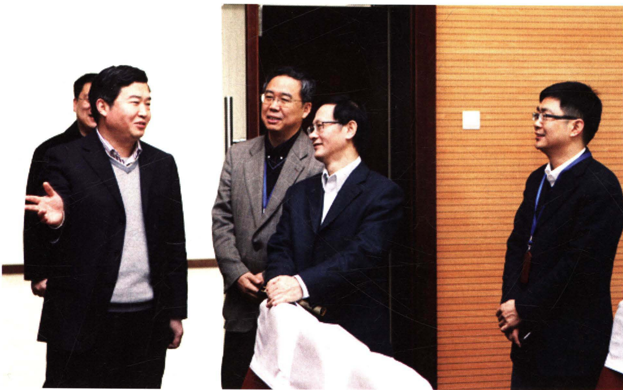
江苏省国家税务局副局长姜跃生来常指导工作