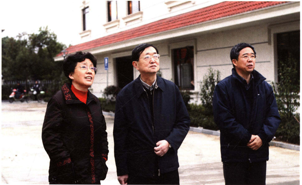
江苏省国家税务局局长翁荣华来常调研