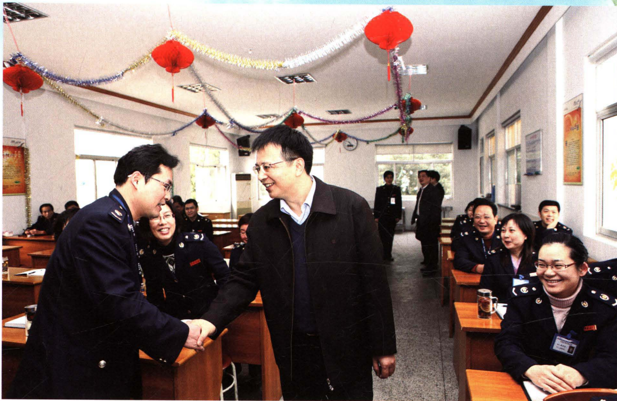
江苏省国家税务局副局长葛元力亲切慰问我市基层一线干部