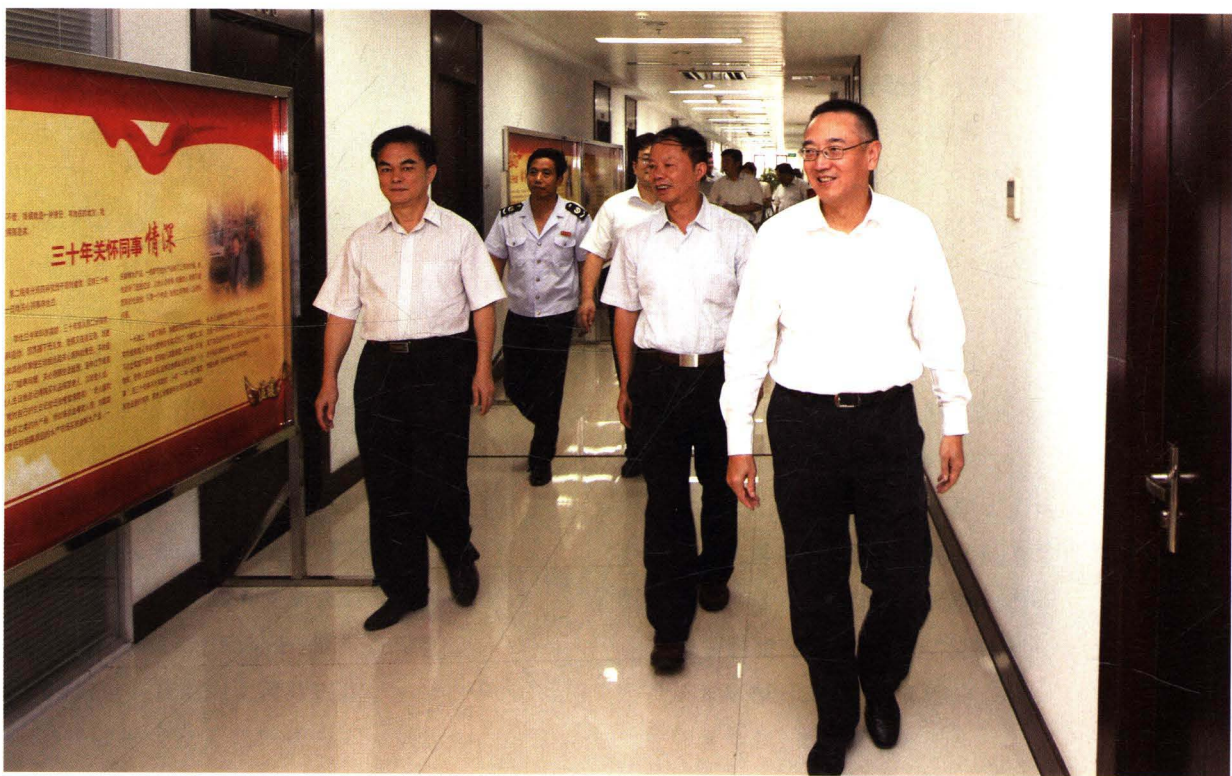
江苏省国家税务局局长范坚等省局领导参加常州道德讲堂活动