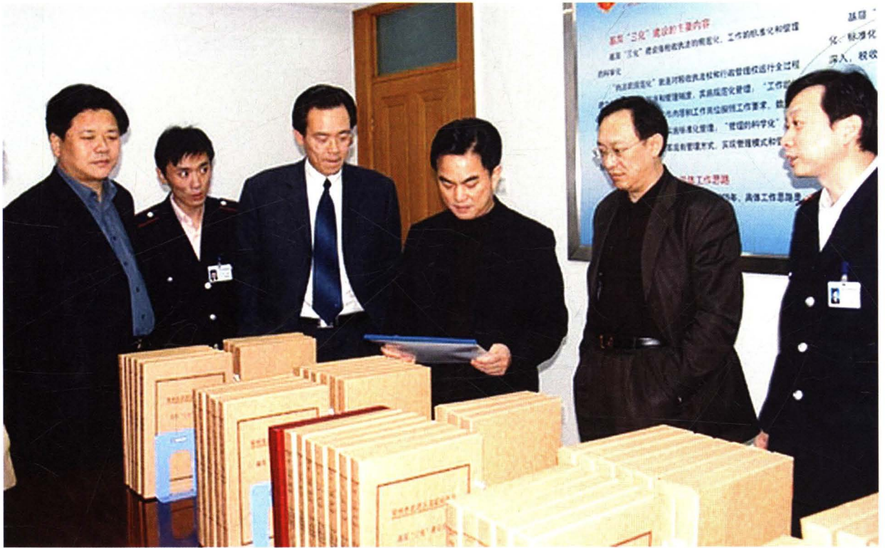
江苏省国家税务局副局长徐火财调研我局基层“三化”建设工作