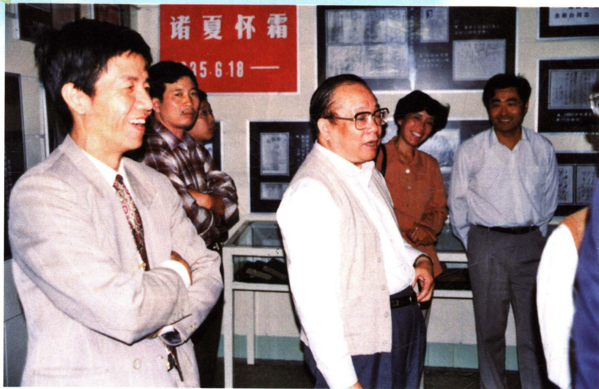
国家税务总局局长金鑫来常调研指导工作