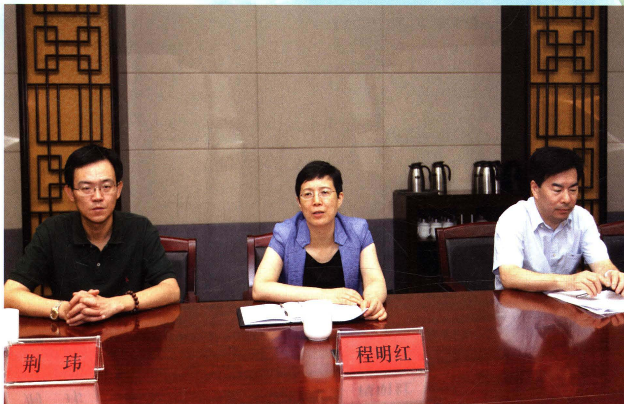
江苏省国家税务局总会计师程明红来局调研指导工作