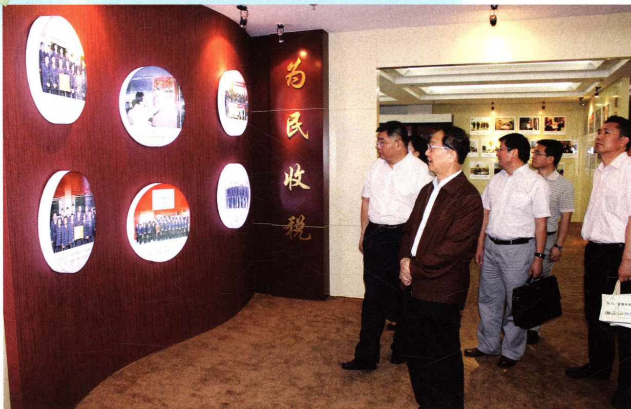
江苏省国家税务局副局长周柏柯来常调研，观摩国税文化建设成果展