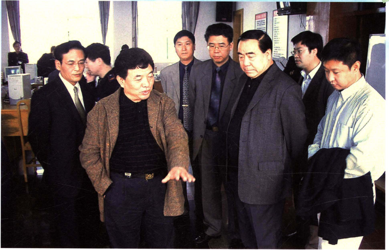
国家税务总局总局副局长崔俊慧调研常州国税稽查工作