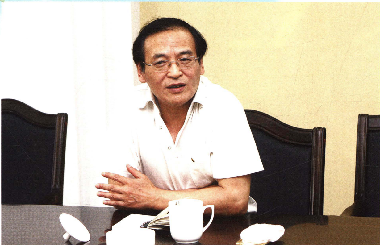
江苏省国家税务局副局长张士龙来常调研指导工作