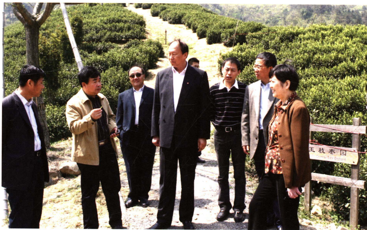
国家税务总局副局长钱冠林到溧阳茶场调研