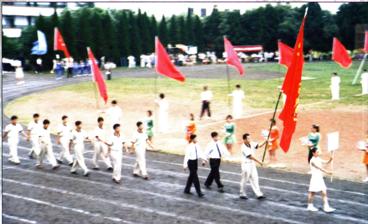
▲厂体育代表队参加省电力系统运动会