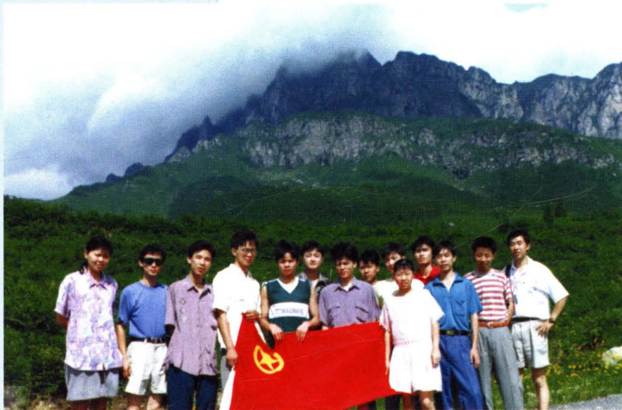
▲厂共青团组织野外活动