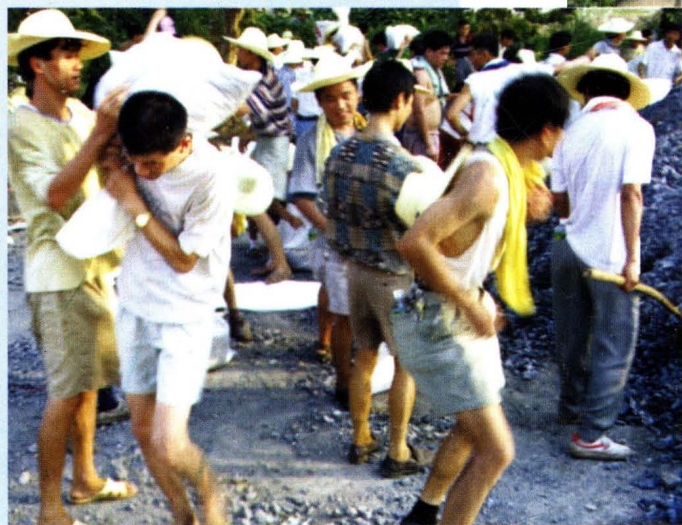
▲民兵在防洪抢险中