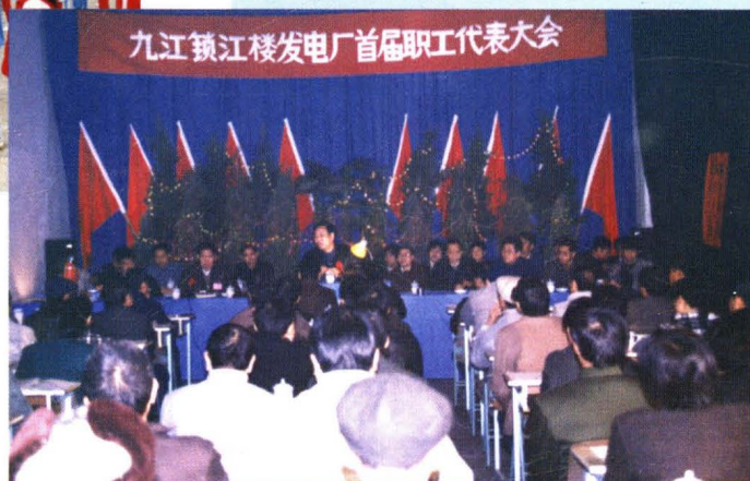
▲职工代表大会(1991年12月)