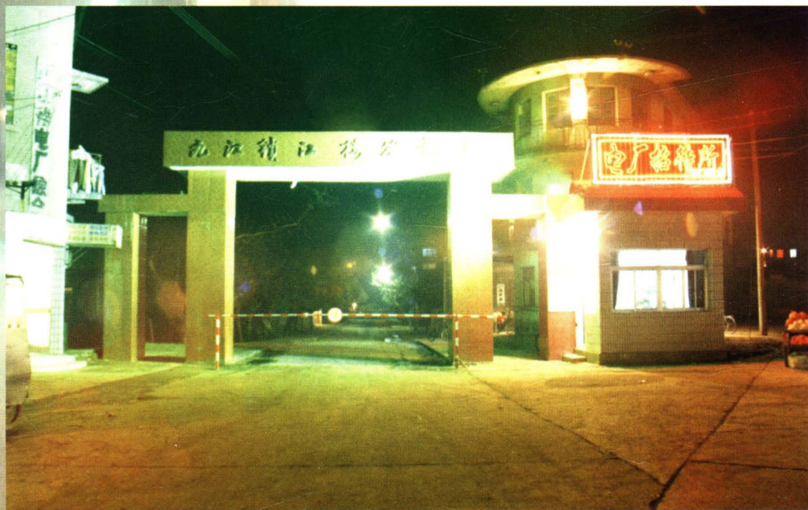
▲九江锁江楼电厂大门