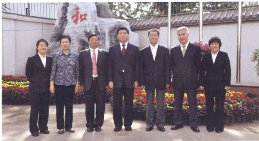
2008年四合庄村党总支委员