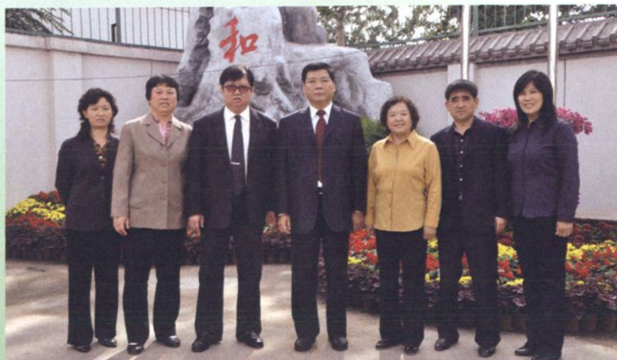
2008年四合庄村民委员会