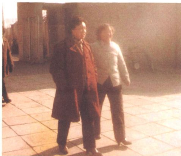
1988年北京市副市长何鲁丽（左一）视察四合庄幼儿园