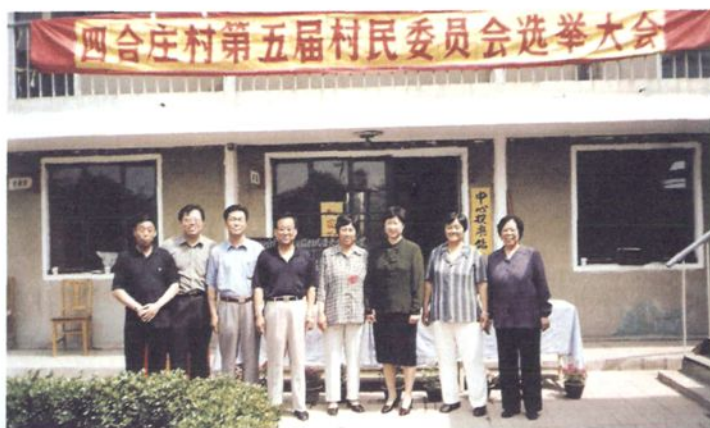
2001年丰台区委副书记杜瑞芹（右三）、农工委书记杨敬恭（左四）在花乡党委书记杨江洪（左二），乡长王春兰（右一）陪同下来四合庄检查村委会选举工作