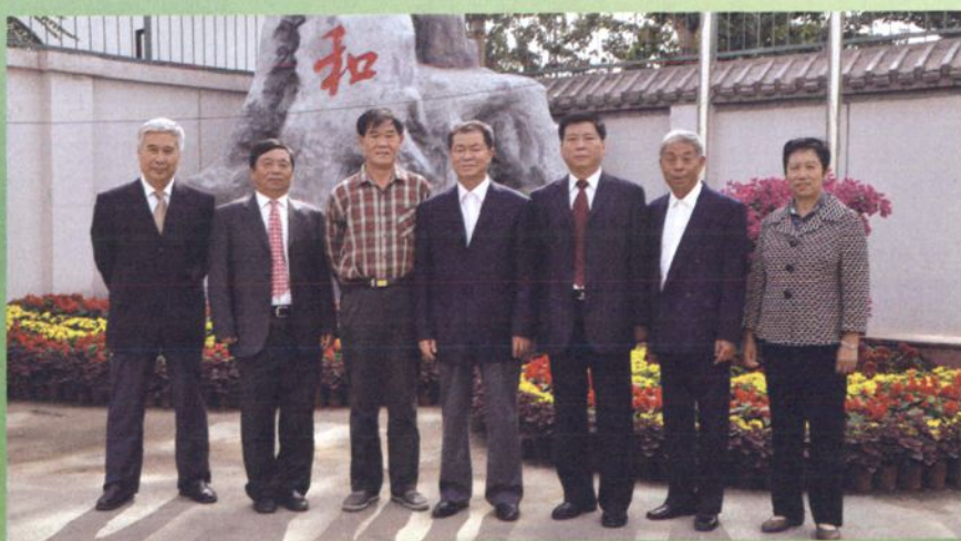
2008年四合庄兴鹏投资管理中心董事会成员