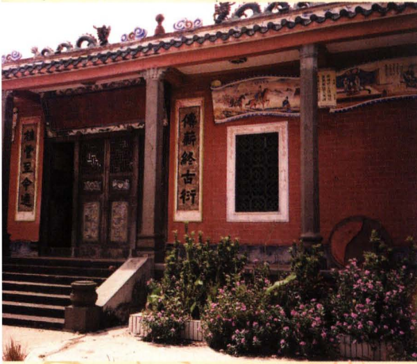
慈山古廟的楹聯 ——光緒六年那林村人進士鄭天章撰