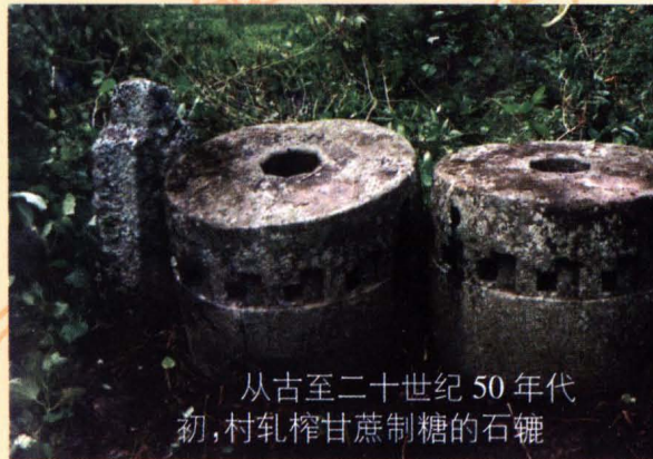
从古至二十世纪 50 年代初, 村乳榨甘蔗制糖的石轱