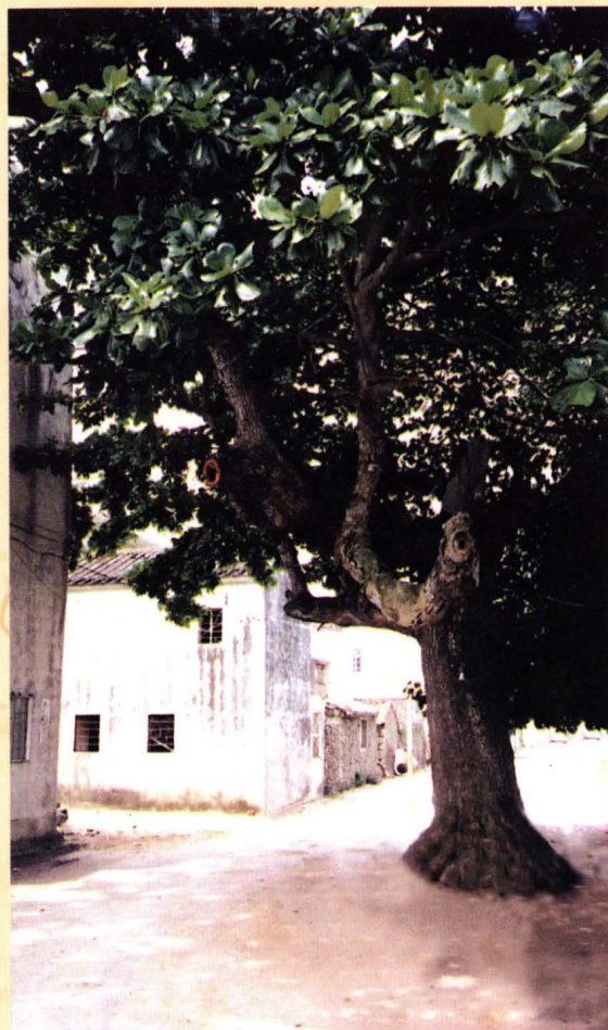
1881年种于村前的大琵琶树