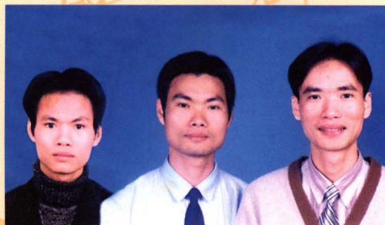
吴国礼之子(淘沙、陶陶、陶冶)捐 400 元