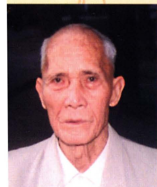
年 85 岁的 吴名优捐 300 元