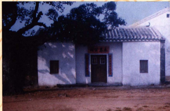
一九九四年重建的永奠公祠