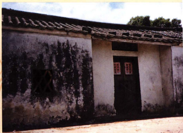
传桂第一支系垂裕宗祠