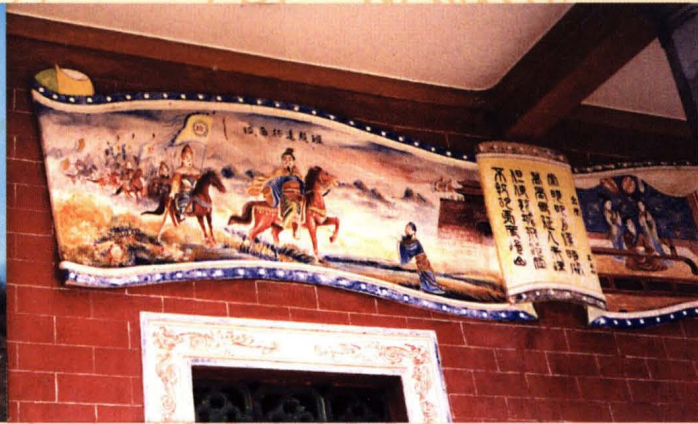
村廟牆上的壁畫——班超遠征西域圖