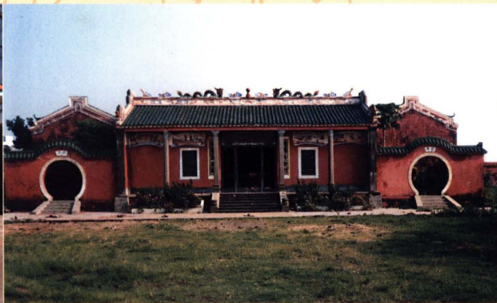
一九九三年重建的慈山古廟