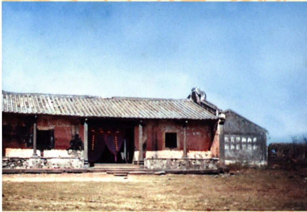
一九四八年重建的慈山古廟