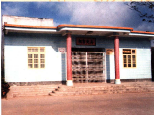
一九九四重建的吳氏宗祠