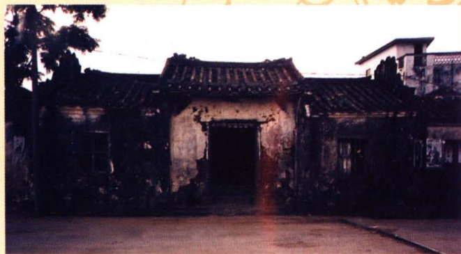
“文革”时受破坏后的毓笃宗祠