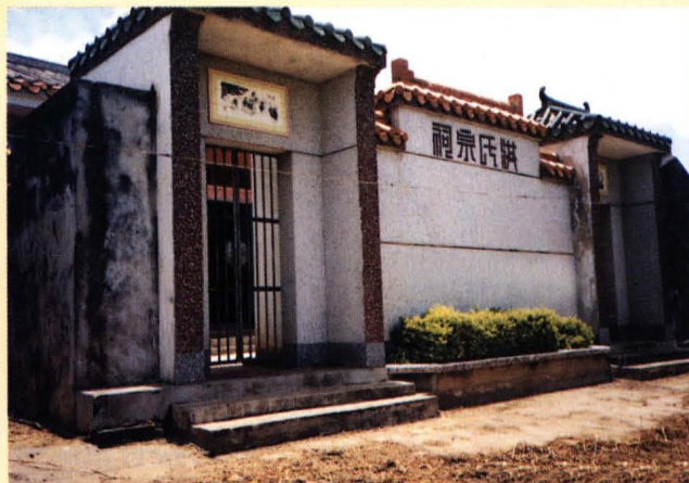
一九九二年重建的洪氏宗祠