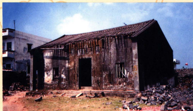
一九三九年重建的毓秀宗祠