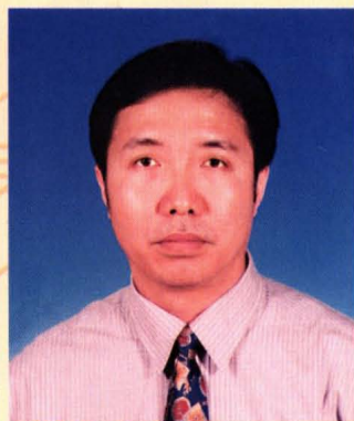
中国人民银行 吴萌捐 300 元