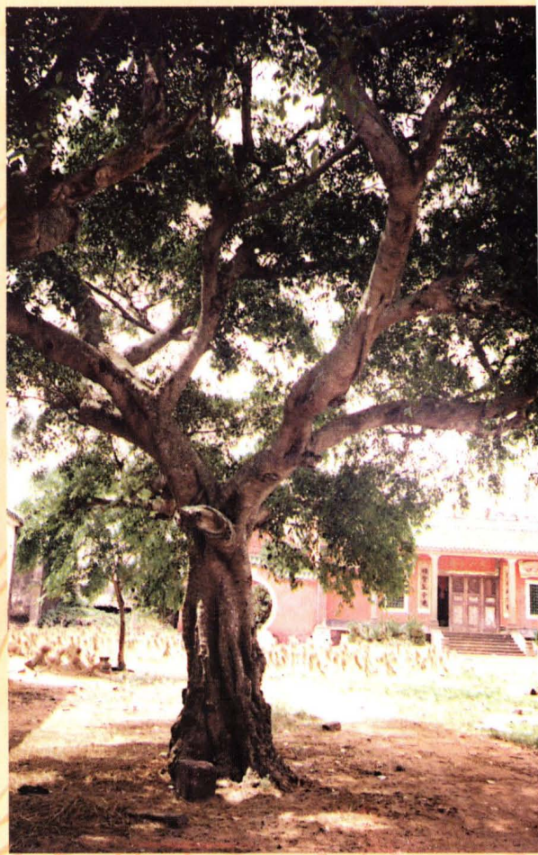
在村庙院中有200年树龄的白皮榕