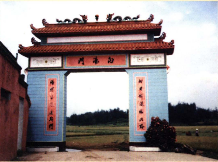
一九九三年重建村廟時並建起向陽門