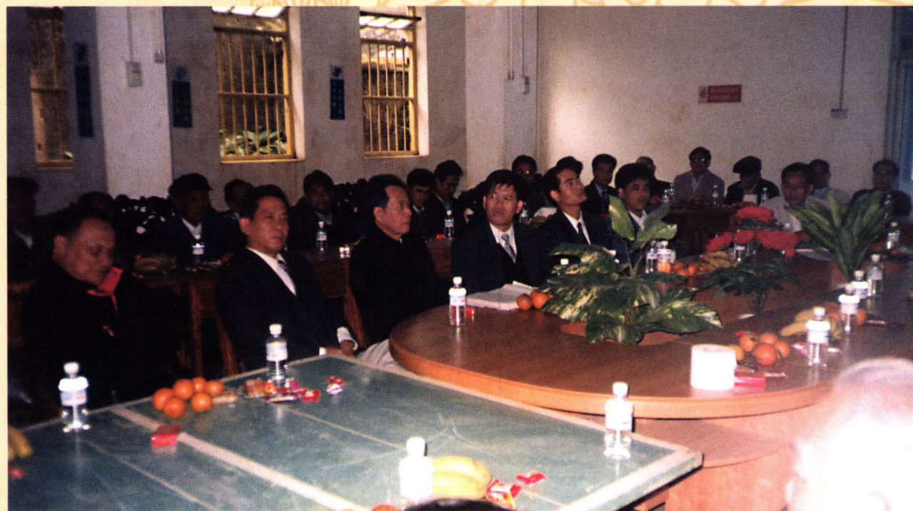
2001年春节,村中有识之士回来谈论《村志》和村中诸事