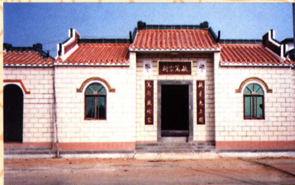
二〇〇一年重建的毓笃宗祠