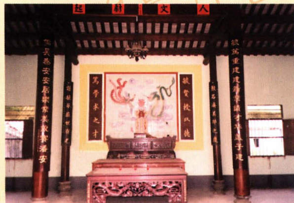
毓笃宗祠内的神堂