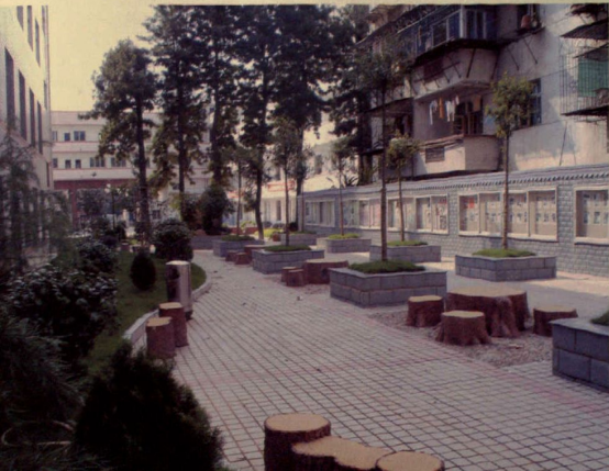
赣七中学校文化园一角

在未来几年内,赣州七中将以“高质量、有特色、现代化”为目标,迈入快速发展的黄金时期,为争创省示范性学校而努力奋斗,续写七中教育史上新篇章。