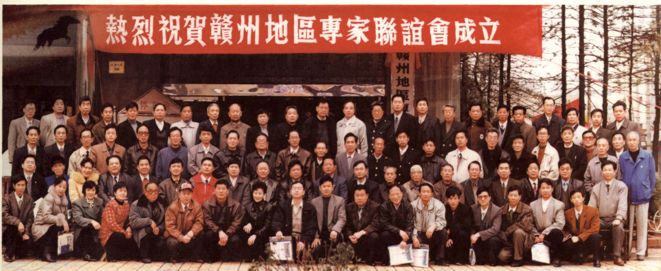
1999年3月22日赣州地区专家联谊会成立