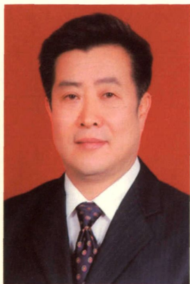
中共赣州市委常委、市政府常务副市长、赣州市专家联谊会名誉会长 骆炳峰