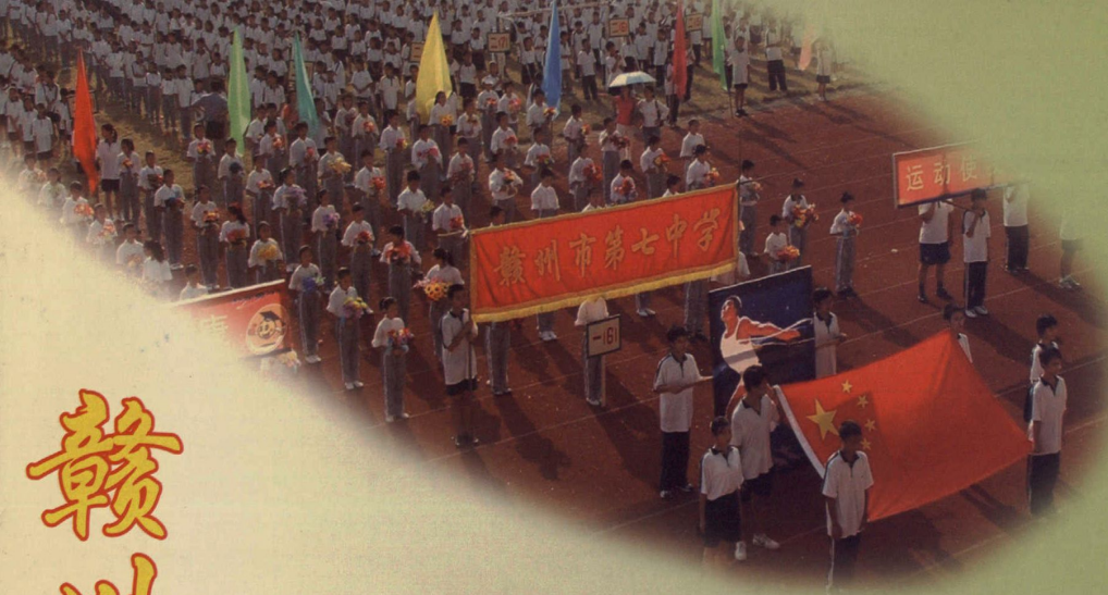
赣七中学校田径运动会