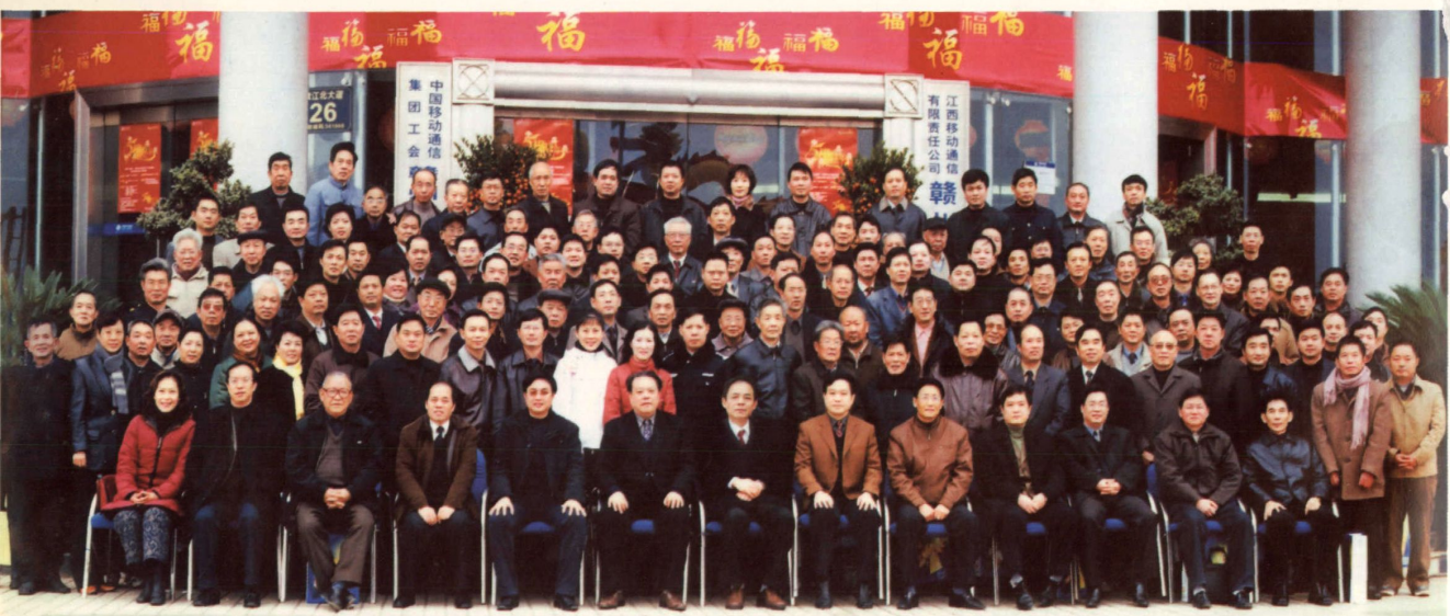
2006年1月24日赣州市专家联谊会召开专家迎春座谈会