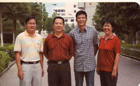
团结奋进的领导班子