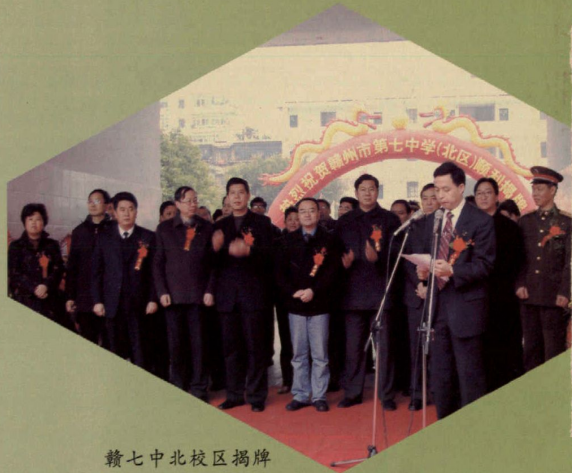
赣七中北校区揭牌

赣州市第七中学,位于赣州市中心城区。创建于1970年,已走过了36个春秋,为高一级学校输送了一批批优秀学子。2006年1月,赣州七中合并了原赣州六中,从此,新的赣七中横跨南北两个校区。南校区位于繁华的南门文化广场附近,北校区坐落在著名文化景点郁孤台下,校园内绿树葱茏、清雅宁静,文化氛围得天独厚。学校现有54个教学班,学生3613人,在职教职工213人,专任教师201人,已成为赣州市规模最大的初级中学。