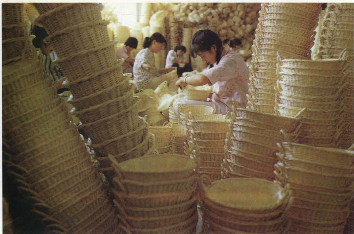
(25) 白条柳编是主要出口产品