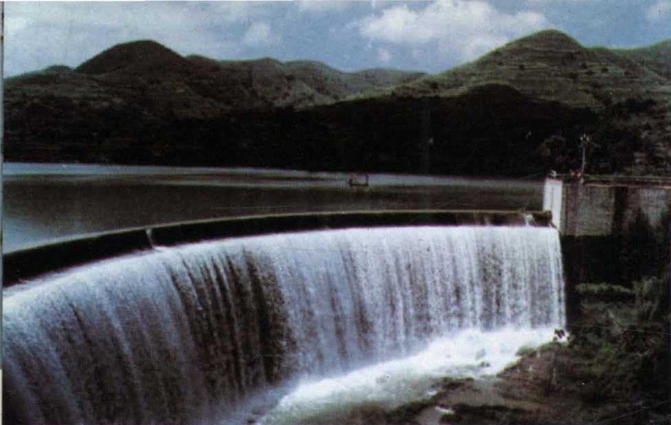
(19) 全省有大中小型水库1689座，是防洪排涝的骨干工程