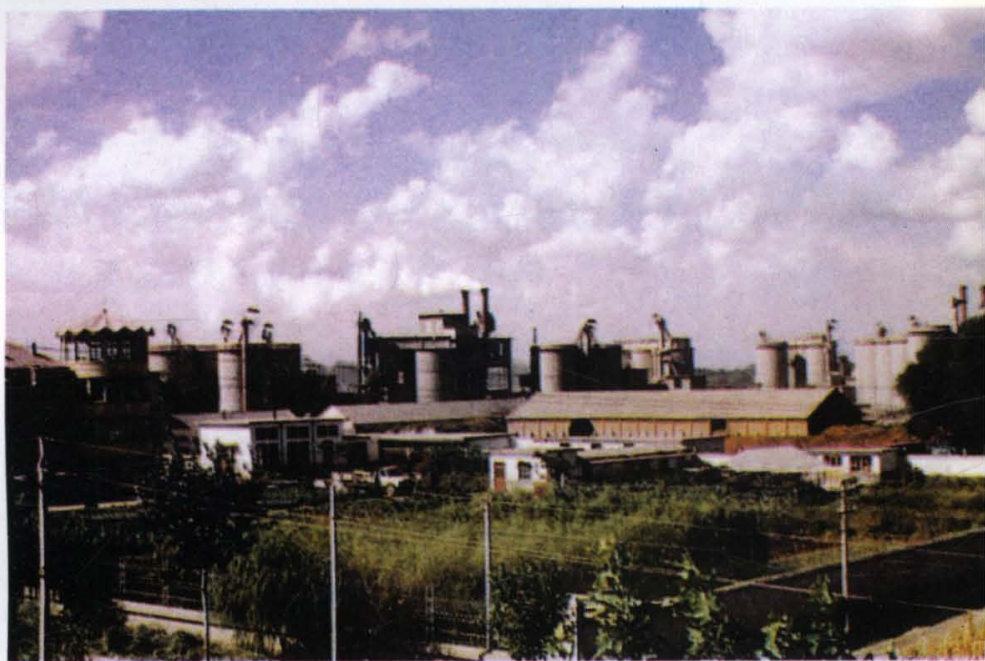
(23) 山东乡镇企业 异军突起，自“八五” 以来，跃居全国前列