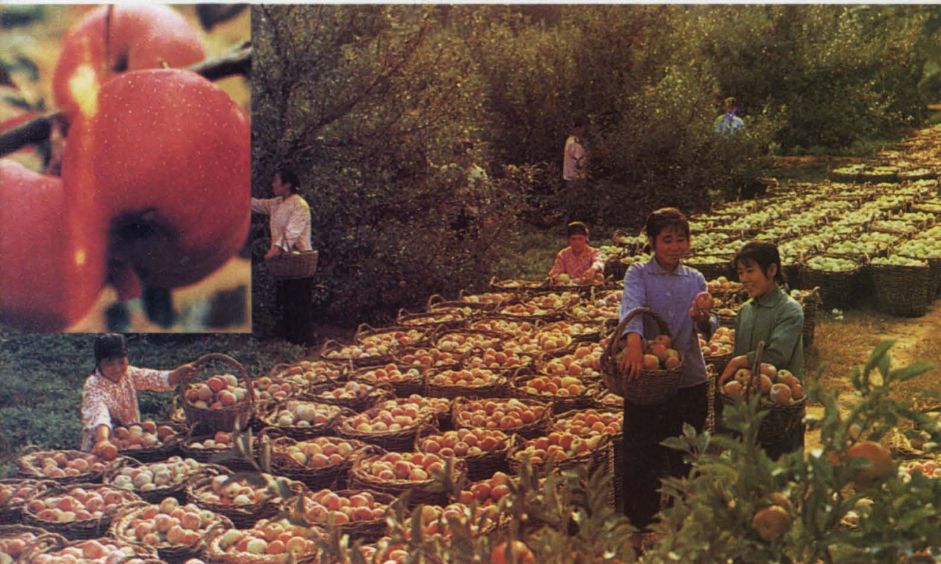
(5) 又一个“大年”（左上图为型美色艳、汁多脆甜的红富士苹果）