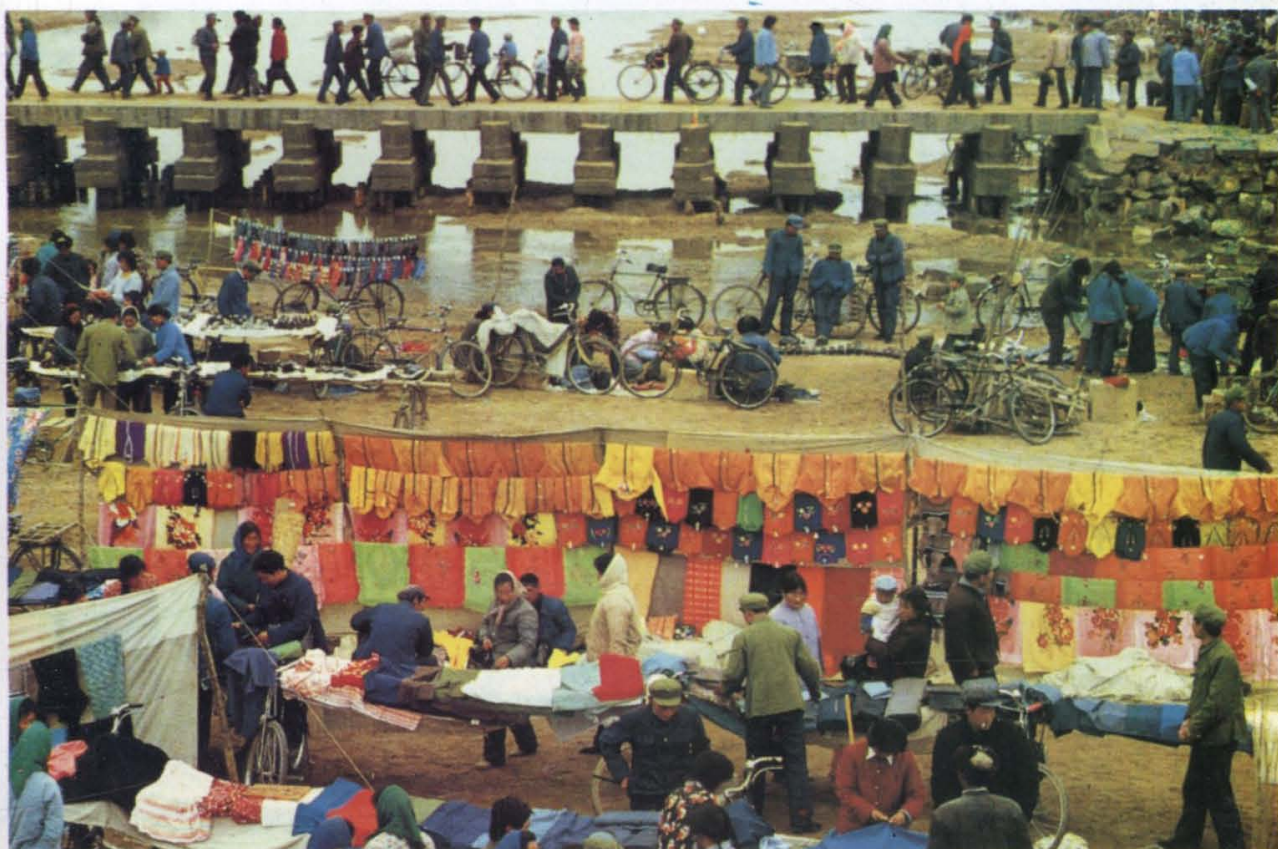
(28) 农民富了，集市火了