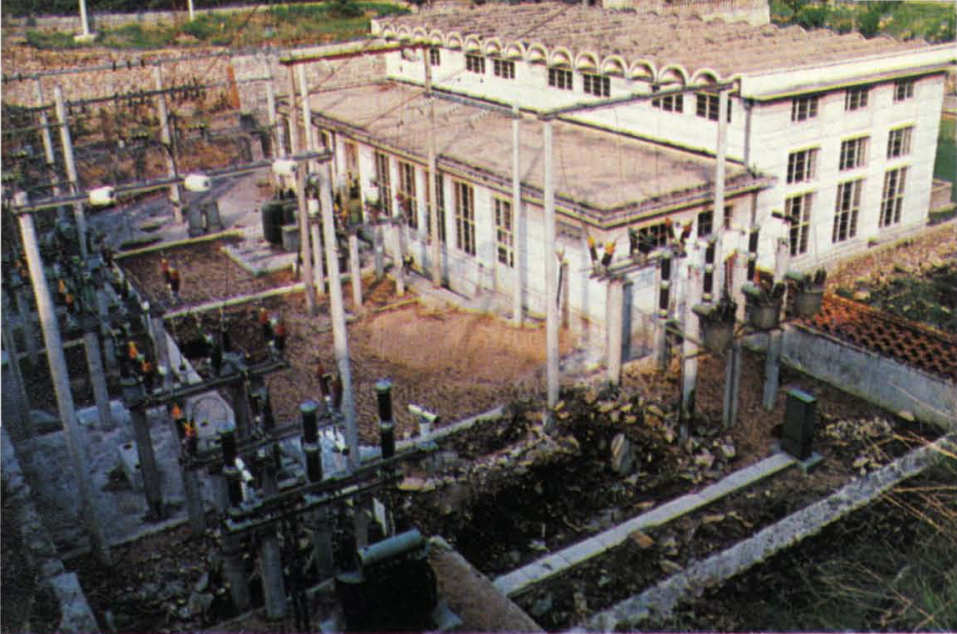
(22) 山区发电厂并网发电