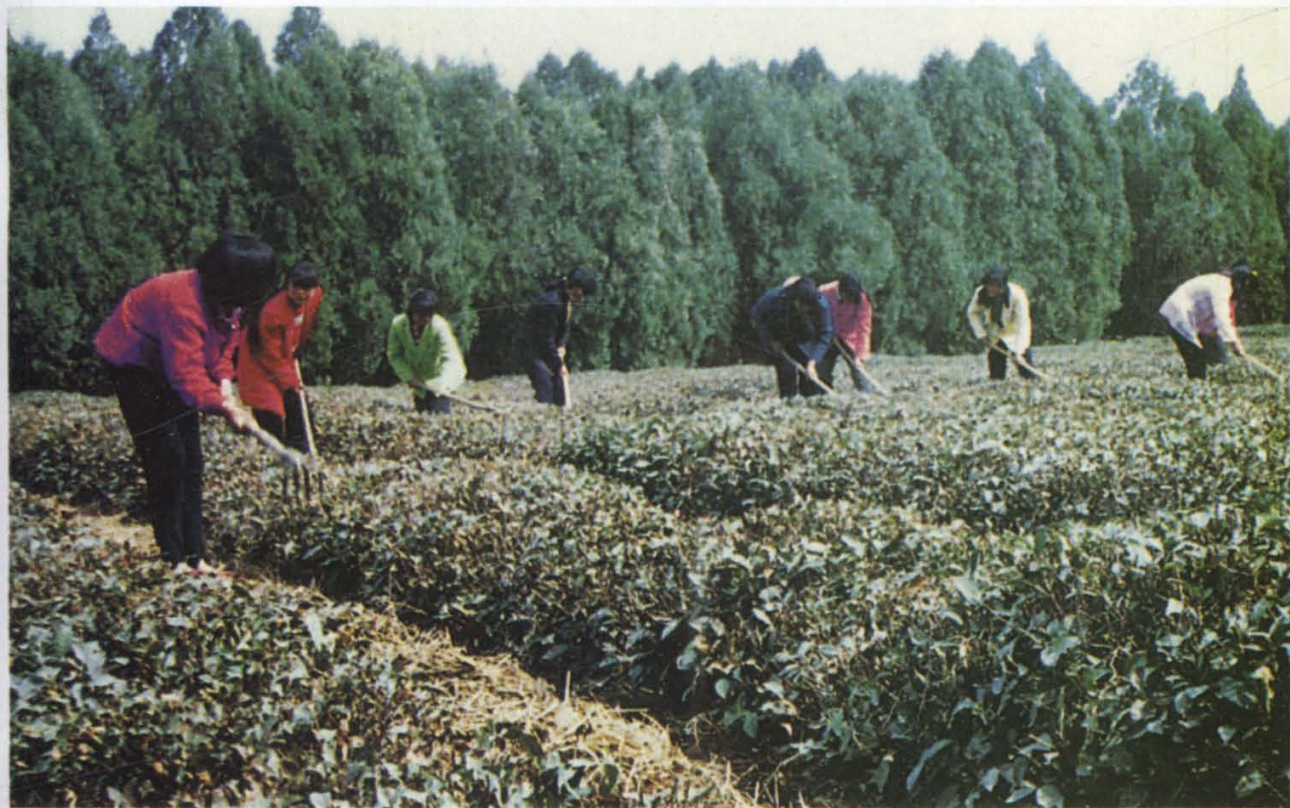
(18) 南茶北移，获得成功