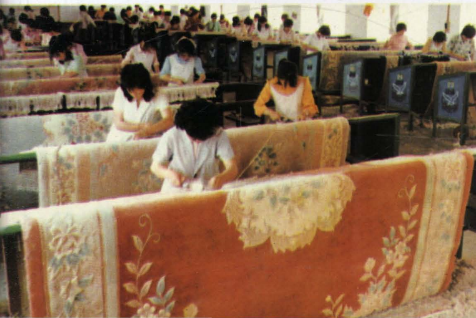
(24) 乡镇企业立足当地资源，以农副产品加工为主，发展劳动密集型产业，几千种产品已进入国际市场