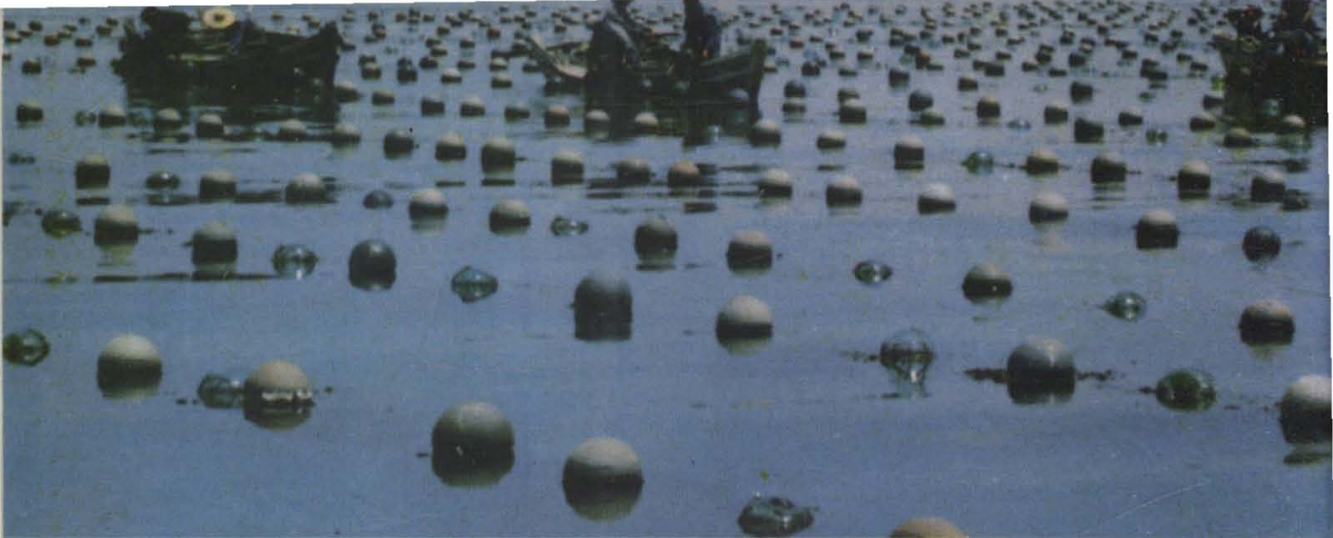
(14) 山东海岸线3000多公里，发展海水养殖大有可为