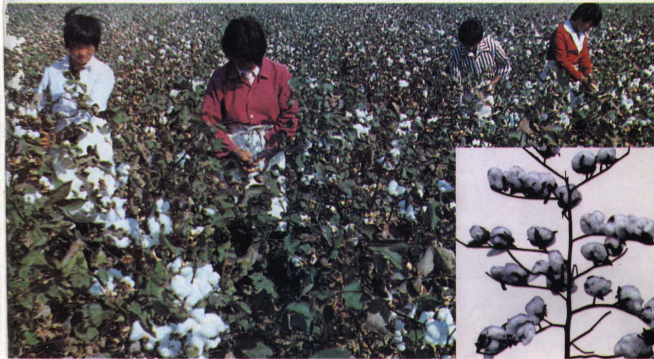
(2) 农民喜摘新棉 (右下图为山东第一个超常规的低酚棉新品种鲁棉12号)