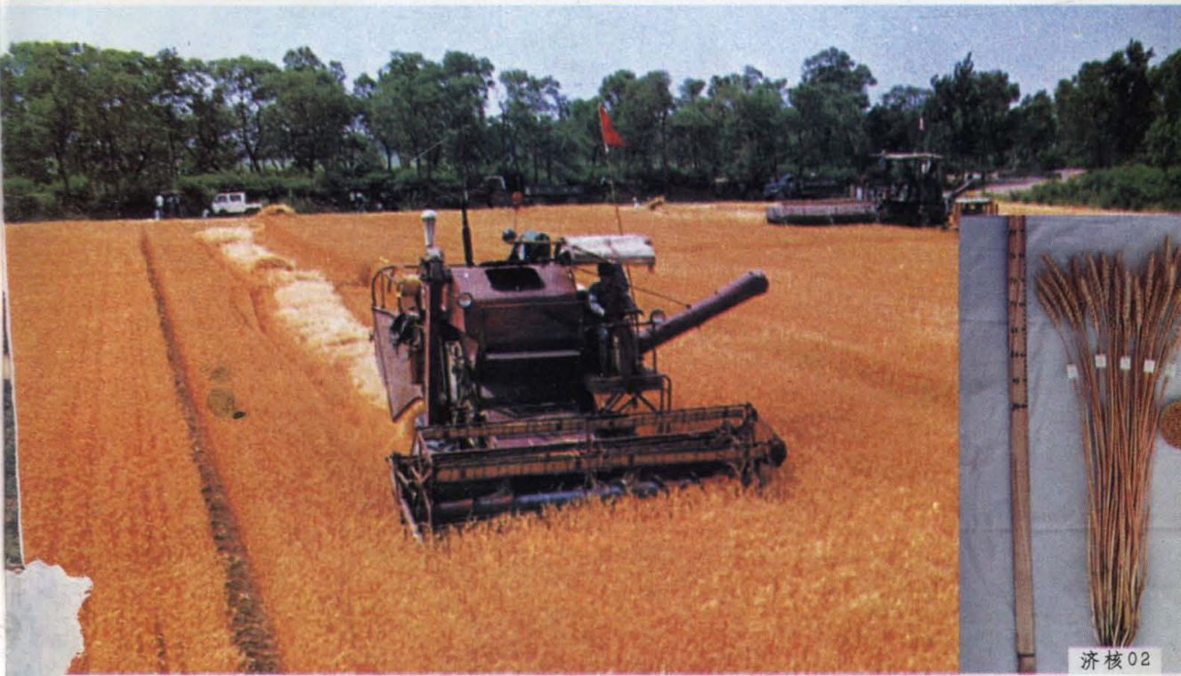
(1) 山东是中国冬小麦主产区，自1991年以来，总产量连续居全国第一 (右下图为小麦新品种济核02)