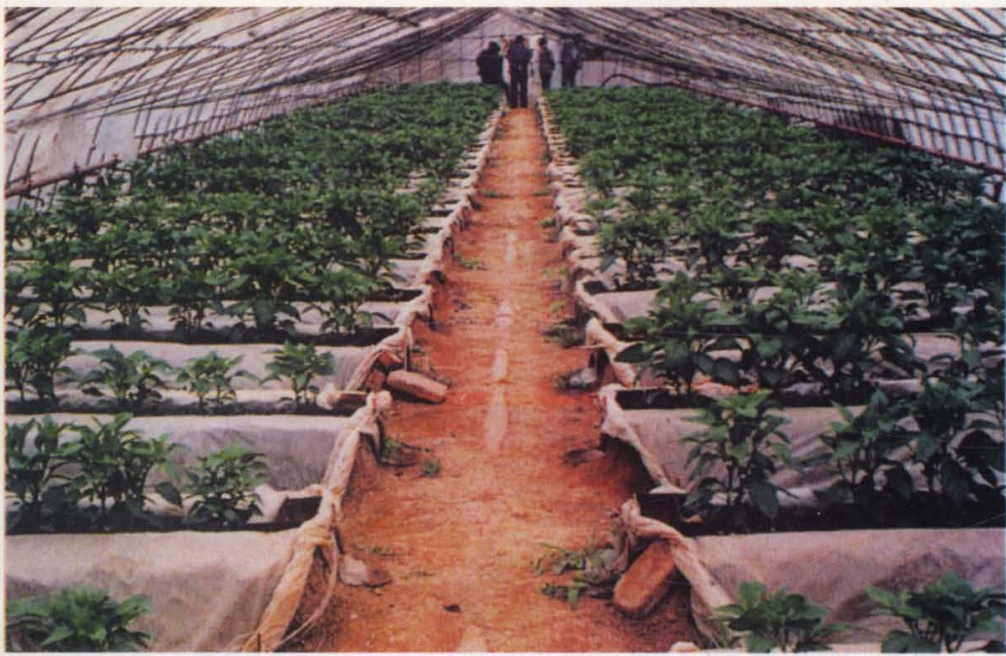
(3) 改革开放以来，山东大棚蔬菜有很大发展