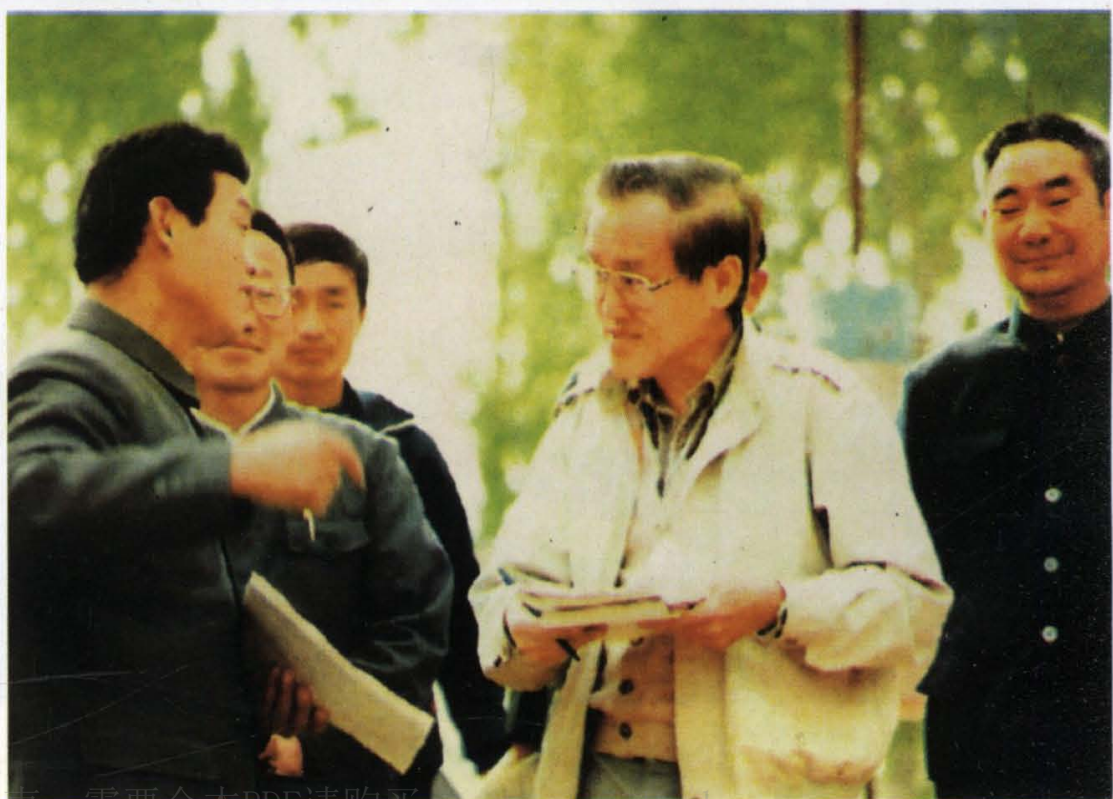
(30) 世行专家进行项目评估