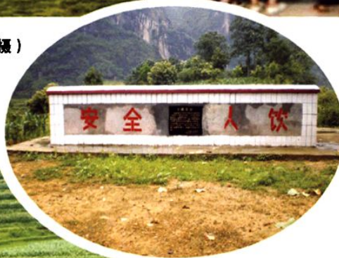
(图-50) 白泥镇民同村渴望工程 (2006年摄)