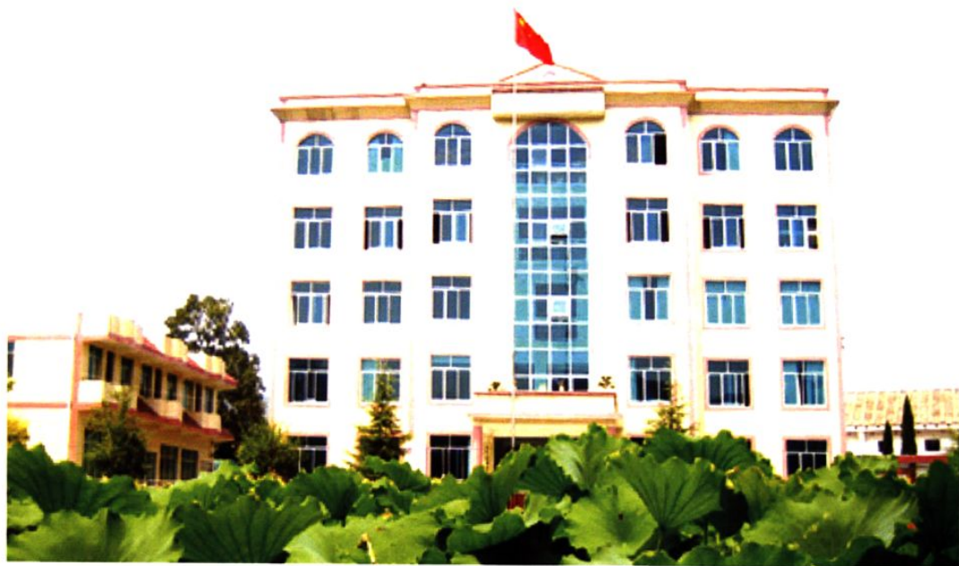
(图-29) 龙家镇政府一角 (2005年摄)