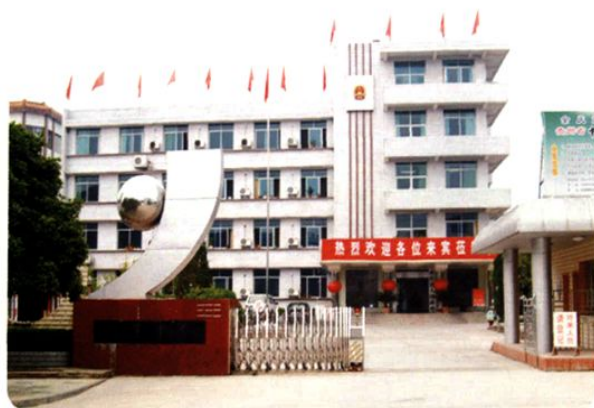
(图-23) 县人民政府办公大楼 (2006年摄)