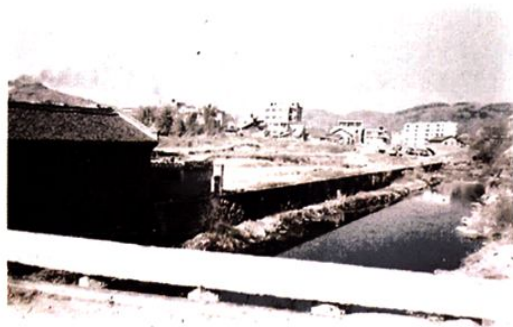
(图-30) 敖溪镇河滨路旧貌 (1998年摄)