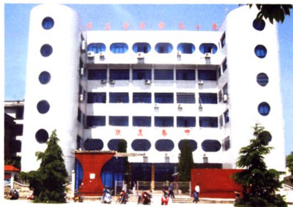
(图-22) 1998年修建的县委机关办公大楼