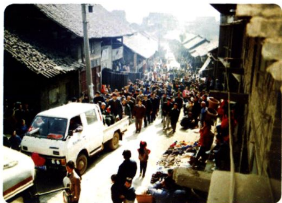
(图-33) 松烟镇街道旧貌 (1998年摄)