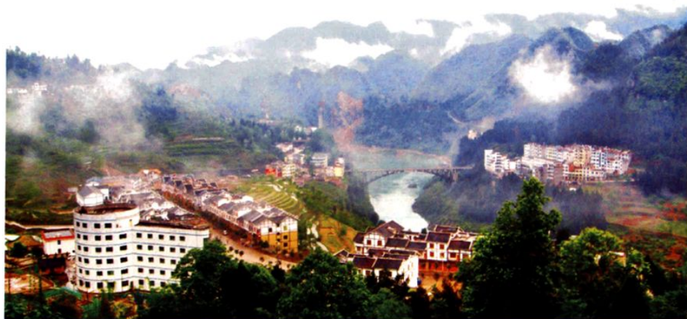
(图-35) 新建的大乌江镇 (2008年摄)