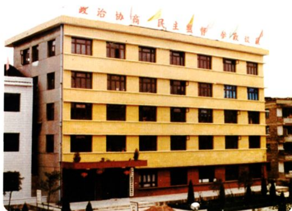
(图-24) 县政协机关办公大楼 (2005年摄)