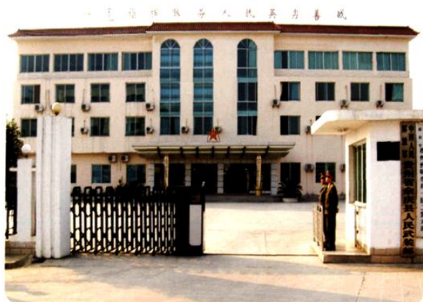
(图-25) 县人民武装部办公大楼 (2005年摄)