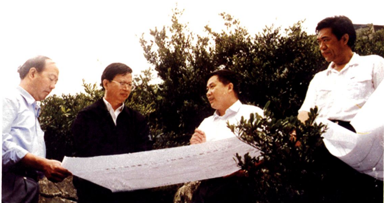
(图-5) 2002年4月中共贵州省委书记钱运录(左二)在中共遵义市委书记傅传耀(左一)、遵义市人民政府副市长吴承斌(右一)陪同下到余庆视察工作