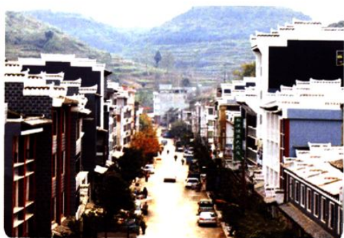
(图-31) 敖溪镇土司风情一条街 (2008年摄)