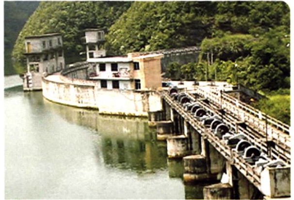
(图-46) 方竹电站大坝 (2005年摄)