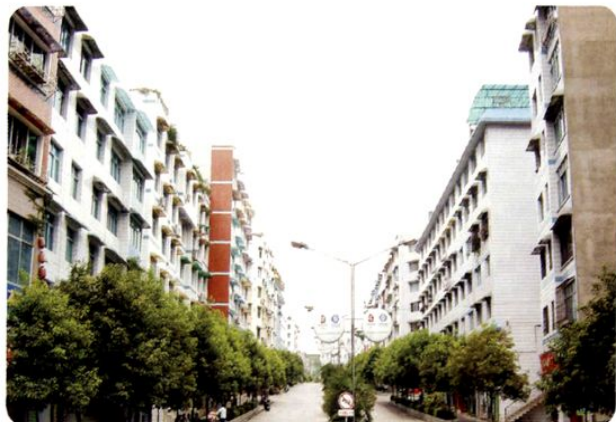
(图-15) 县城香港路 (2005年摄)