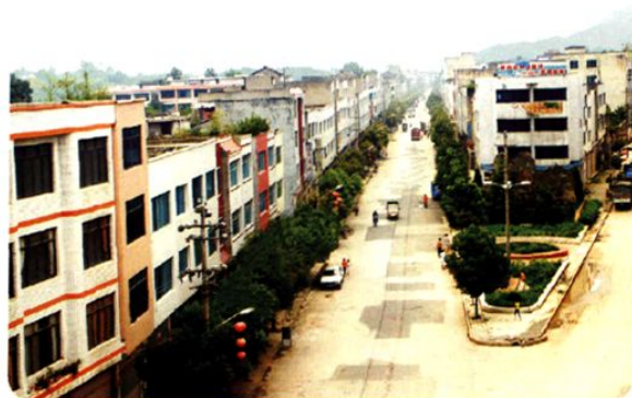
(图-34) 松烟镇街道新貌 (2005年摄)