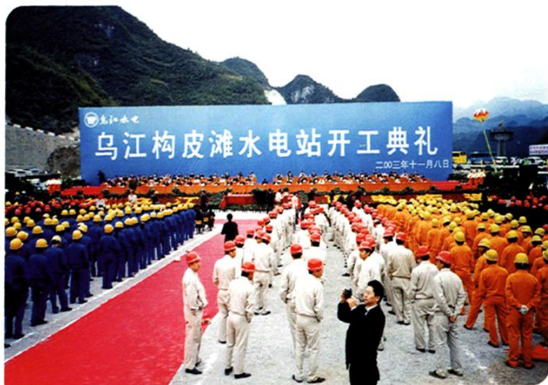
(图-41) 乌江构皮滩电站开工典礼 (2003年11月8日摄)