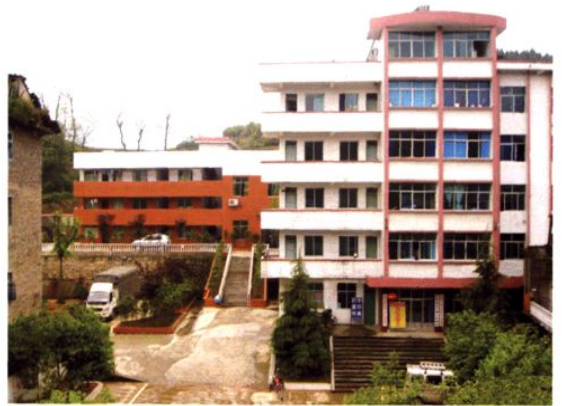
(图-39) 关兴镇一角 (2005年摄)