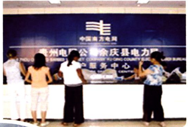
(图-48) 县电力公司客户服务中心 (2005年摄)