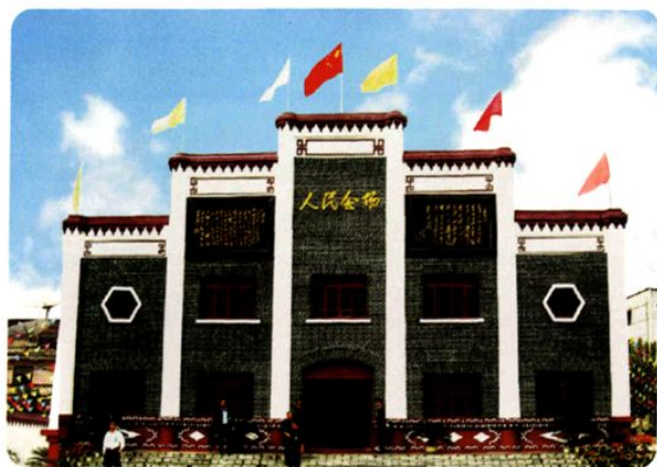
(图-27) 1957年修建的人民会场