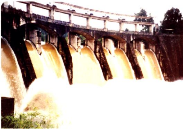
(图-45) 团结水库加闸工程 (2005年摄)