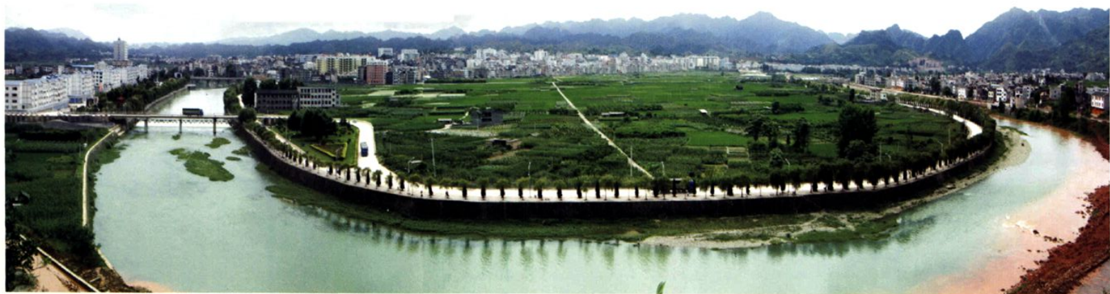
(图-10) 县城远眺 (2009年7月摄)