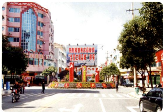
(图-14) 县城乌江路一角 (2008年摄)