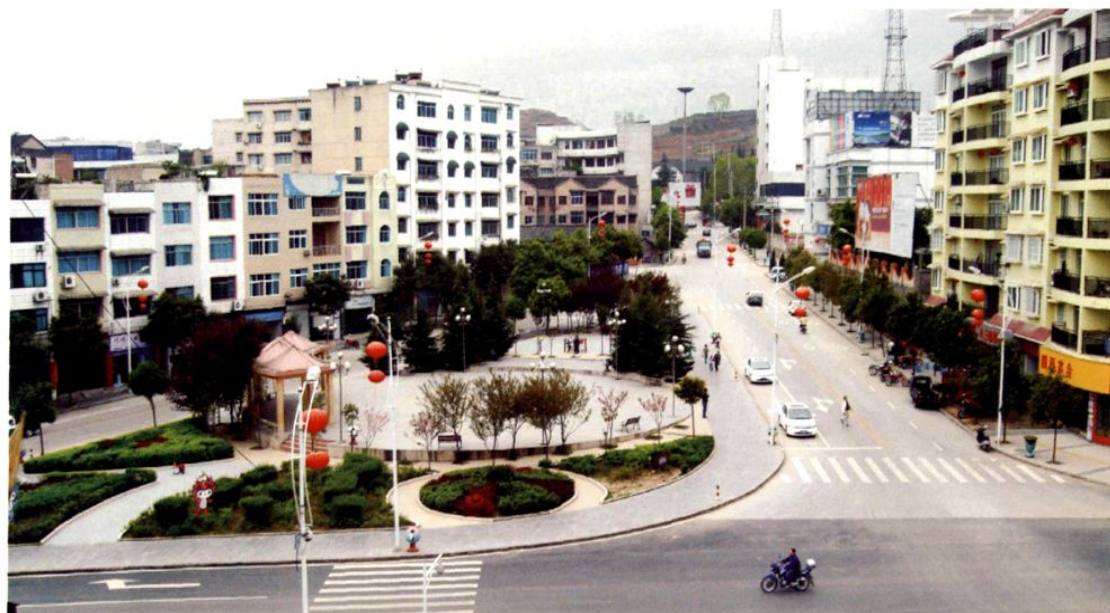
(图-17) 县城子营社区一角 (2008年摄)