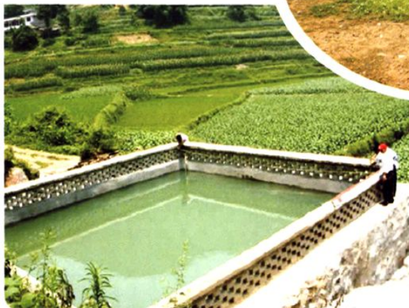
(图-49) 龙家镇光辉村上中坝村民组烟水配套工程 (2008年摄)