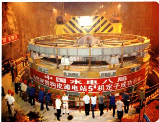
(图-43) 构皮滩电站5号机定子成功安装 (2008年摄)