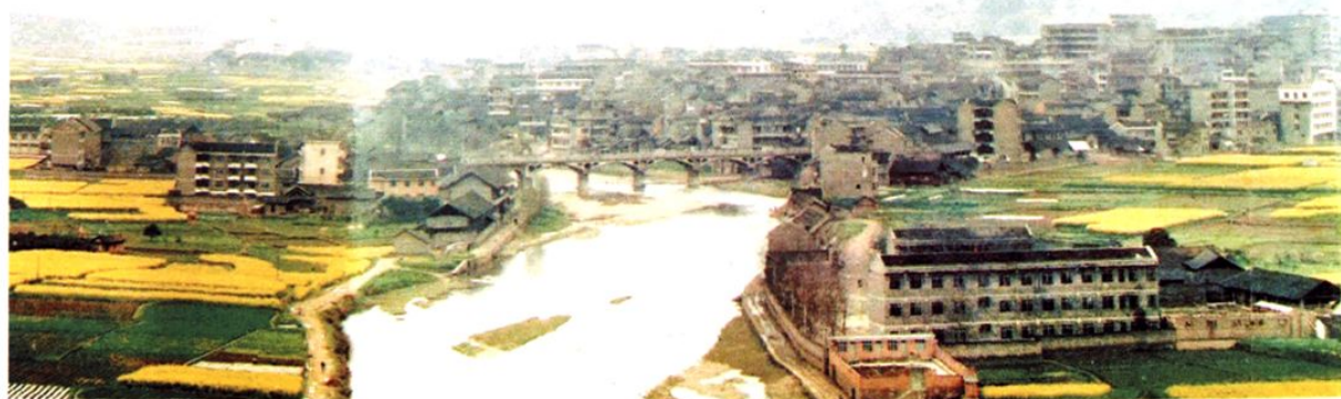
(图-12) 县城河滨公园旧貌 (1992年摄)