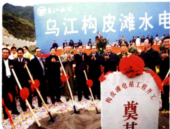
(图-42) 2003年11月8日省委书记钱运录 (左六)、省长石秀诗 (右五) 等领导为乌江构皮滩电站奠基