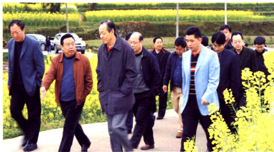
(图-9) 2007年3月贵州省人民政府副省长包克辛(右二)到余庆考察工作,中共余庆县委书记杨兴友(左二)、余庆县人民政府县长宋晓路(右一)陪同