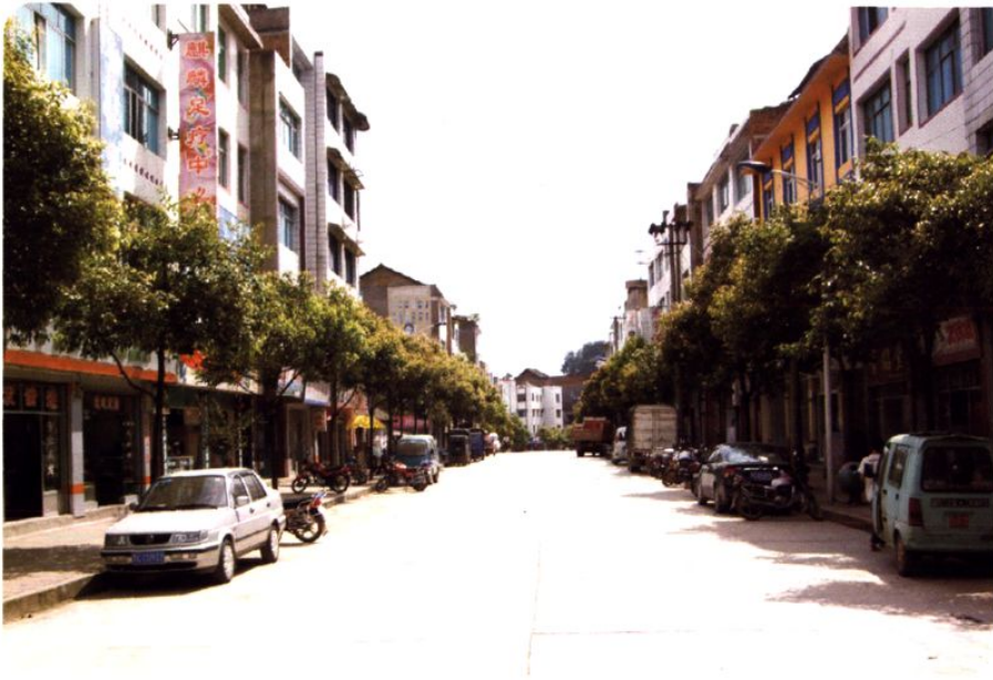
(图-37) 构皮滩镇一角 (2005年摄)