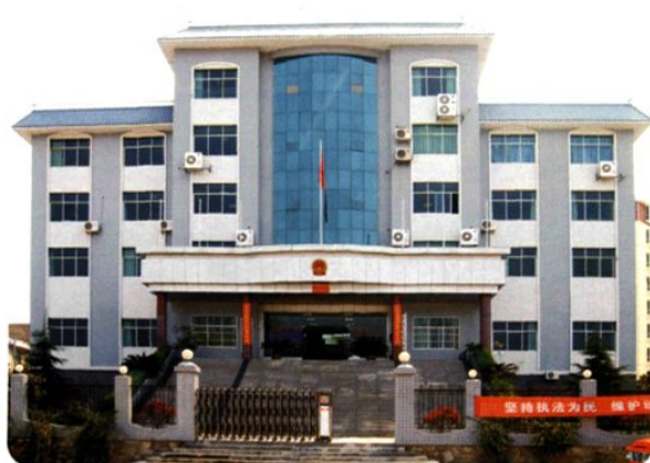
(图-28) 县人民检察院办公大楼 (2006年摄)