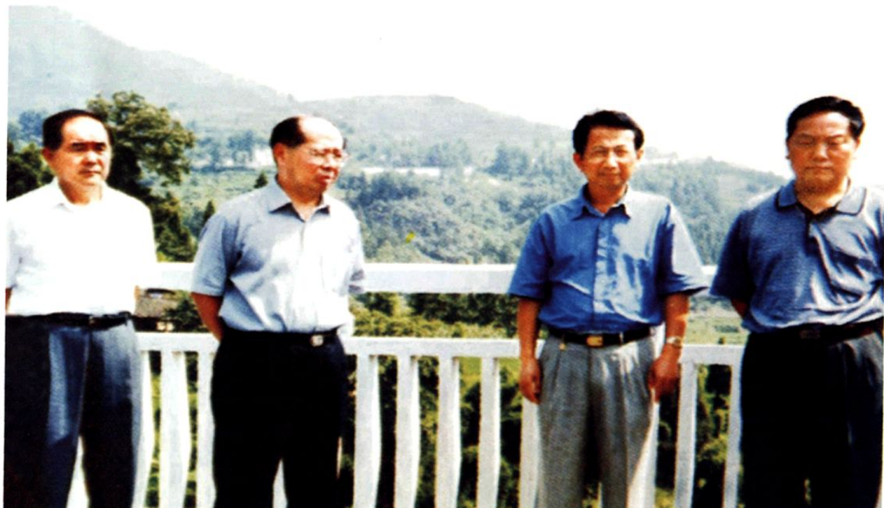
(图-6) 2002年7月国家交通部部长黄镇东(左二)在余庆视察公路建设