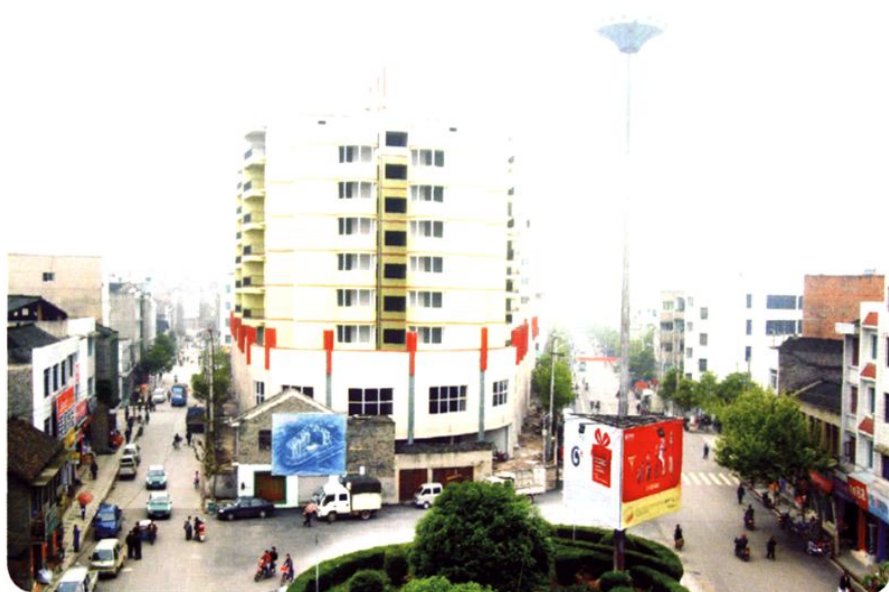
(图-18) 县城兴隆路新貌 (2009年摄)