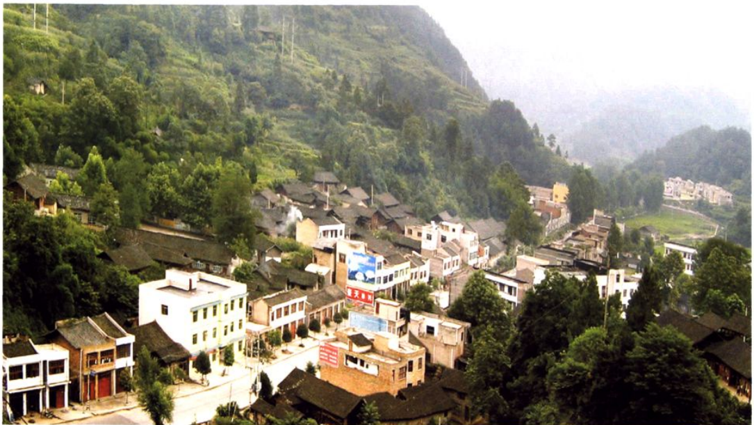
(图-40) 小腮镇一角 (2005年摄)