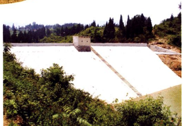
(图-51) 龙家镇茶溪水库防渗工程 (2008年摄)