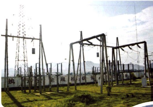
(图-47) 县城110千伏变电站 (2005年摄)