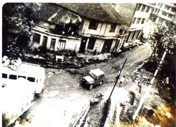
(图-19) 县城兴隆路旧貌 (1986年摄)