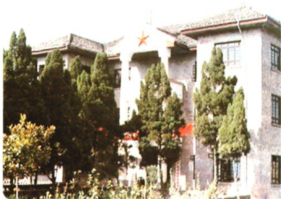
(图-21) 1953年修建的县委机关办公大楼