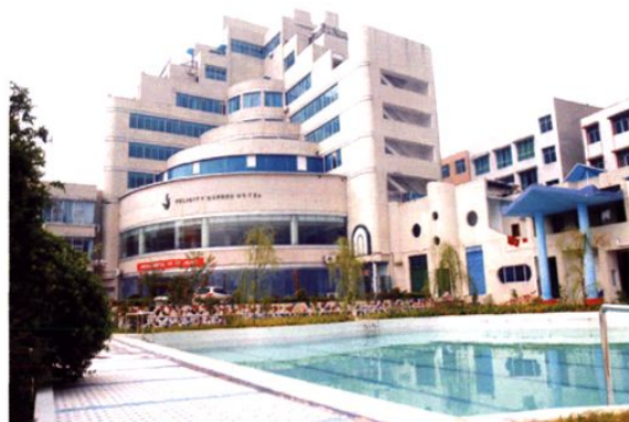
(图-20) 县城富临花园酒店 (2008年摄)