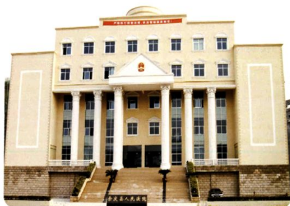
(图-26) 县人民法院办公大楼 (2008年摄)