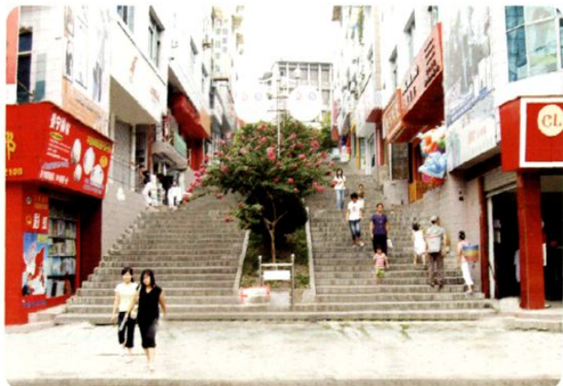
(图-16) 县城步行街 (2005年摄)