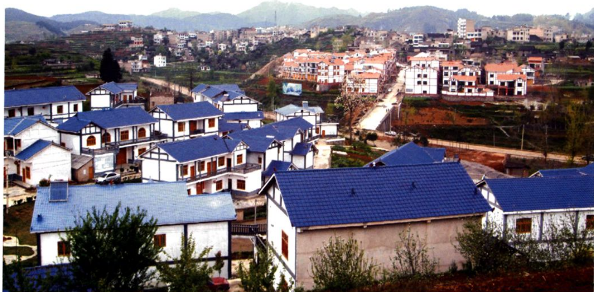
(图-36) 龙溪镇新貌 (2008年摄)