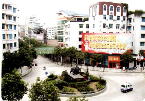
(图-13) 县城中华路一角 (2005年摄)