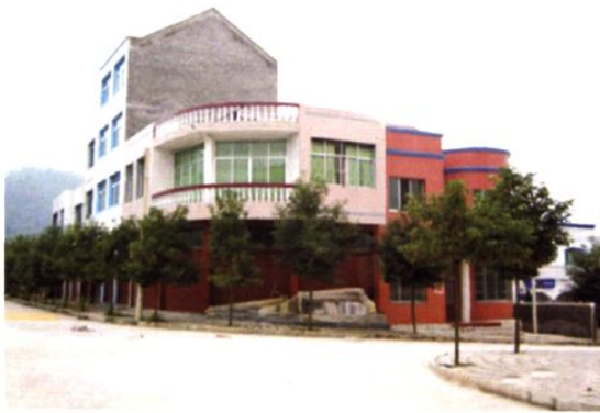
(图-38) 花山苗族乡一角 (2005年摄)