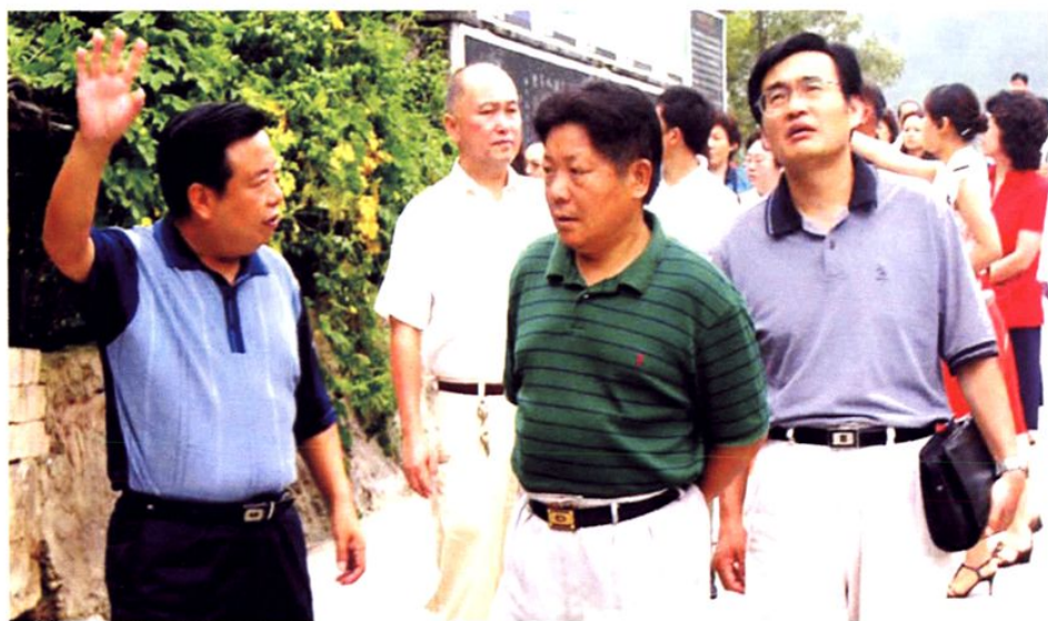
(图-8) 2006年8月中央党校副校长孙庆聚(左二)到余庆考察新农村建设,中共余庆县委书记杨兴友(左一)陪同