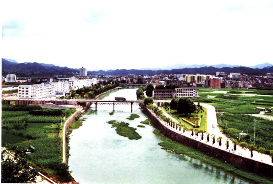
(图-11) 县城河滨公园新貌 (2009年摄)