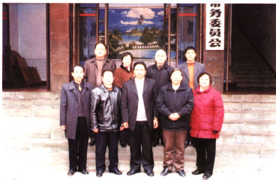
县十四届人大常委会正副主任