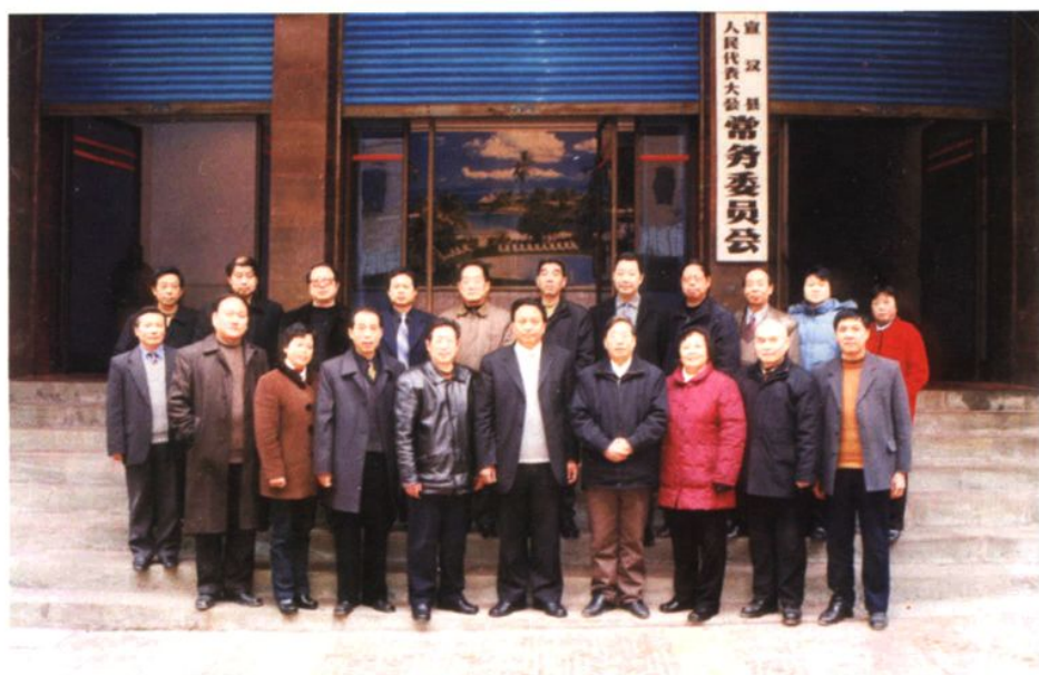
县十四届人大常委会组成人员