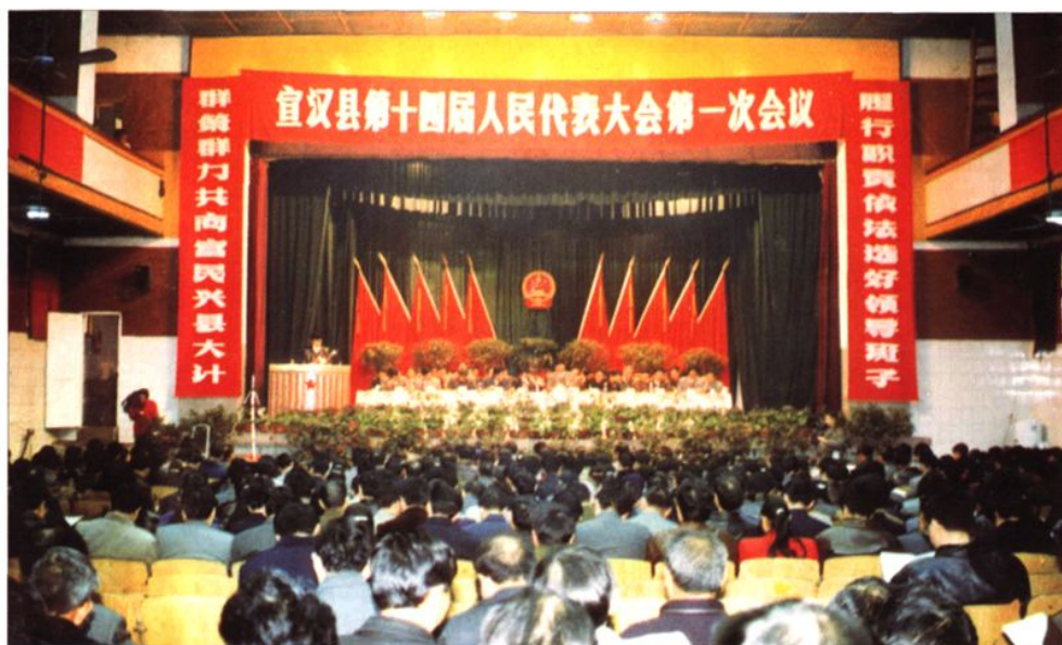
1998年3月，县十四届人大一次会议会场