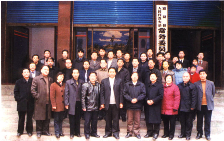
县十四届人大常委会组成人员、机关工作人员欢送退休老领导