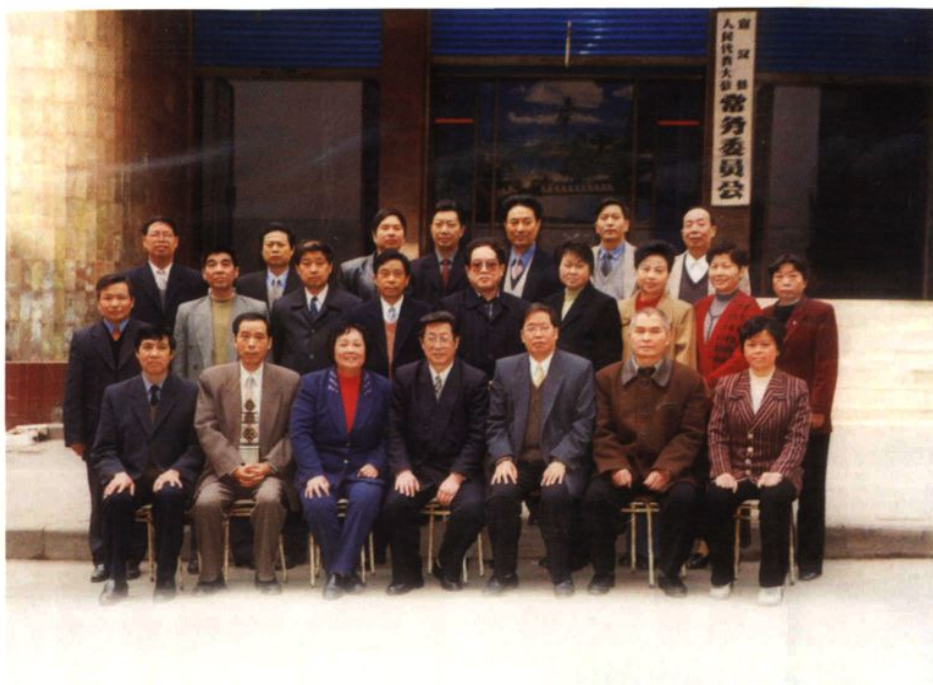
县十四届人大常委会组成人员