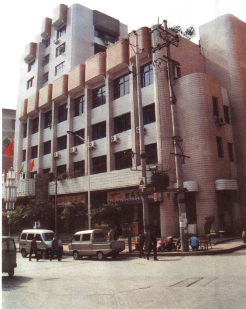
宣汉县人大常委会办公楼