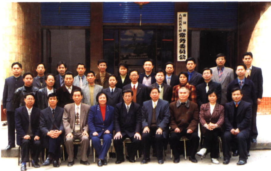
县十四届人大常委会机关工作人员