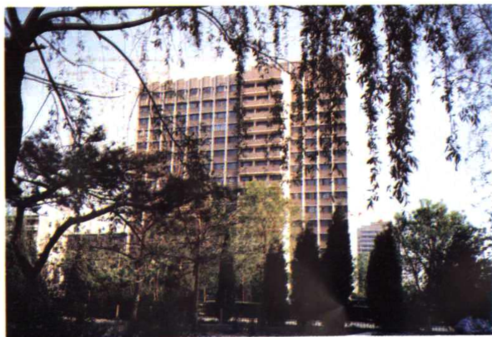
北三环东路17号“陕甘宁青皖黔滇驻京办事处大楼”