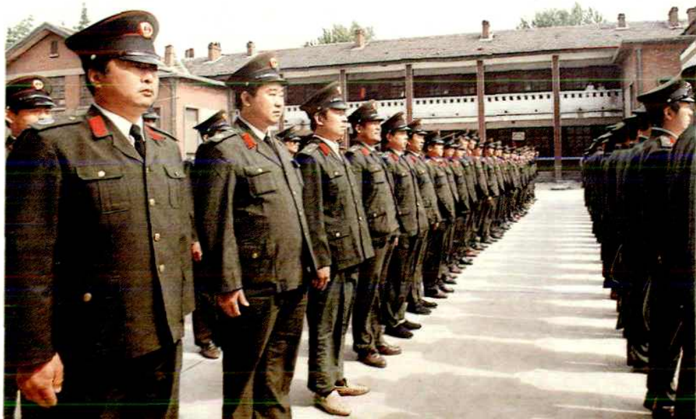
集中培训运管人员