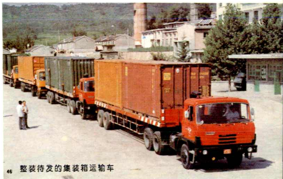
46 整装待发的集装箱运输车