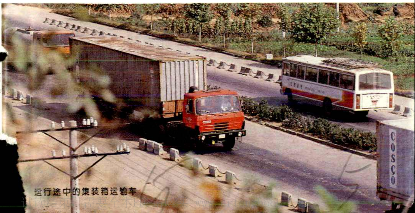
运行途中的集装箱运输车