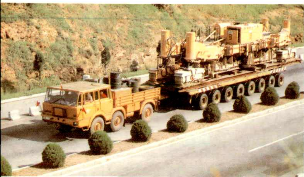
运行途中的大型平板拖车