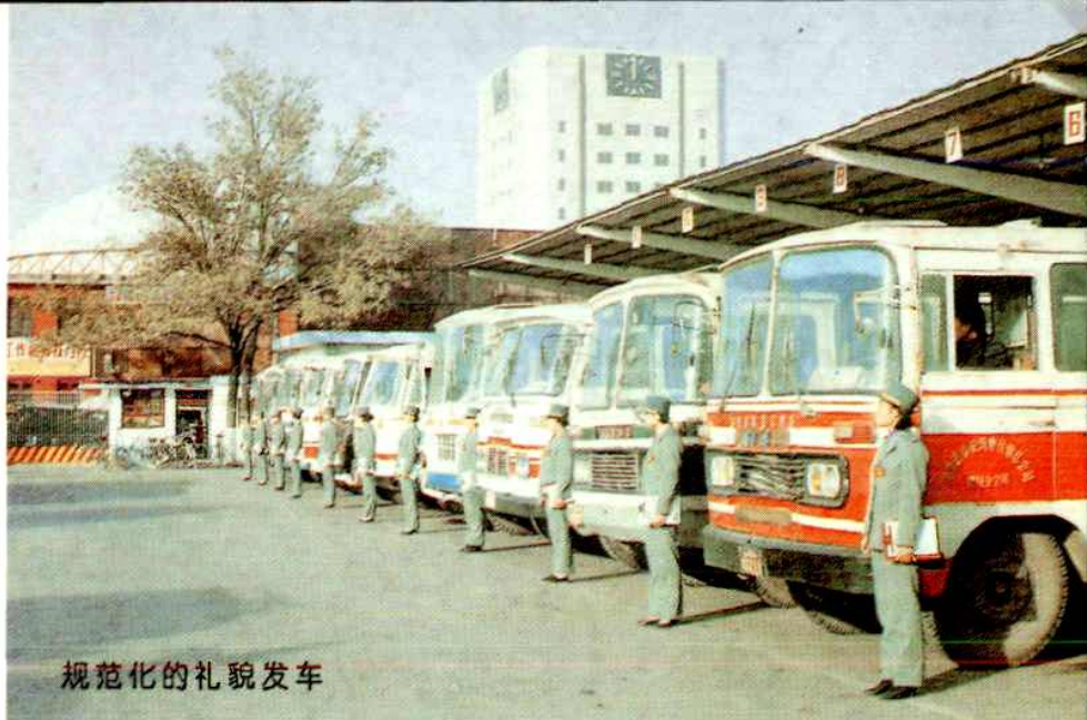
规范化的礼貌发车