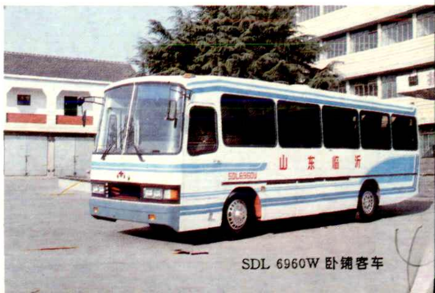
SDL 6960W 卧铺客车