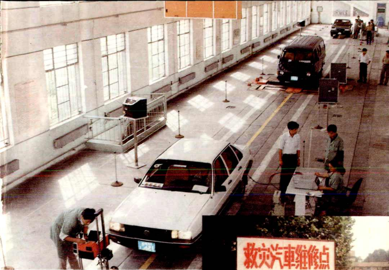
汽车安全性能检测线