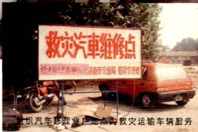
组织汽车修理业户定点为救灾运输车辆服务