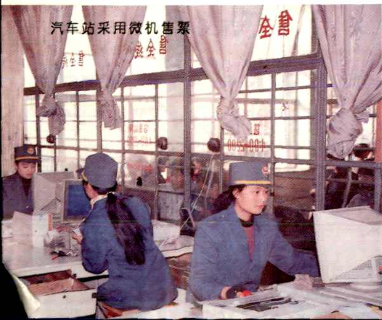
汽车站采用微机售票