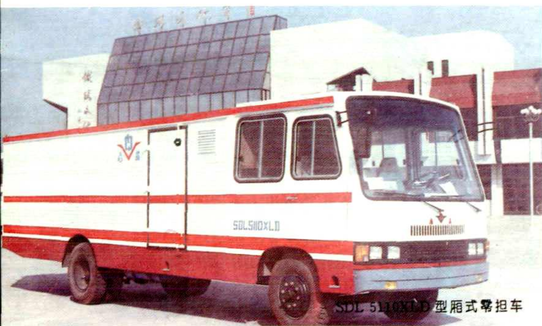
SDL 5110XLD 型厢式零担车