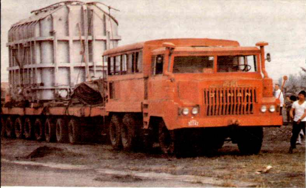
即将启运的大型工业设备