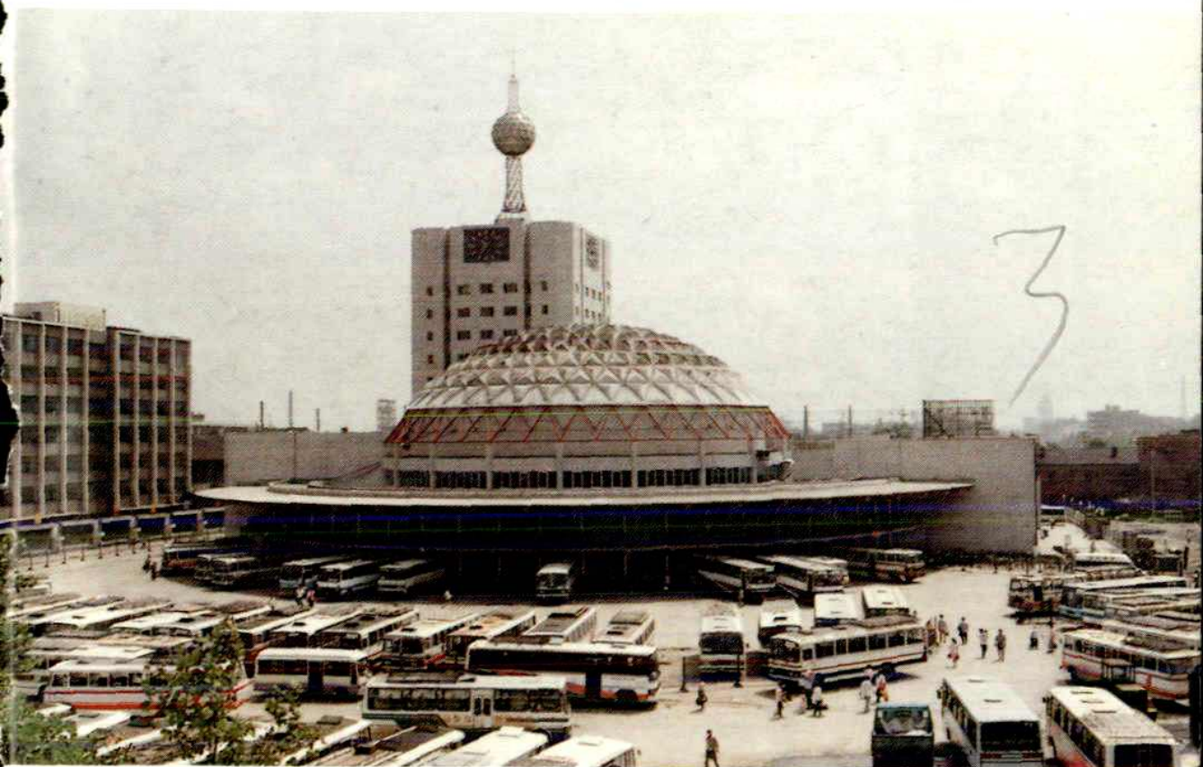
济南长途汽车总站发车区