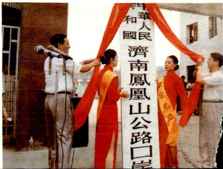
济南联运公司凤凰山国际口岸开通