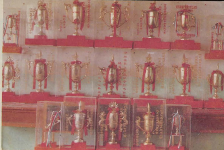
中获得的 部分锦旗 在全国、省比赛