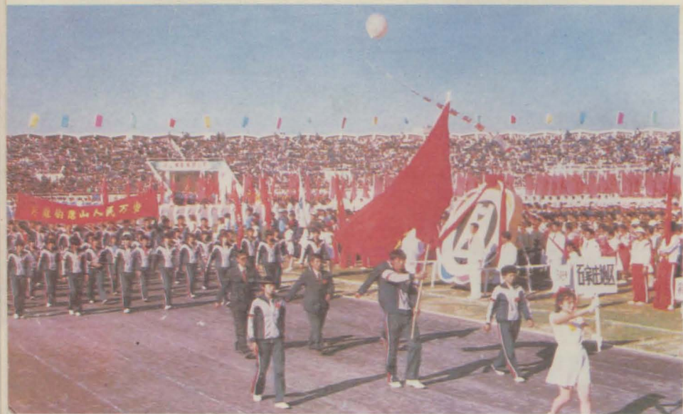
石地代表队在省七运会上