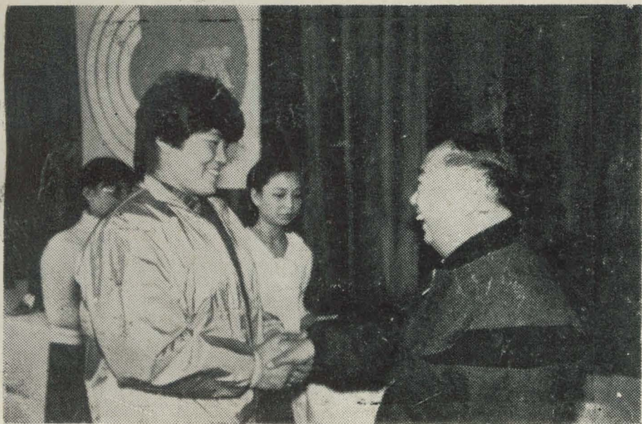
1、国家体委主任李梦华接见石家庄地区田径运动员李梅素