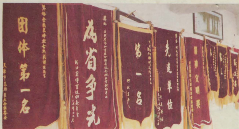
石家庄地区体委机关办事处