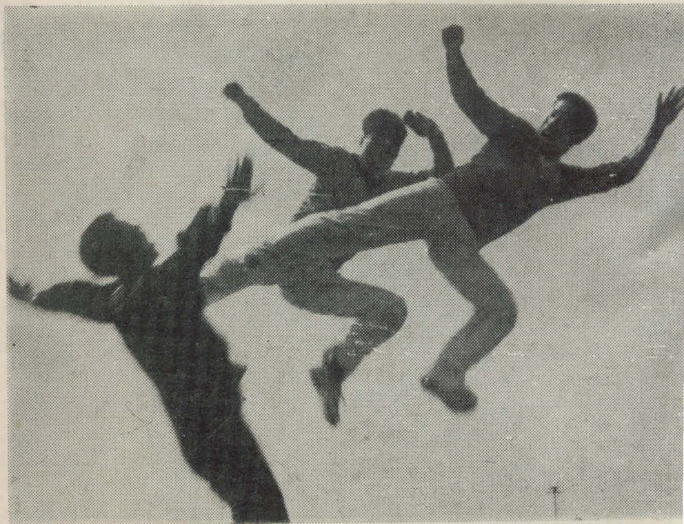
4、无极县武术业余体校学生在训练