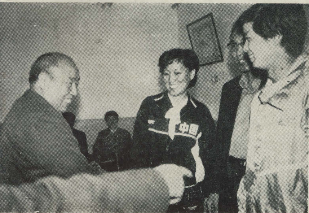
2、河北省省长解峰接见石家庄地区射击运动员郭凤娟