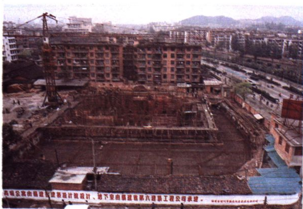
福州华盛大厦结合民用建筑修建的防空地下室工程,施工现场。