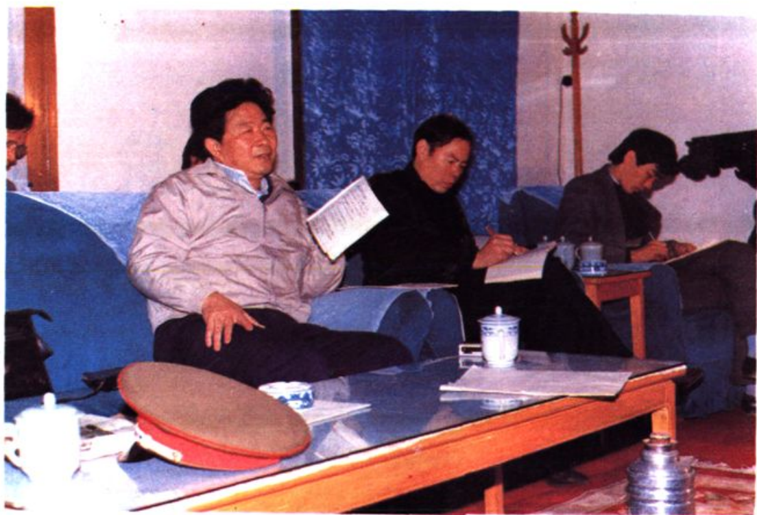
副省长、省人防委主任苏昌培在省人防委第三次全体会议上讲话。