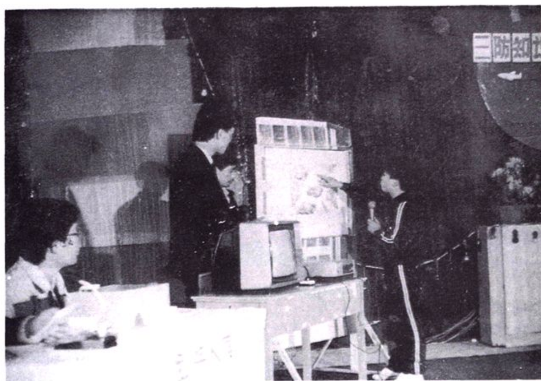
福州市人防办在有关部门配合下举办的“三防”知识竞赛。