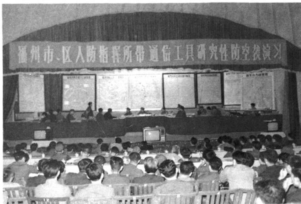
1984年福州军区在福州市举办人防指挥所带通信工具研究性防空演习,图为演习中心。