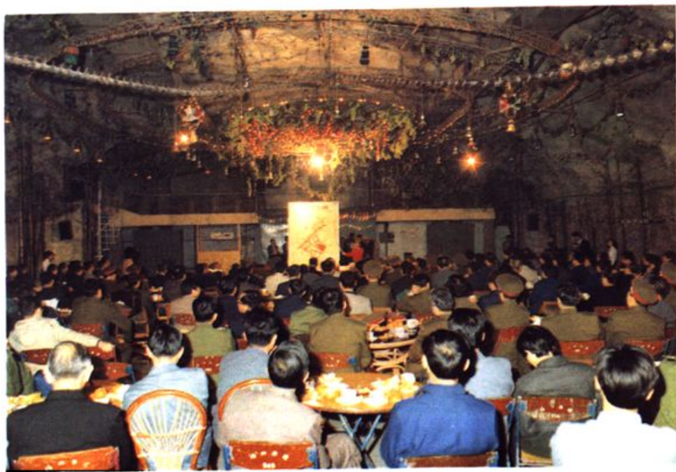
会议代表参观厦门鸿山地下游乐场。