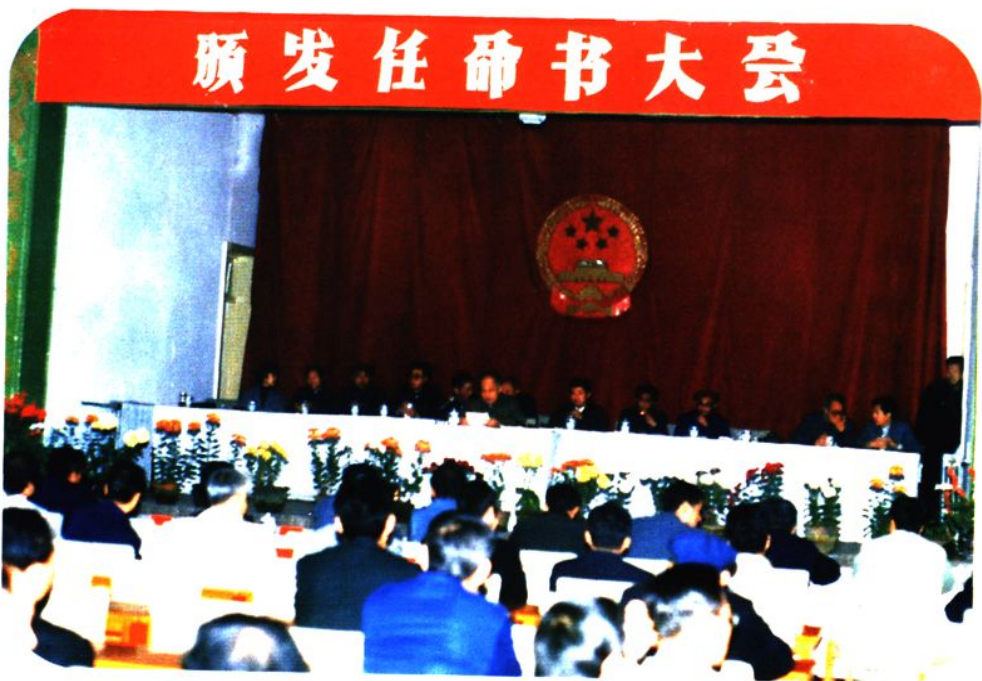
1988年11月市人大常委会召开颁发任命书大会