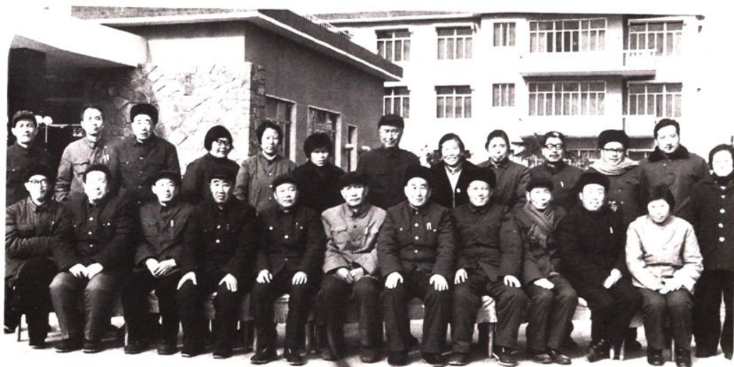
市八届人大常委会成 员及工作人员合影