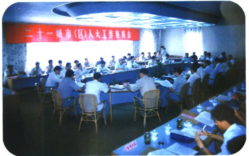
1993年9月全国二十一 城市人大工作座谈会在沙 市召开