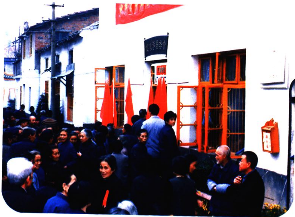
1987年11月中山路选区选民到投票站踊跃投票选举市人大代表