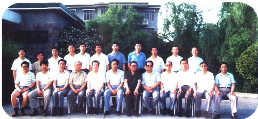
1992年6月全国人大 常委会委员许嘉璐视察沙 市《义务教育法》执行情况 时，与市领导及工作人员 合影