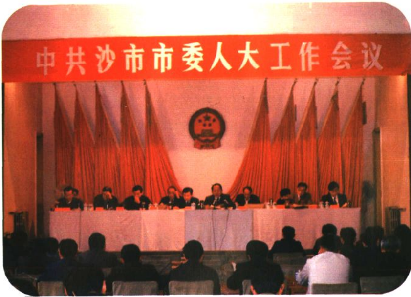
1992年10月中共沙市市委 召开人大工作会议