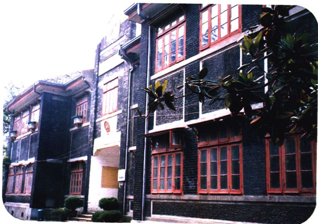
市人大常委会办公楼