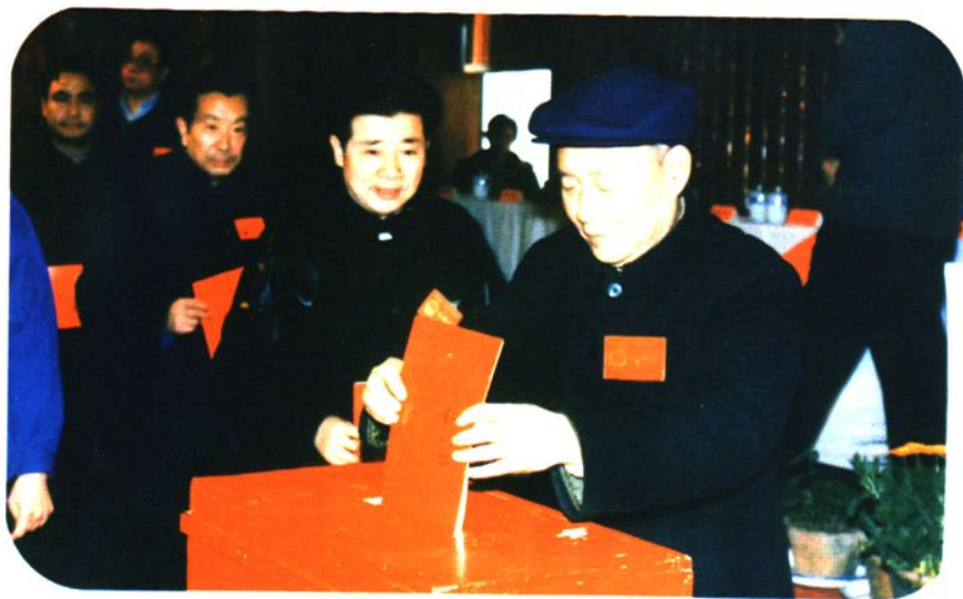
1991年2月市十一届人大 第一次会议投票选举市人大常委会 常委会组成人员