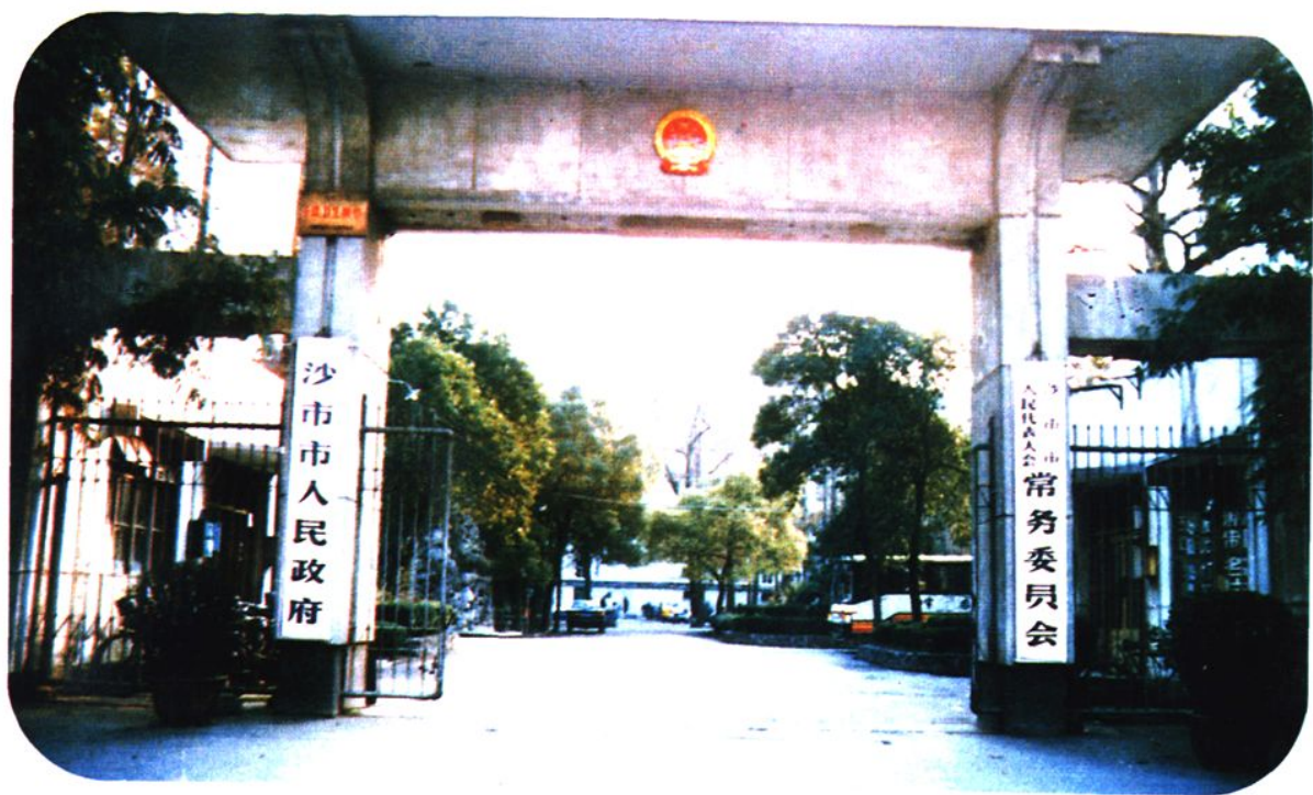
沙市市人大常委会机关大门