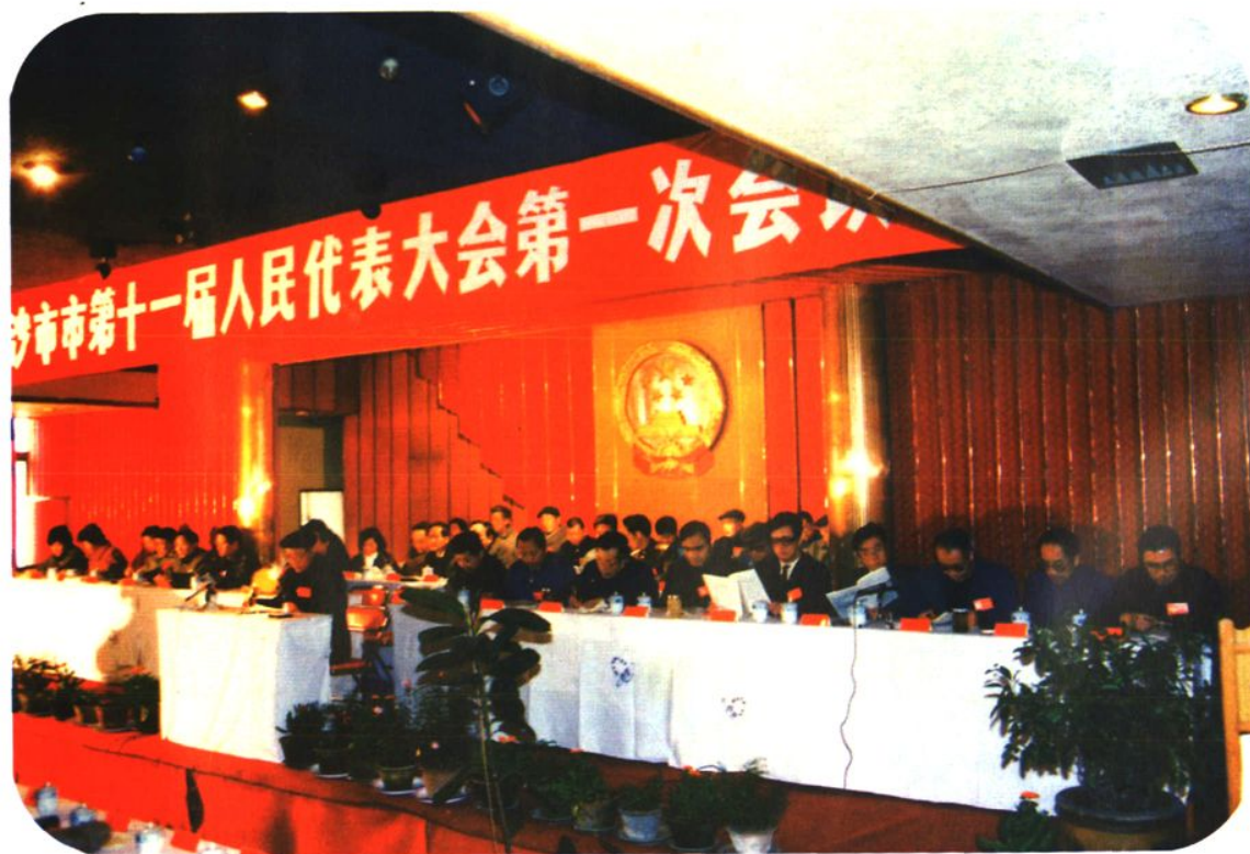
1991年2月市十一届人大一次会议在章华宾馆举行