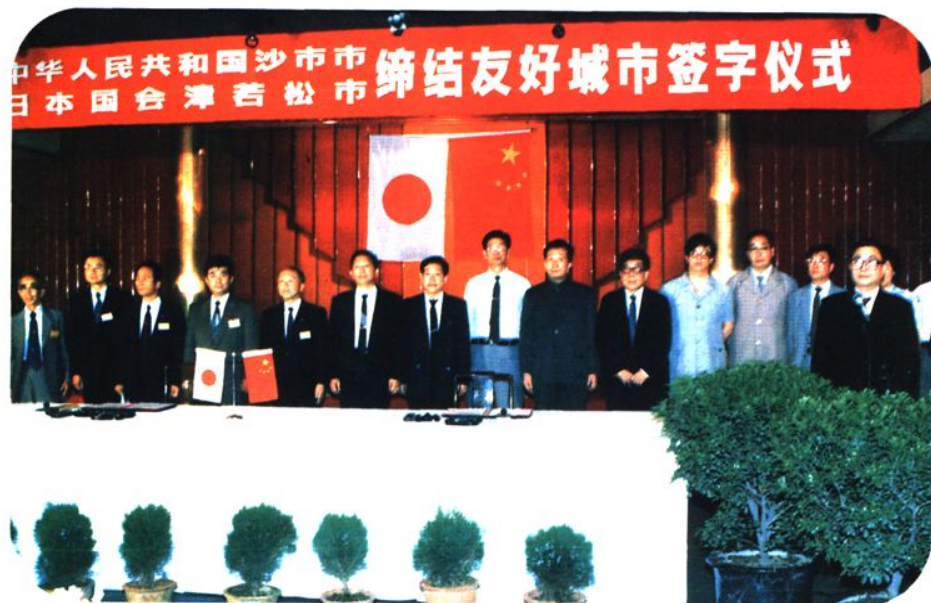
1991年6月15日沙市与日本会 津若松市缔结友好城市签字仪式在 章华宾馆举行