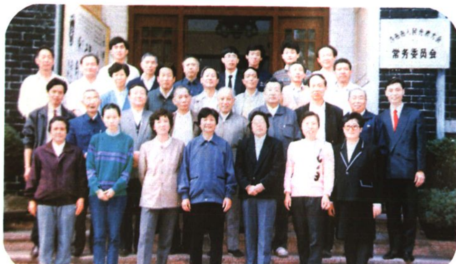
市十一届人大常委会主任、副主任、部分委员及工作人员合影