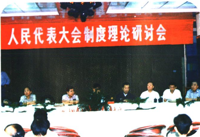
1993年9月市人大常委 会召开人民代表大会制度理论 研讨会