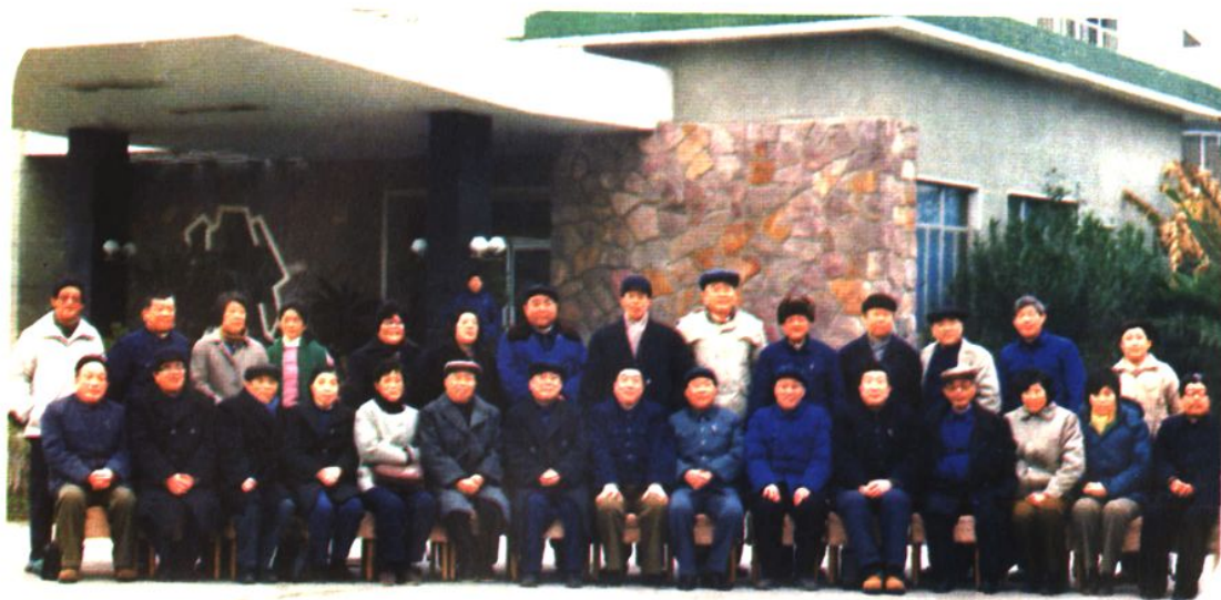
成员合影 市十届人大常委会