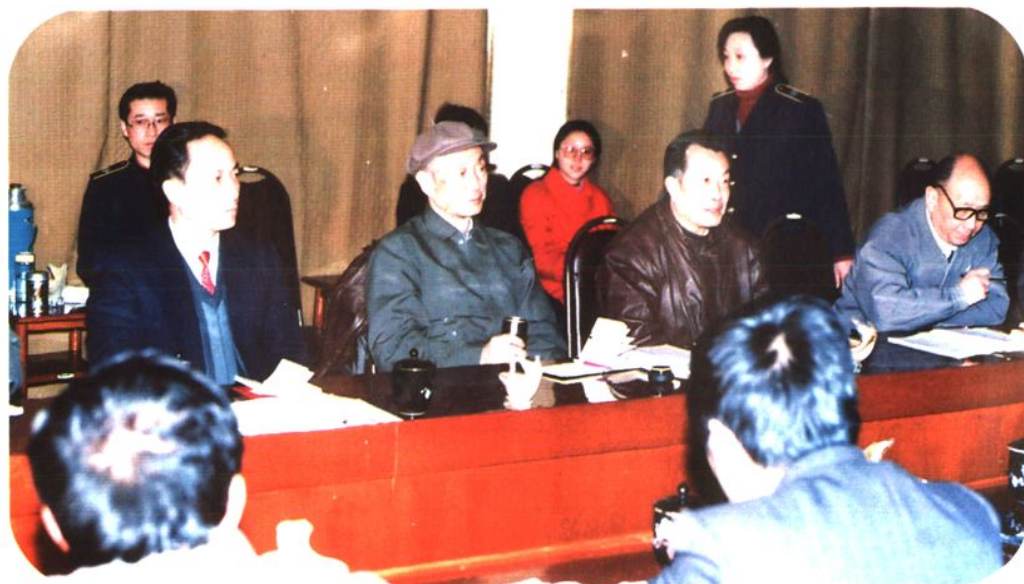
1992年6月湖北省人大常 委会副主任黄正夏视察沙市