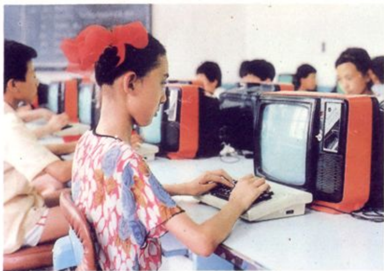
长安区 的小学生正 在进行微机 比赛