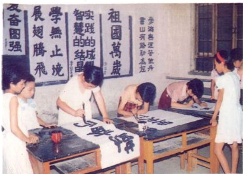
淡南路 小学书法组 正在活动