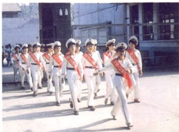
河北师大附属小学警察中队上街执警