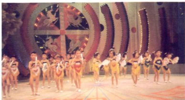
省直第三幼儿园参加省电视台春节文艺晚会