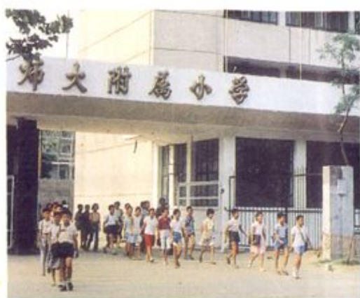
河北师大附属小学