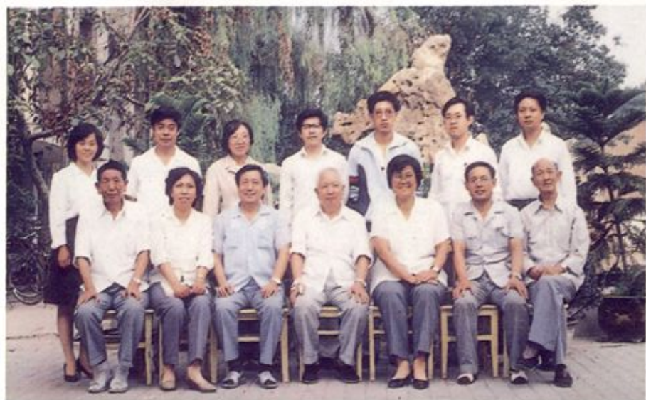
参加评审的 政协、区人大、省 市教育志办公室、 市地方志办公室同 本局领导及部分编 写人员合影。