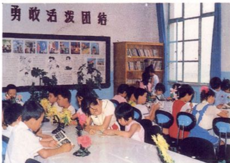
炼油厂 子弟小学阅 览室