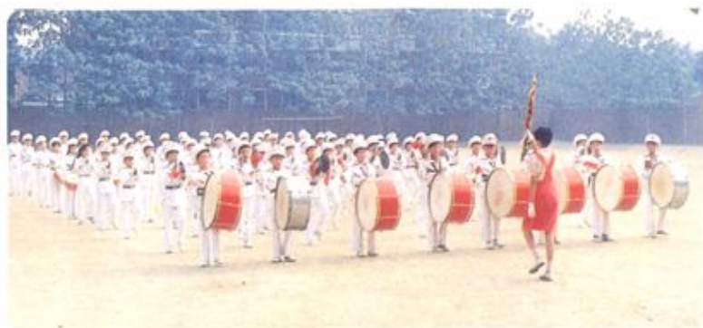
青园街小学鼓号队