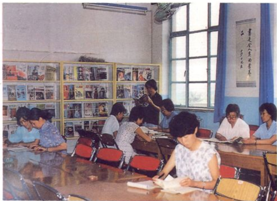
炼油厂子弟小学的教师阅览室