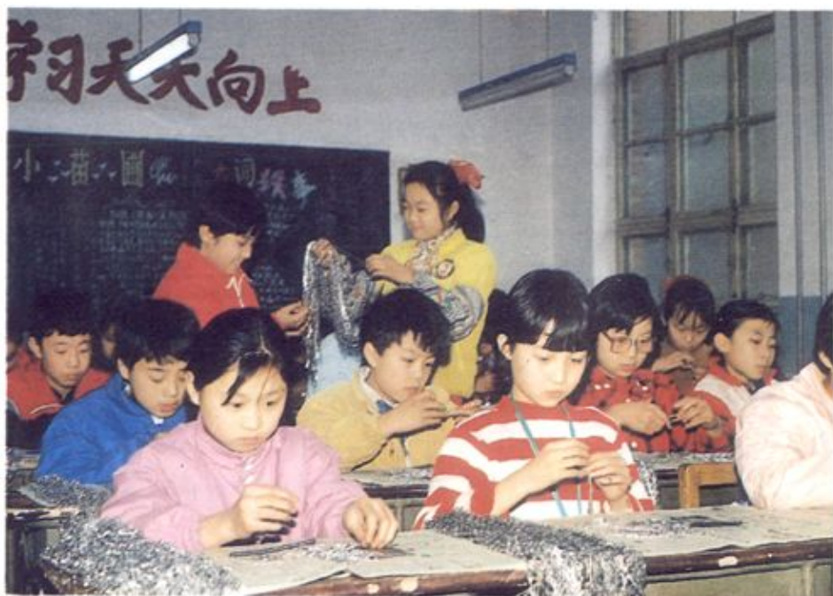
范西路 小学的学生 正在进行串 灯链劳动