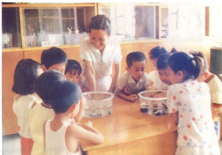
槐北路小学学生在自然实验室上课