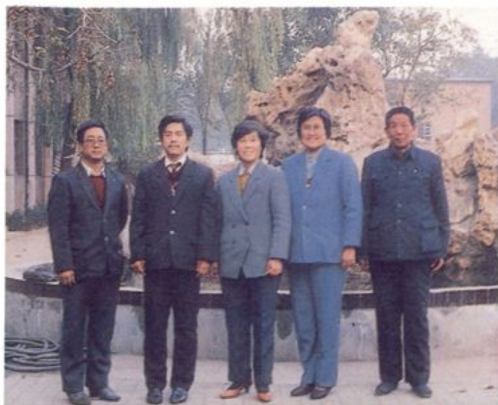
编审领导 小组成员合影