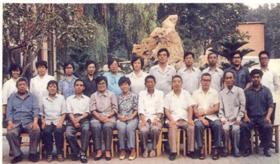
编审委 员会及编辑 人员合影