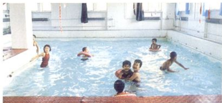
炼油厂幼儿园室内游泳池