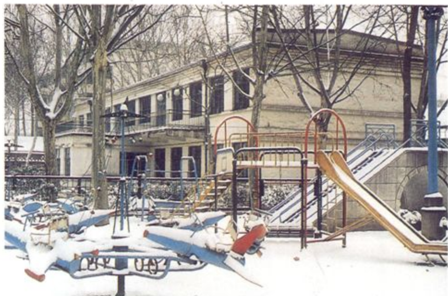
华北制药厂幼儿园