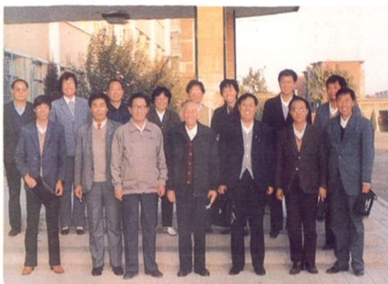
国家教育工作五项督导团视导本区教育工作时留影