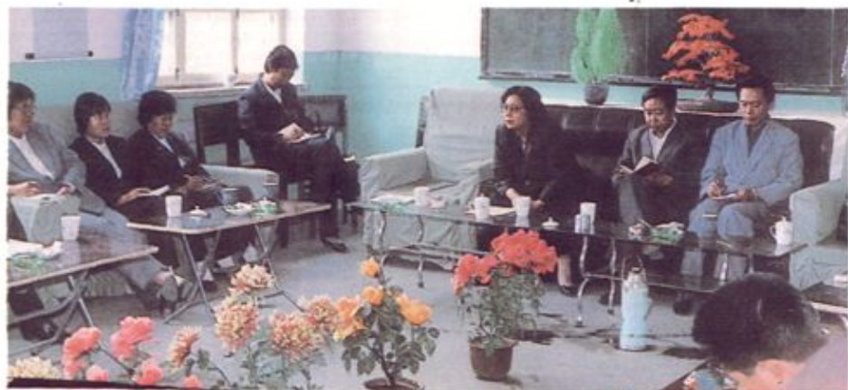
石家庄市委宣传部和市教委在范西路小学召开小学德育工作经验座谈会