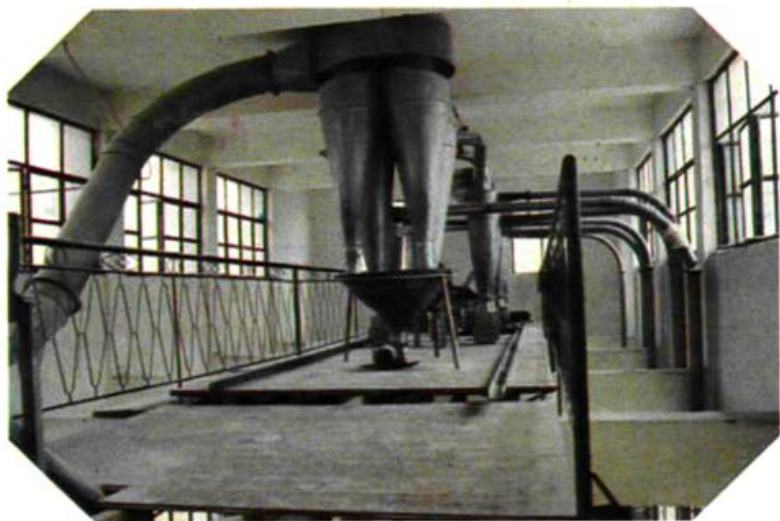
加工厂气力输送设备