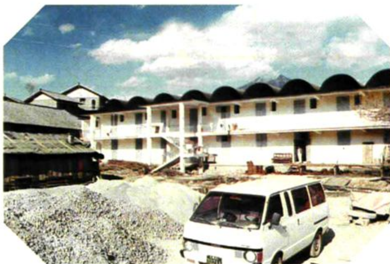
正在改建中的金顶粮所