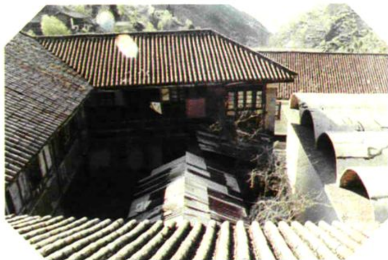
县粮食局旧址(老县城拉井)