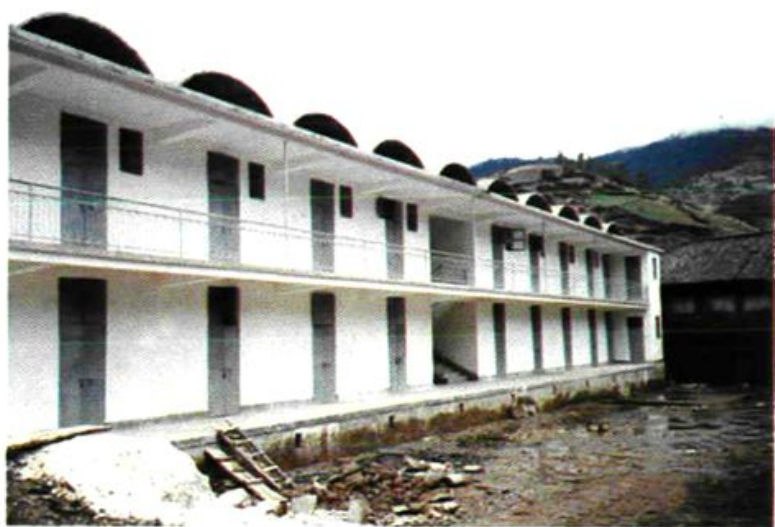
更新竣工的河西粮所一角