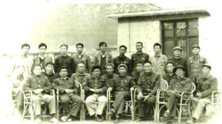
第一次参加《粮油部》初官的联合县干部(左一为书记)