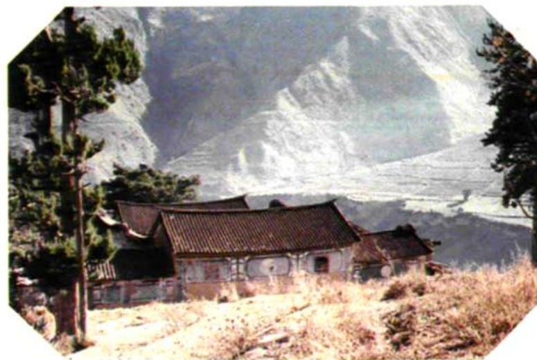
兔峨粮所旧址(原罗土司衙署)