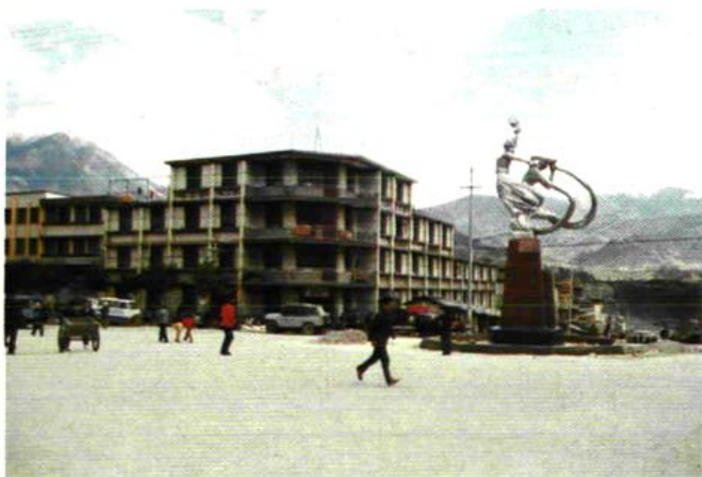
临街的县粮食局外景