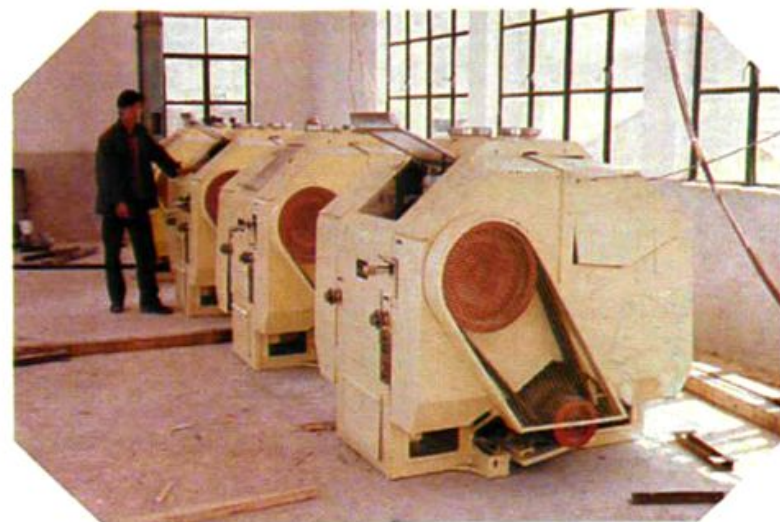
加工厂MQ 3 气压磨粉机