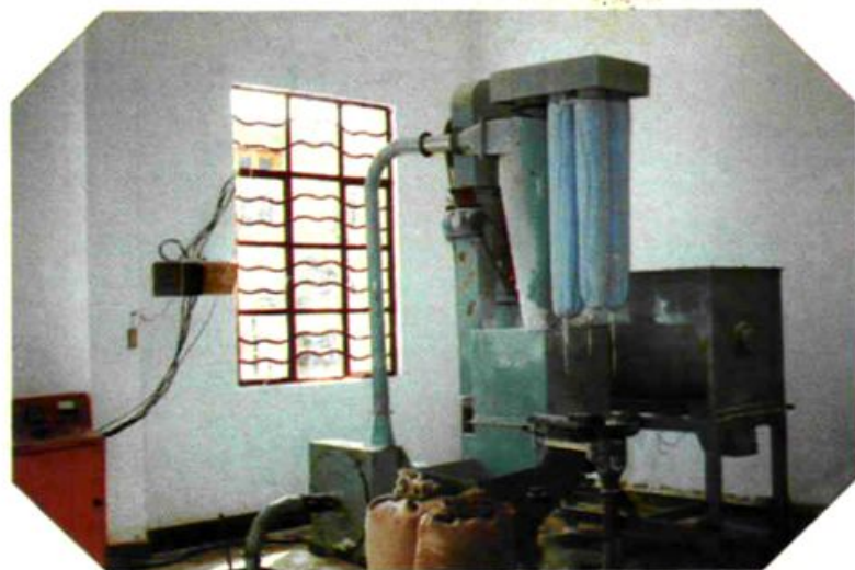
加工厂饲料加工设备