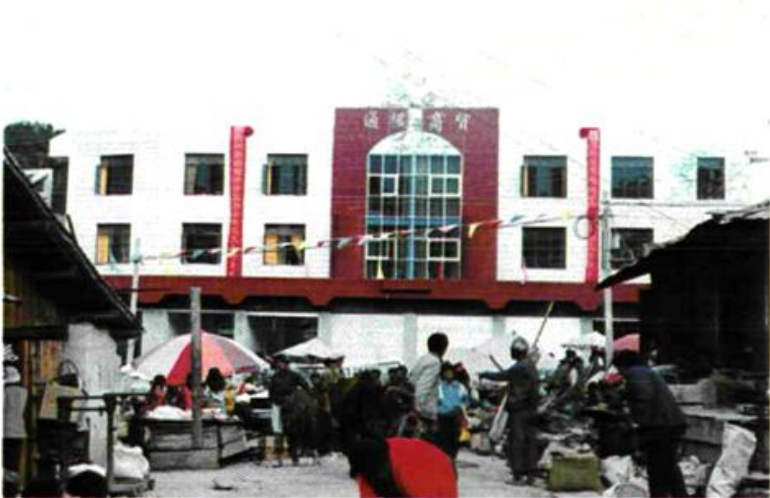
通稷商贸大楼 通甸粮所建在街面的