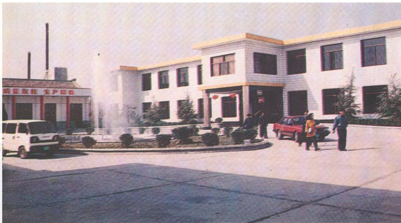
西安永华石化机械厂办公楼