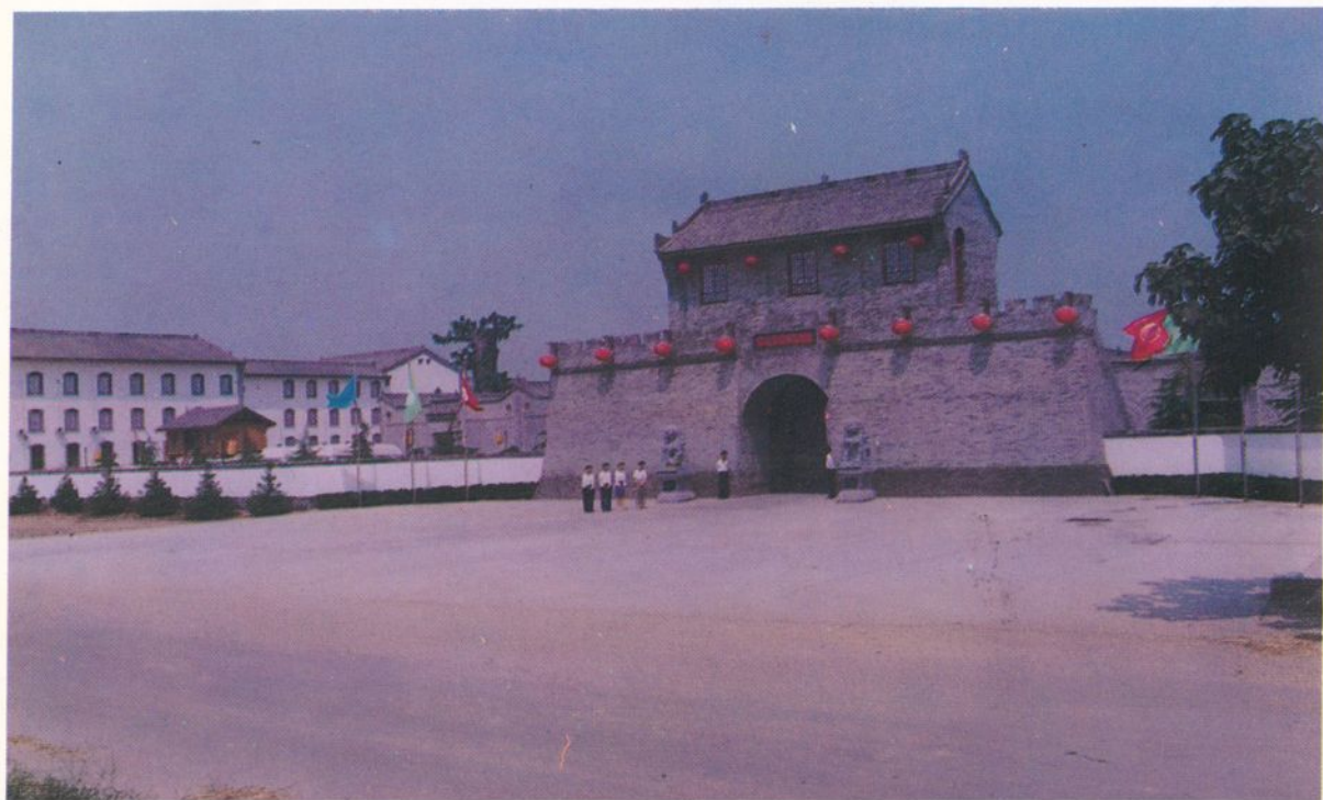
新桃花源休闲山庄外景