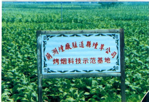
烤烟科技示范基地