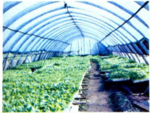
烤烟大棚漂浮育苗