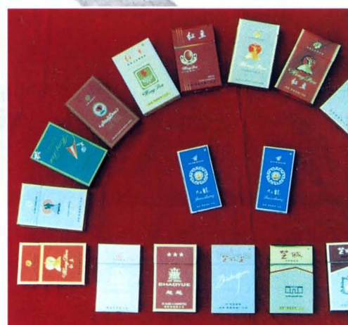
零陵卷烟厂生产的部分卷烟产品