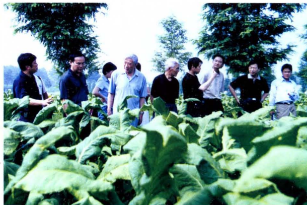
中国工程院院士郭予元(左三)在中国烟草中南农业试验站永州基地考察