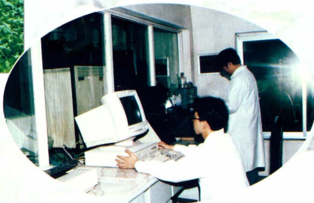
零陵卷烟厂化学检测室