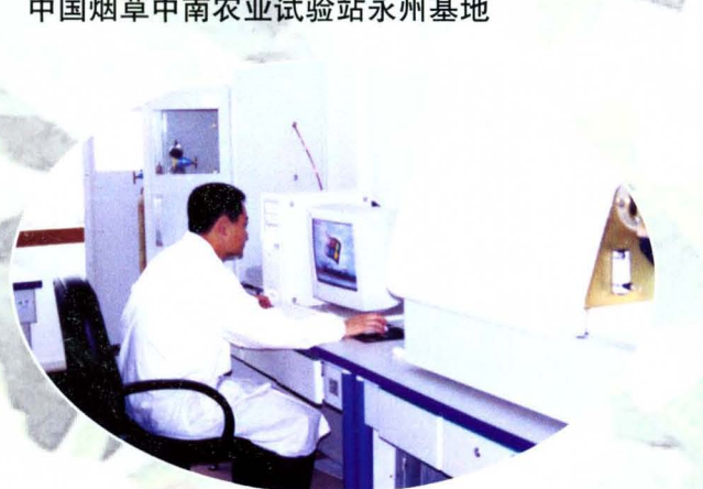
永州市烟草科学研究所检测中心