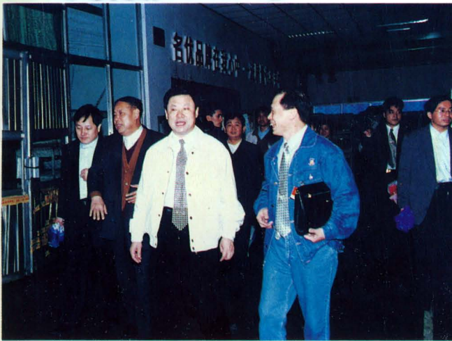
1998年4月，省委副书记储波（右二）到零陵卷烟厂视察工作