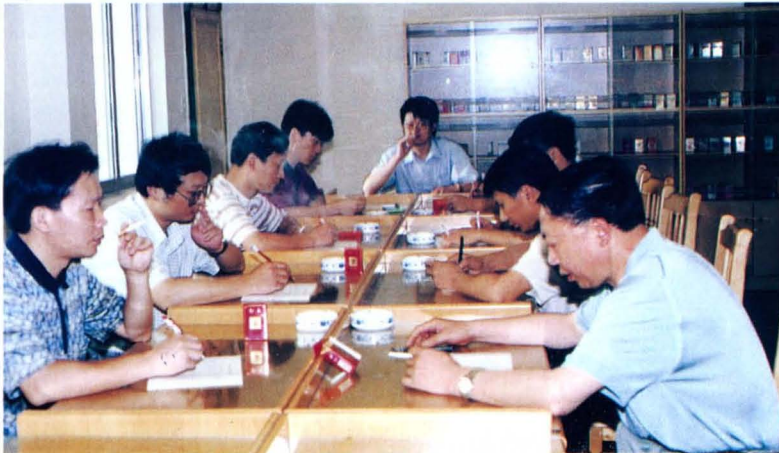
零陵卷烟厂新产品评吸现场