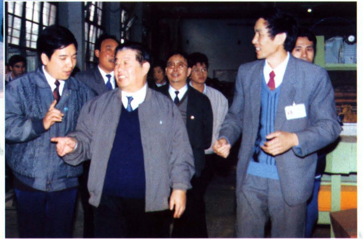
1992年11月，中共湖南省委书记熊清泉（左二）视察零陵烟叶复烤厂