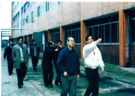
2000年2月，国家烟草专卖局局长倪益谨（前左）在零陵卷烟厂检查工作