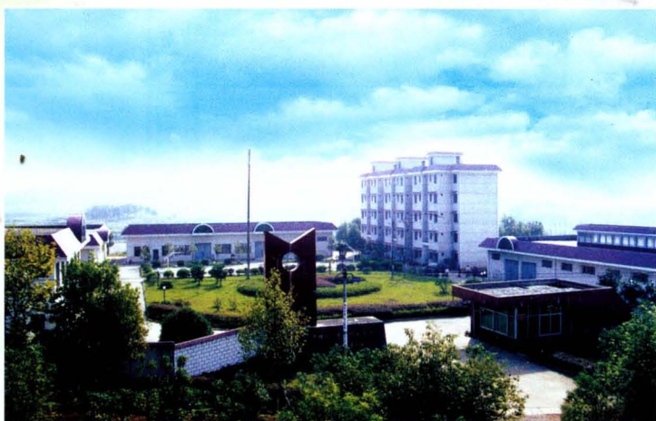
中国烟草中南农业试验站永州基地