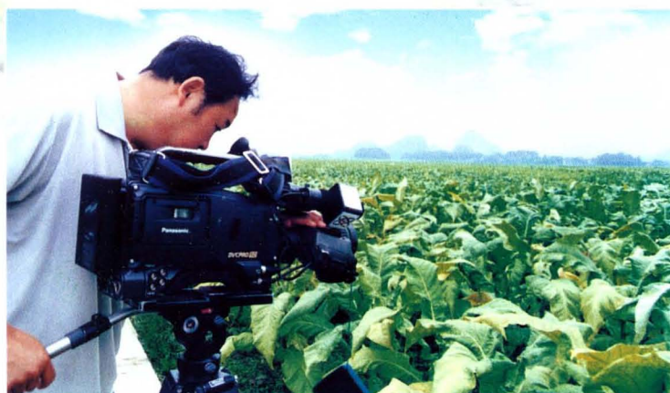
中央电视台记者在永州采访烟叶生产