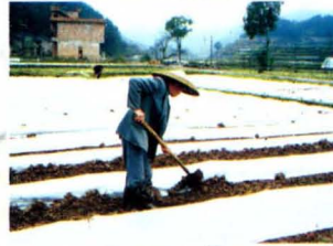
烤烟地膜覆盖压膜