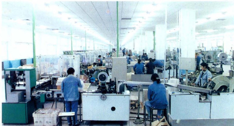
零陵卷烟厂卷烟包装车间