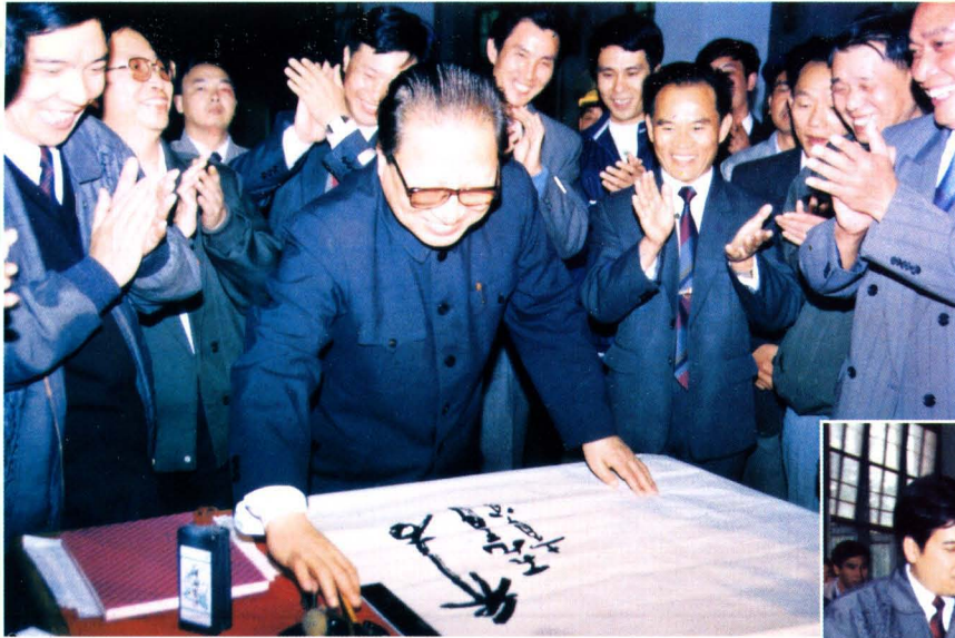
1992年11月，中共中央政治局常委、中央书记处书记乔石视察永州烟草工作时签名留念