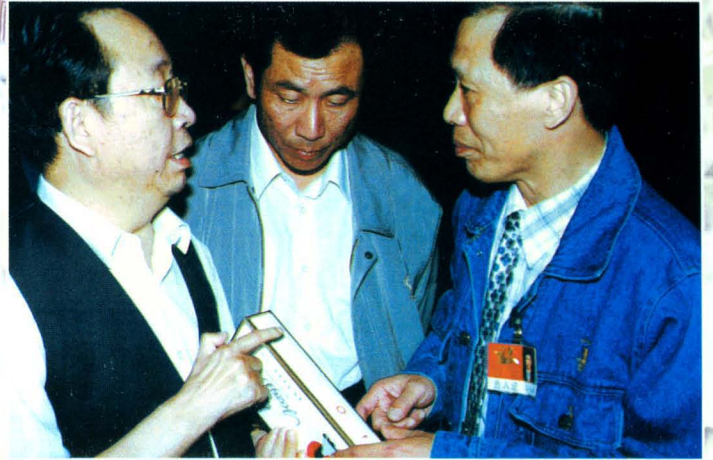
1999年，中共湖南省委书记杨正午在零陵卷烟厂视察工作