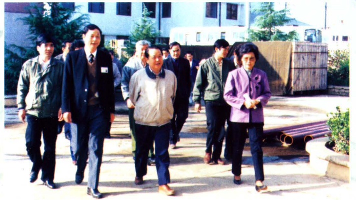
1994年6月，湖南省省长陈邦柱（左三）视察永州烟草工作