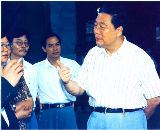
1994年1月，中共湖南省委书记王茂林视察永州烟草工作