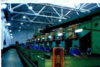
复烤厂打叶车间精选生产线