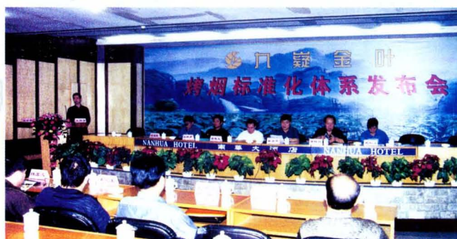
“九疑金叶”烤烟标准化体系发布会