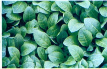
烤烟漂浮育苗烟苗