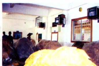
封闭式电视监控收购烟叶