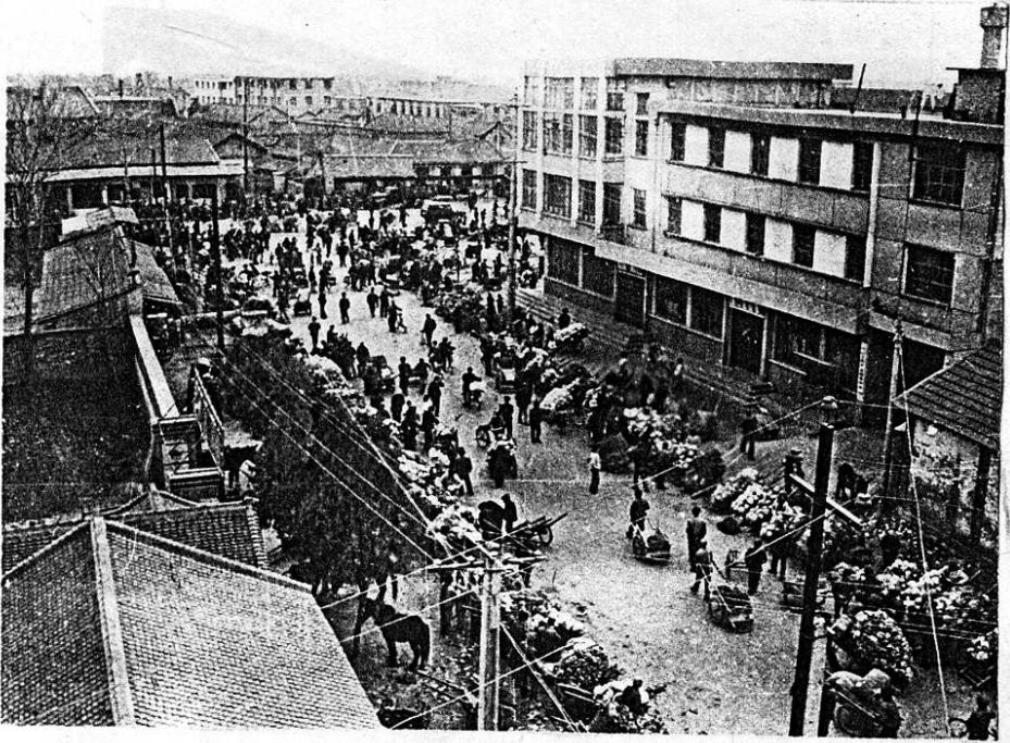
城关蔬菜市场一角