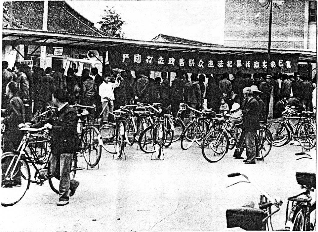
一九八五年八月二十八日在西門口舉辦的“严勵打击残害群众的違法犯罪活動實物展覽”