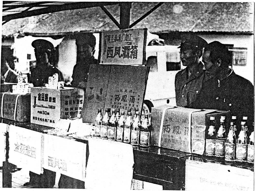
工商局工作人員在展覽會上