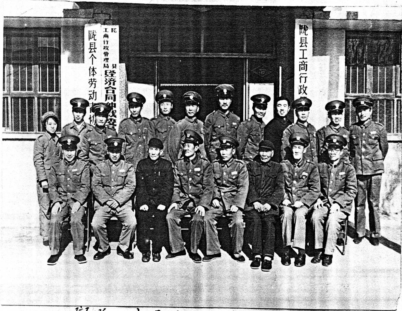
隴縣工商局局機關全體人員合影