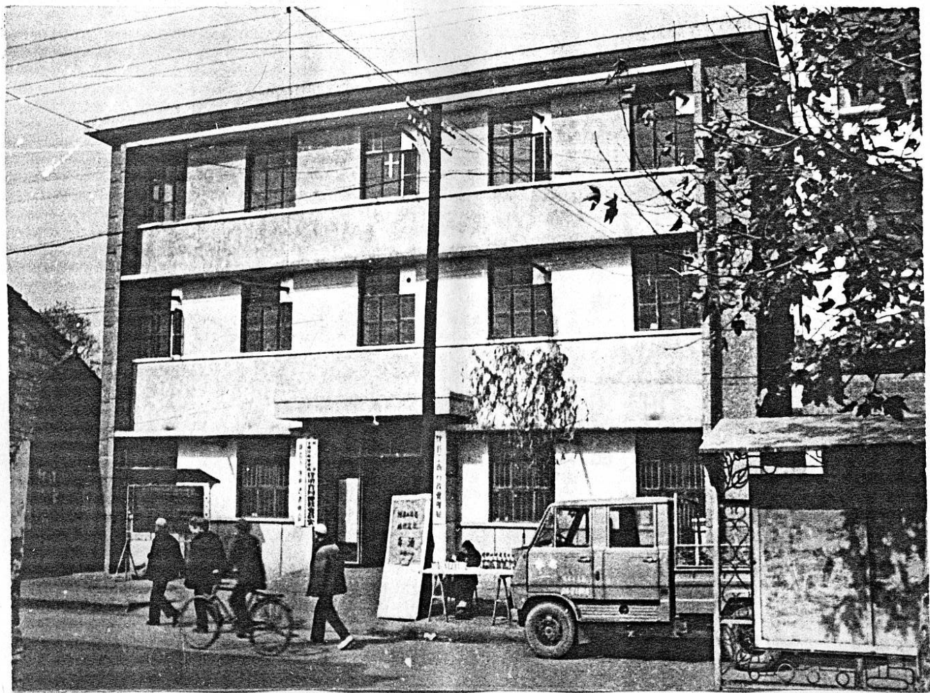
隴縣工商管理局辦公樓