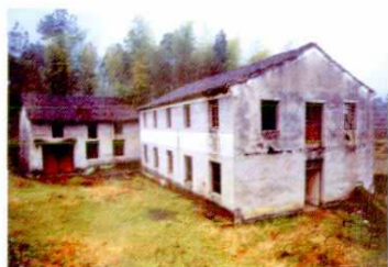
奇云山二级站厂房