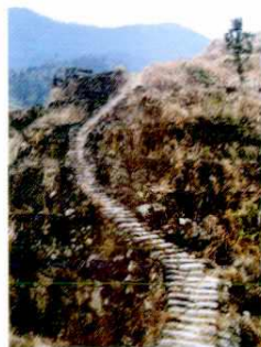
方山早期同外面联系的古道 (岭坳)