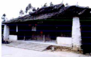
被泥石流冲毁以后修复的吴姓宗祠

七月初五，连续七日大雨，龙现村后山发生泥石流，全村被毁，仅吴姓宗祠数间及街路头一屋幸免，稻田大部被毁。