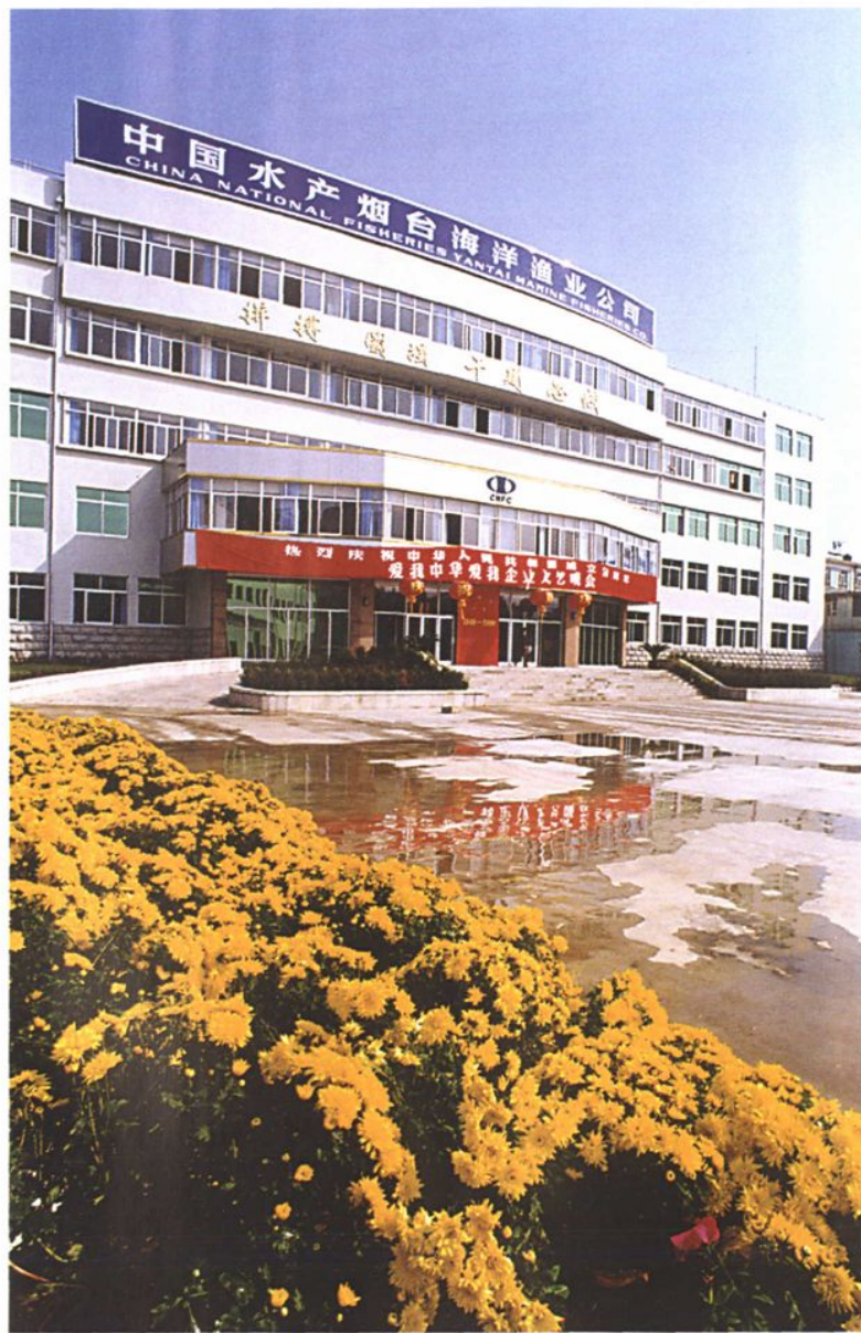
1999年公司办公楼旧楼改造工程竣工。图为新办公楼英姿。