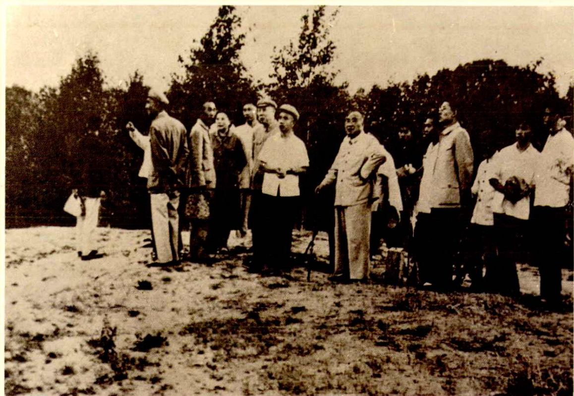
一九六五年七月党和国家领导人朱德、董必武在赤峰视察