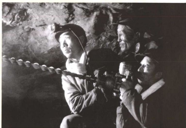
70年代初期，矿工采煤场景