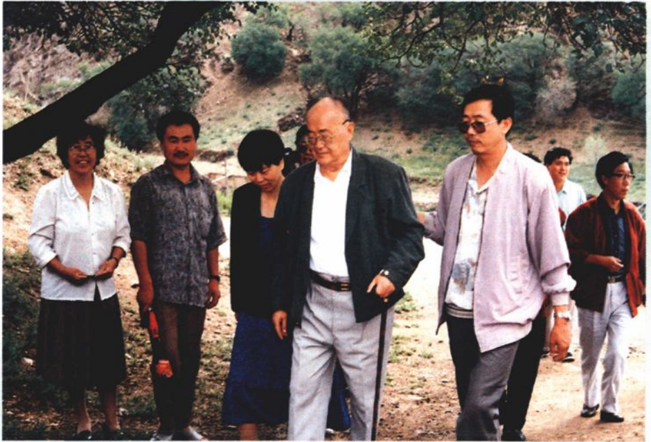
1994年8月，全国政协副主席胡绳在五当召调研旅游工作