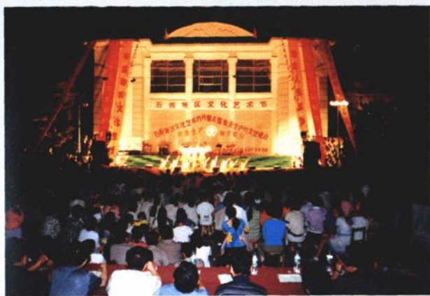
石拐地区文化艺术节