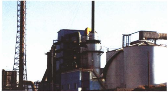
石拐区铜工业基地