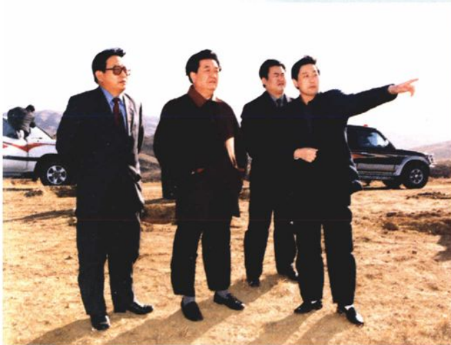
2002年4月，内蒙古自治区副主席傅守正在石拐区视察生态建设工作