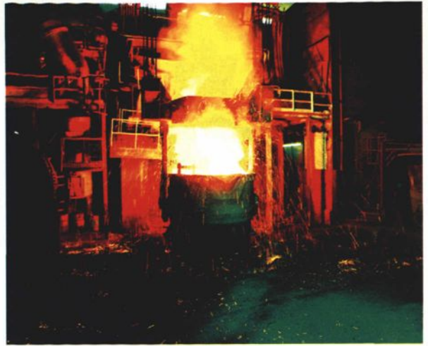
内蒙古包头石拐工业园区生产场景