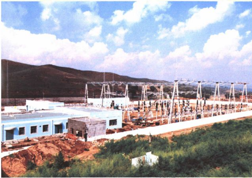
内蒙古包头石拐工业园区220千伏70万负荷输变电站