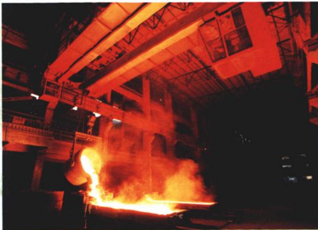
内蒙古包头石拐工业园区硅铁冶炼