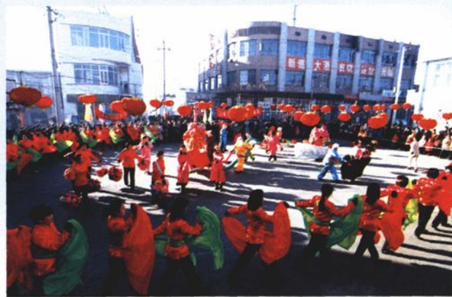
元宵节街头文艺活动