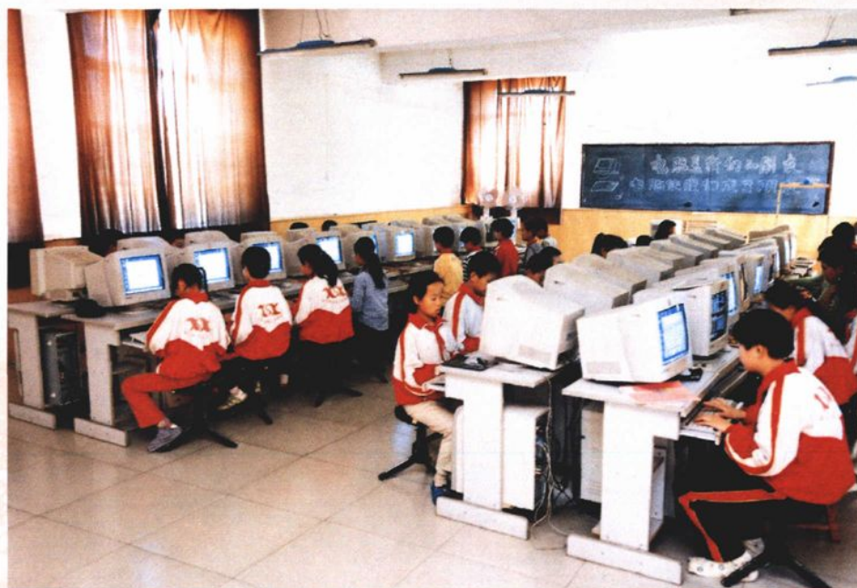
新石拐小学多媒体教学