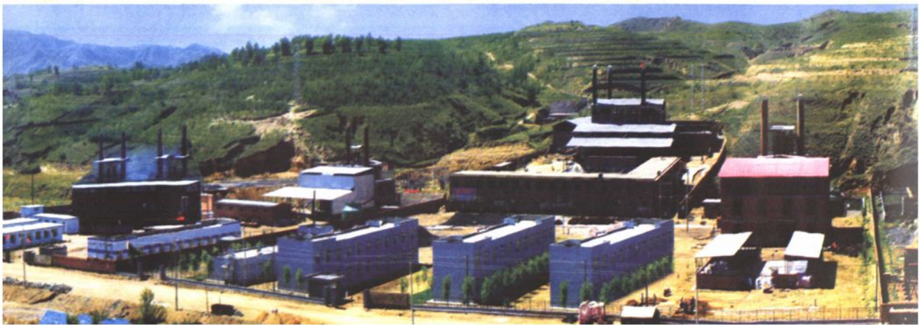
内蒙古包头石拐工业园区蓬勃发展