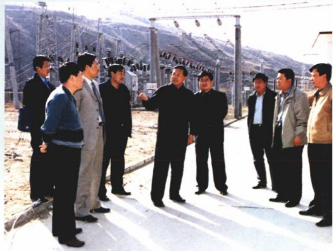
2002年10月，内蒙古自治区党委常委、自治区副主席岳福洪在内蒙古包头石拐工业园区调研工作