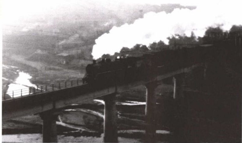
70年代初期，优质煤炭源源不断地从煤城石拐运往祖国各地，有力地支援了四化建设