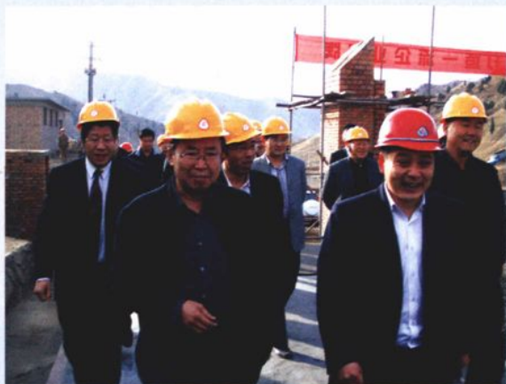
2007年4月8日，包头市人民政府市长呼尔查视察石拐区铁选矿企业