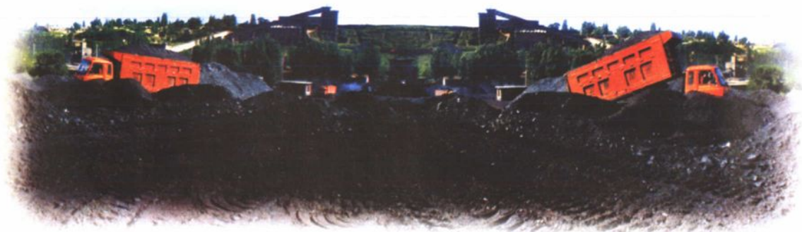
90年代，现代化运煤场场景