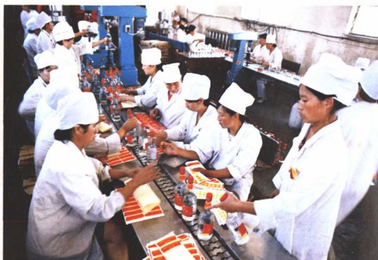
秦府酒业包装生产线