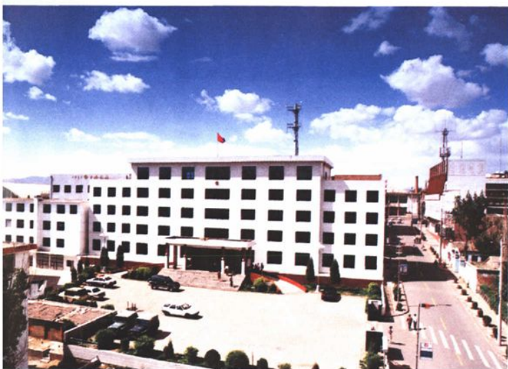
石拐区党政办公大楼