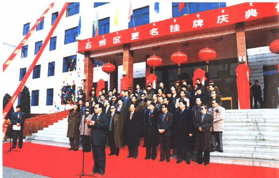
2000年2月18日，石拐矿区更名石拐区挂牌仪式