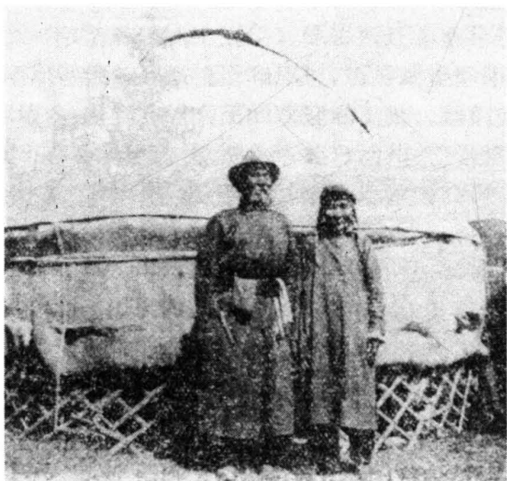
准噶尔蒙古包和牧民

有大片森林，覆盖着茂密的云杉、落叶松和桦树林。在准噶尔盆地沿河流两岸，还生长着天然胡杨林和杨、柳、榆等。密林中，生活着熊、豹、鹿、猓、獭、貂、麝鼠等珍贵的野生动物，并出产各种贵重药材。矿藏以阿尔泰山的金矿为最著名，因而又有金山之称。此外，煤、铁、铜、锡、石油、石棉、盐、硫磺等，藏量也很丰富。