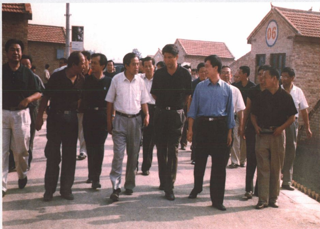
市人大主任樊纪亨(左四)来浮山视察小康建设工作