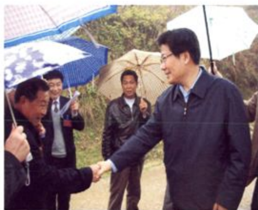
▲ 2006年3月, 省委书记张春贤(右一)到桂东调研扶贫工作。图为与沙田江湾村支书亲切交谈