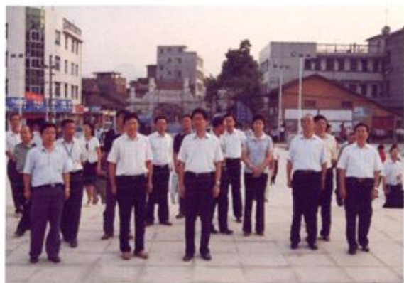
▲ 2008年8月，省委书记张春贤（前排左三）到桂东视察军规广场建设情况