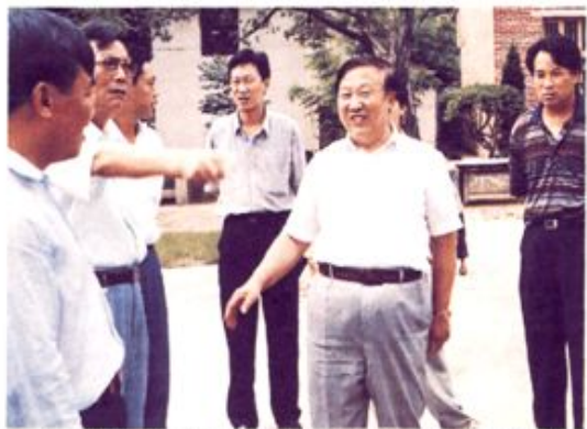
▲ 1997年8月，国家教委副主任周远清（右二）考察桂东教育工作