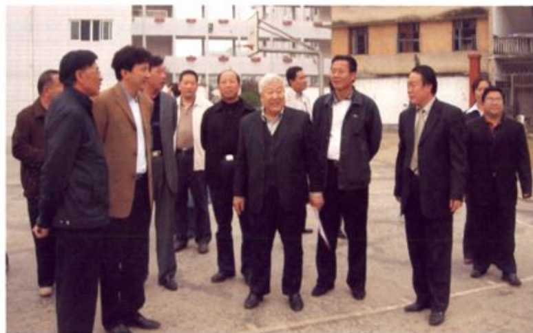
◀ 2007年10月, 教育部原副部长、国家高等教育学会会长周远清到桂东考察教育工作