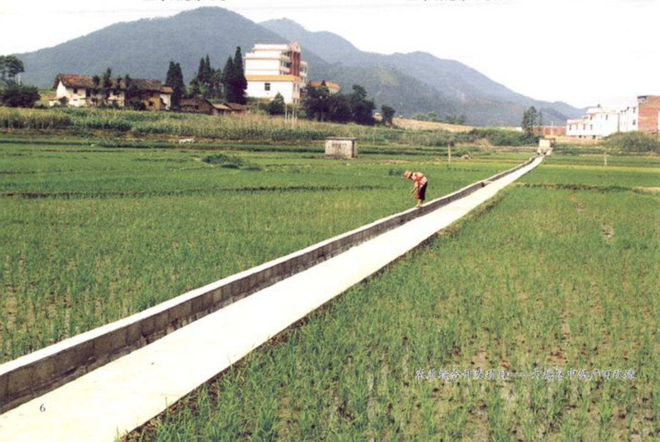
农业综合开发项目——大塘区中低产田改造