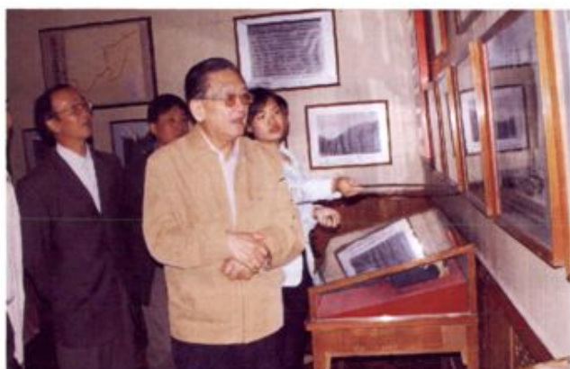
▲ 2006年, 中共中央党史研究室副主任石仲泉(右一)到桂东调研党史工作