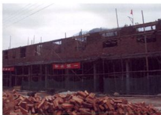
▲ 农村危房改造项目