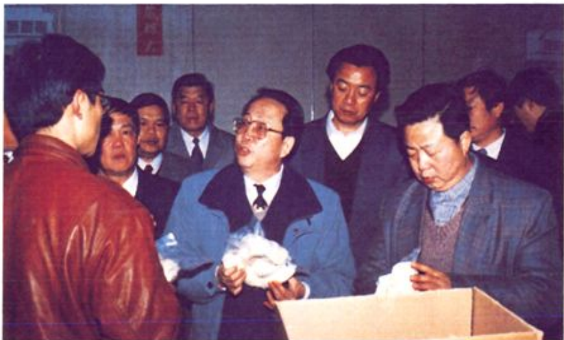
▶ 1997年1月，省委副书记、省长杨正午（中）到桂东罐头厂调研