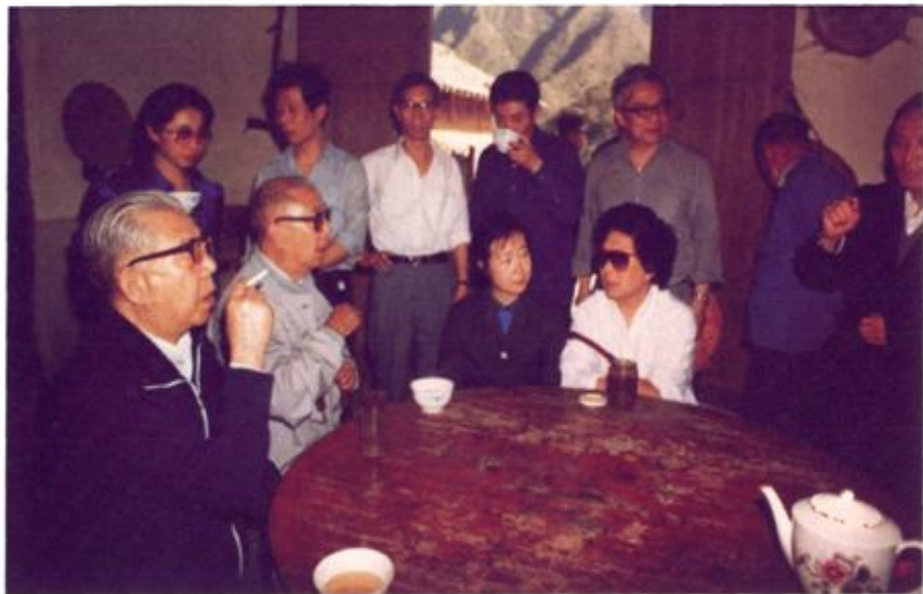
◀ 1988年，中共中央顾问委员会委员、中共中央书记处原书记邓力群（左一）回家乡探访时与村民座谈