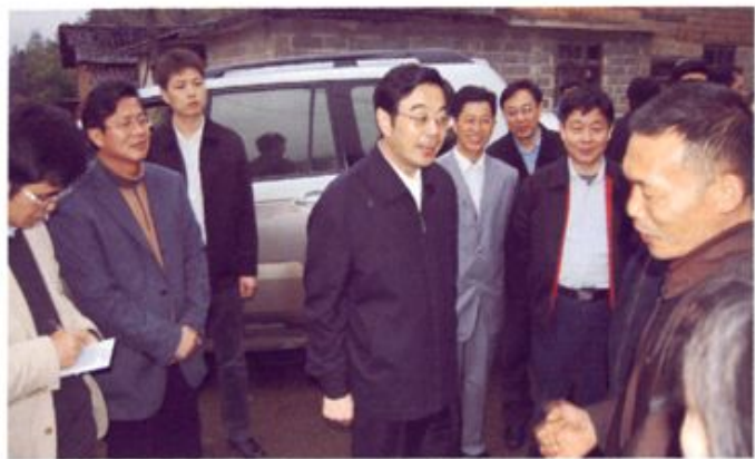
◀ 2008年4月，省委副书记、省长周强（中）到桂东调研新农村建设和农业生产情况