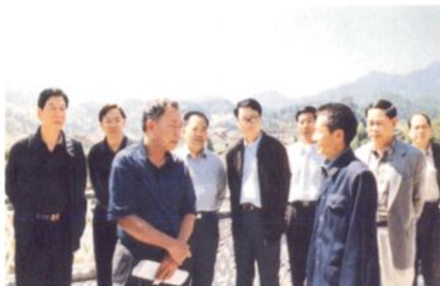
▲ 2002年, 国务院扶贫开发领导小组副组长、扶贫办主任吕飞杰(左二)到桂东调研扶贫开发工作