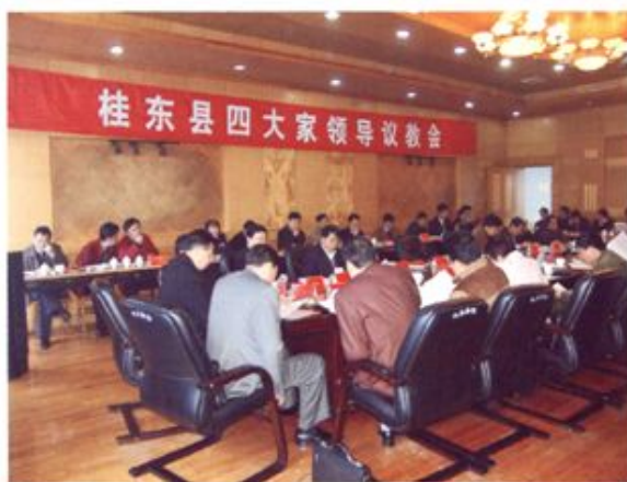
▲ 县委、县政府高度重视教育工作。图为县四大家领导议教会现场