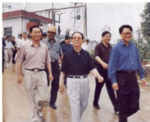
▲ 2002年7月, 省委书记杨正午(左二)到桂东考察建整扶贫工作