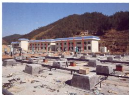
▲ 即将竣工的县城市污水处理厂