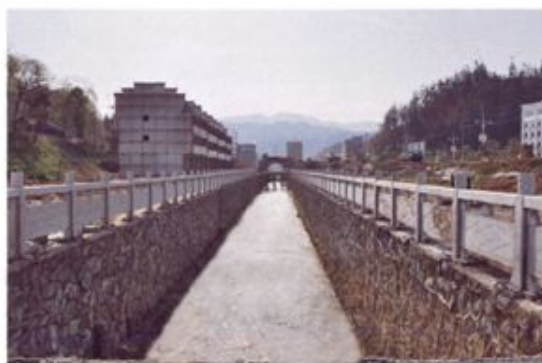
▲ 以工代赈工程——西城区下阳河河堤建设