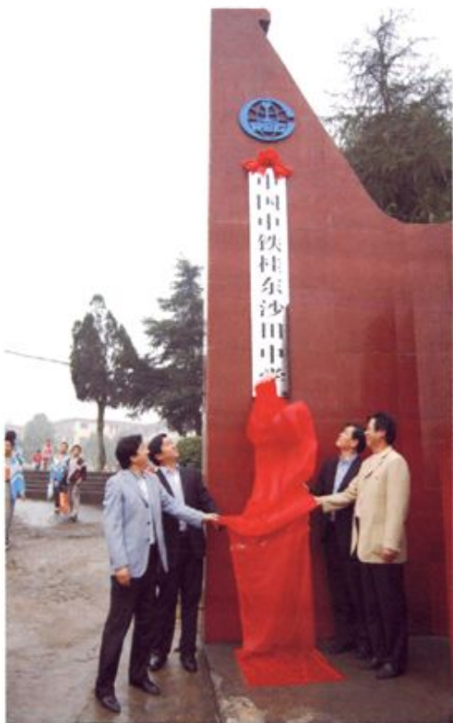
▲ 2002年起，中国铁路工程总公司对口扶贫桂东。图为中铁公司领导与县领导为援建的沙田中学揭幕