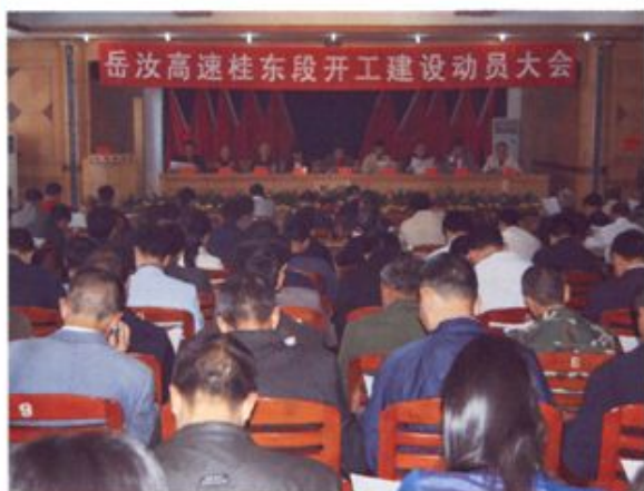
▲ 2009年底，岳汝高速公路桂东段开工兴建，结束桂东无高速公路的历史。图为动员大会现场