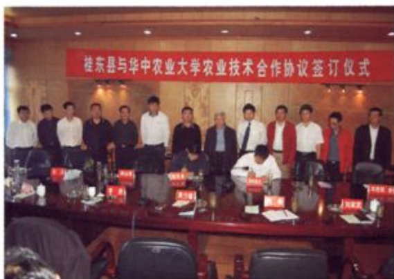
▲ 2008年4月，与华中农业大学签订农业技术合作协议