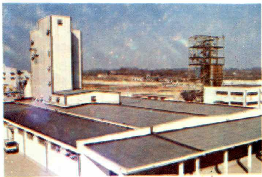
◁南京预混合饲料厂主车间外景