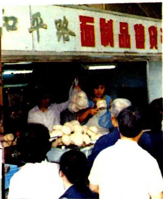
△玄武区和平路面食亭