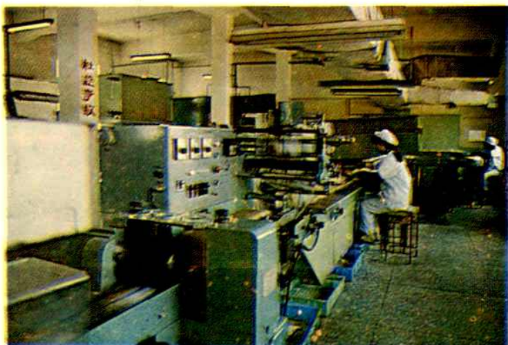
▷南京粮油食品厂 1984 年从日本引 进的快餐面生产线