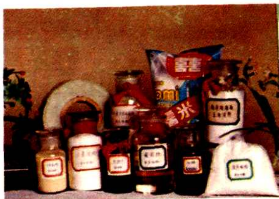
▽南京粮食系统部分优质产品