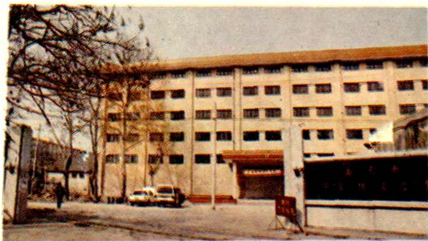
▷下关粮库三层楼式仓库