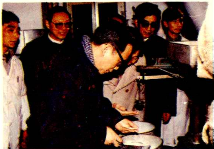
◁1991 年商业部 副部长白美清视察 昇州路粮站