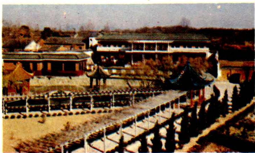
〈铁心桥粮库招待所——珍园