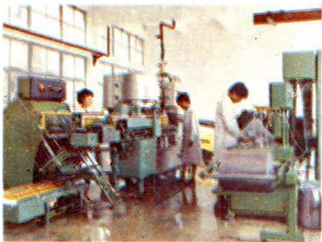
◁南京植物油厂精制油罐装生产线。