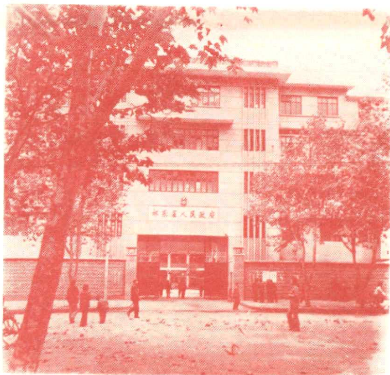
图为祁东县人民政府办公大楼