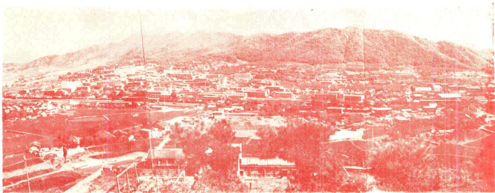
图为祁东县城关镇全景

祁东县城关镇原名洪桥镇，为全县政治、经济、文化、交通中心。解放前，为一农村市镇，街道狭窄，居民不过2,000人。1952年祁东建县后，县人民政府及110多个企事业单位相继设在这里，工商业迅速发展，交通运输日益发达，不断新建、扩建街道，兴修各种公共设施，现有房屋建筑面积约1.63平方公里，居民增至19,469人。共有街、路17条，主要街道均系东西方向，两旁为四、五层楼房，成为一崭新城市。