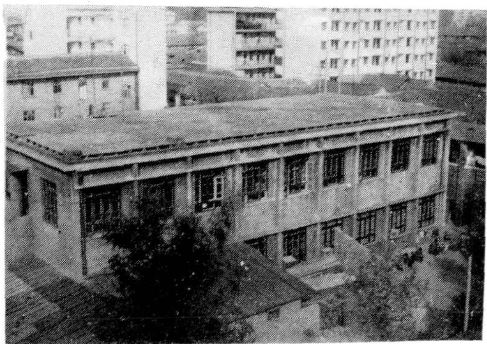
梓潼县邮电局综合楼