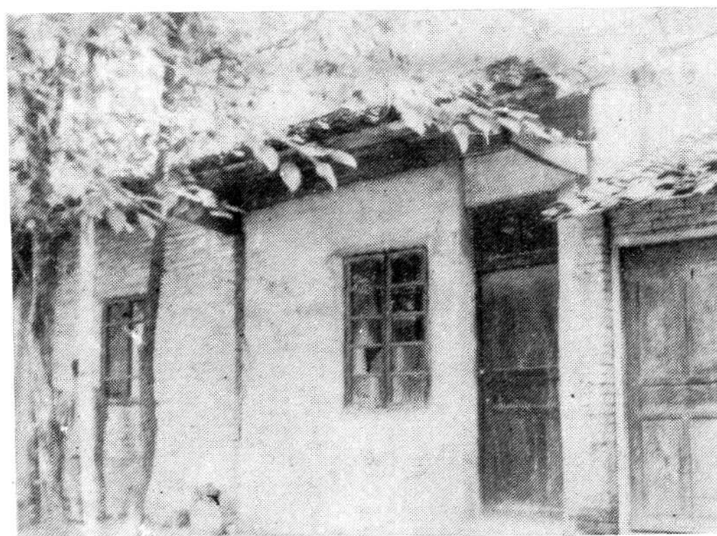
梓潼县 电管所 旧址