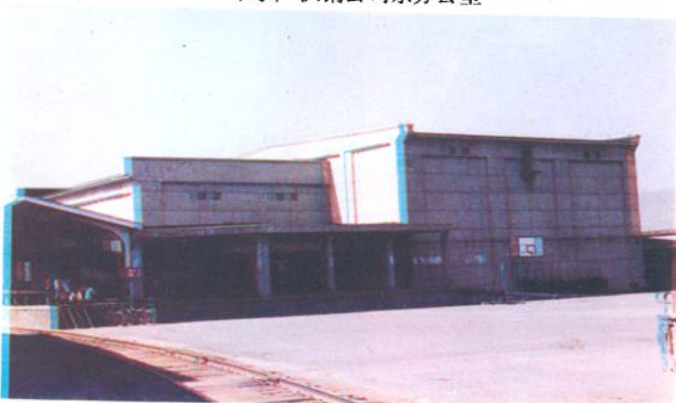
哈尔滨市水产供销公司一号冷藏库(500吨位) 道外区北马路小八站街四号