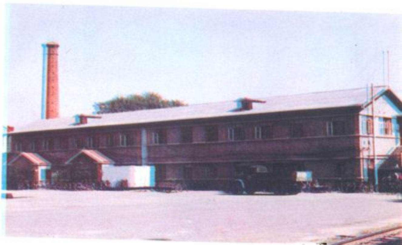
哈尔滨市道外区小八站街四号 市水产供销公司东办公室