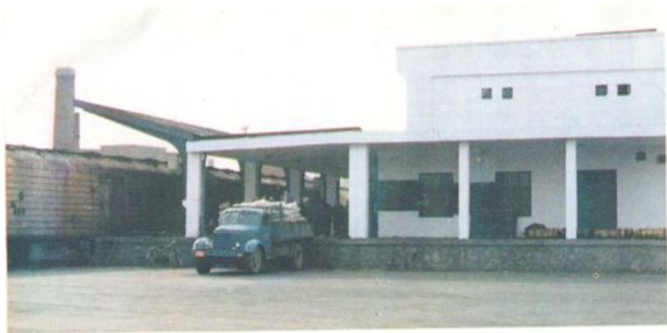
公司一号冷藏库拔货现场