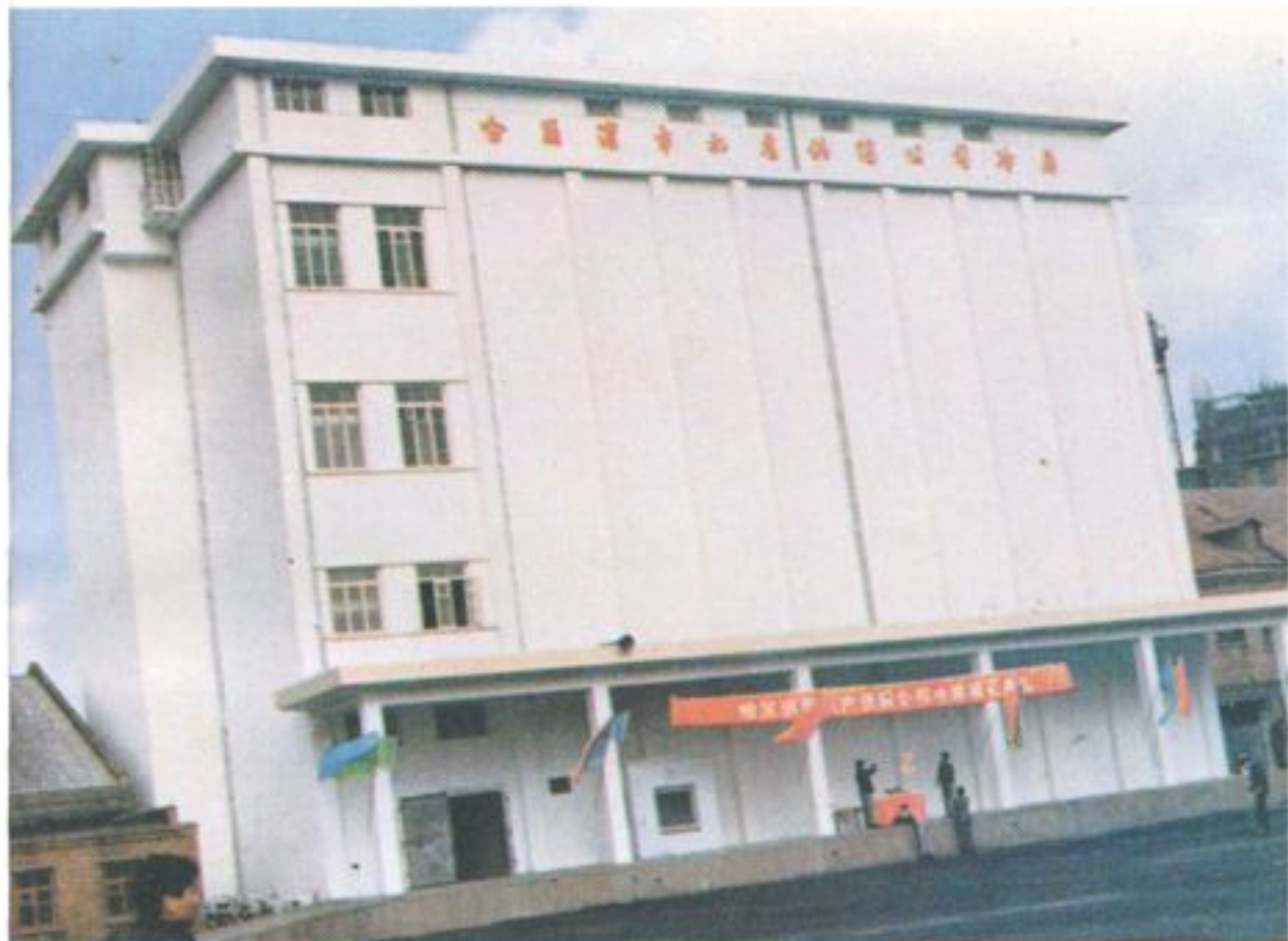
市水产公司三号冷藏库 1988年竣工