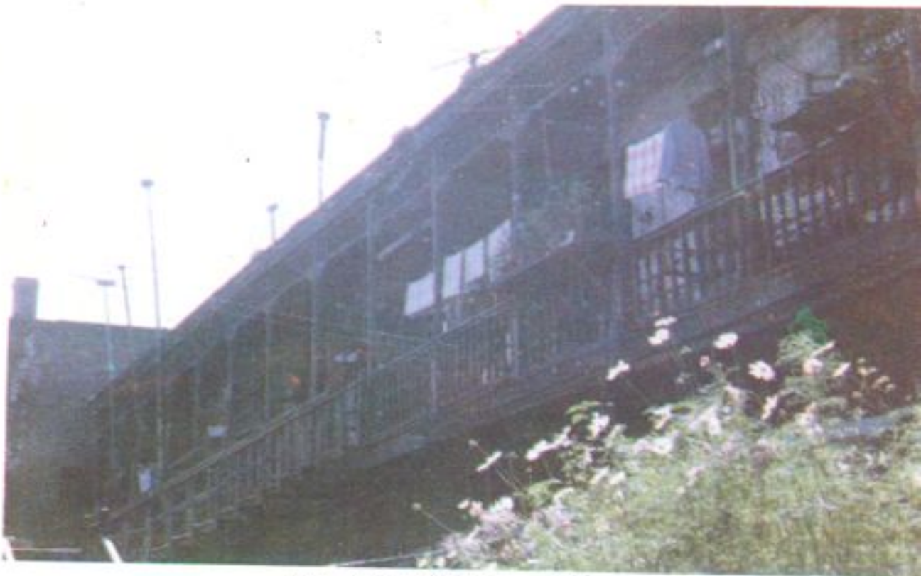
哈尔滨市道外南三道街34号 市水产公司成立时旧址