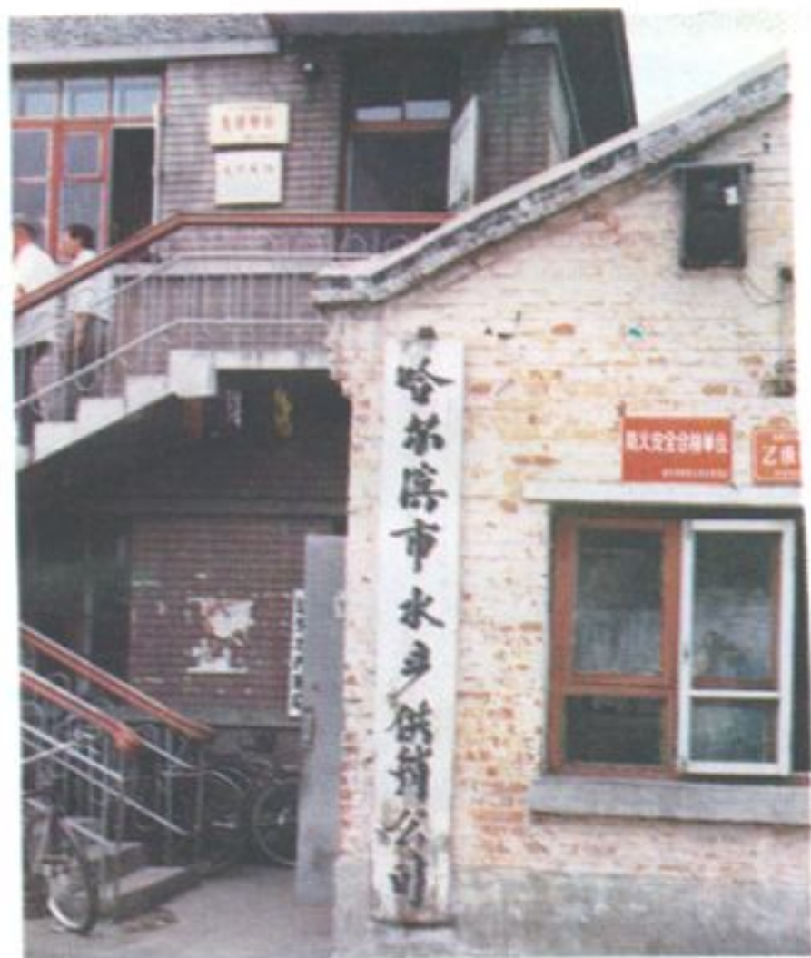
道外北马路小八站街四号 哈尔滨市水产供销公司现址