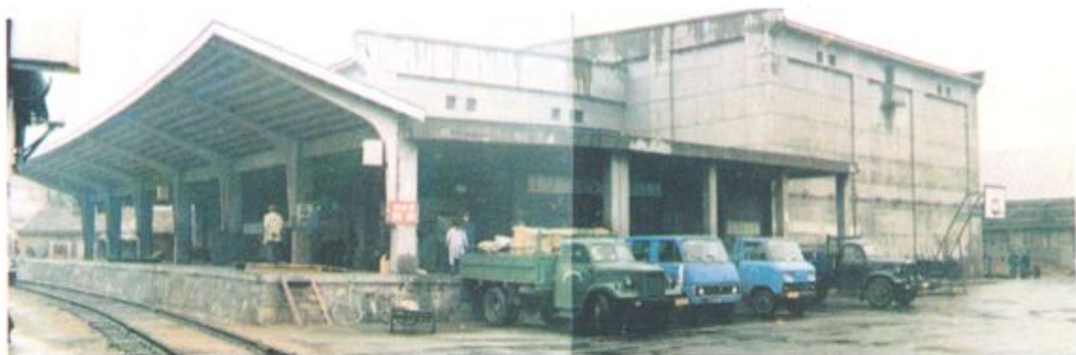
哈市水产公司 一号冷藏库 卸火车现场