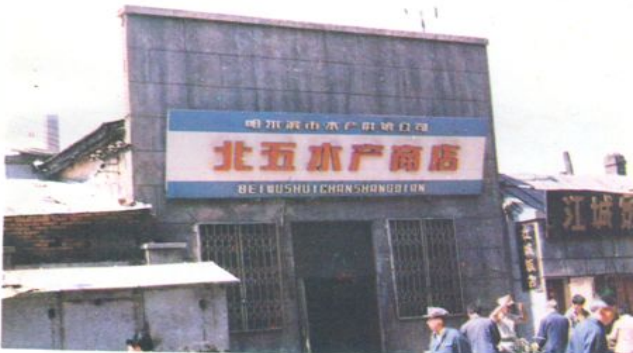
哈市道外区北五道街 原市水产批发市场