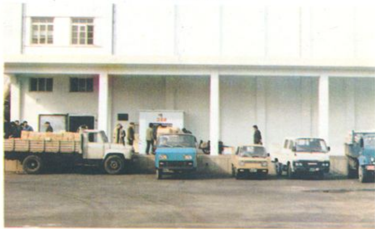
三号冷藏库拔货现场