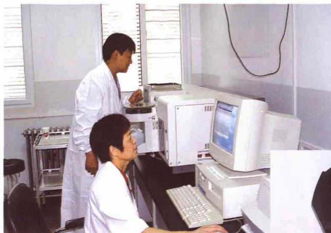
理化室技术人员进行原子吸收光谱测定