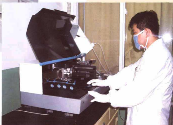
艾滋病确认实验室工作人员进行艾滋病初筛