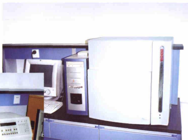
全自动凝胶成像分析系统