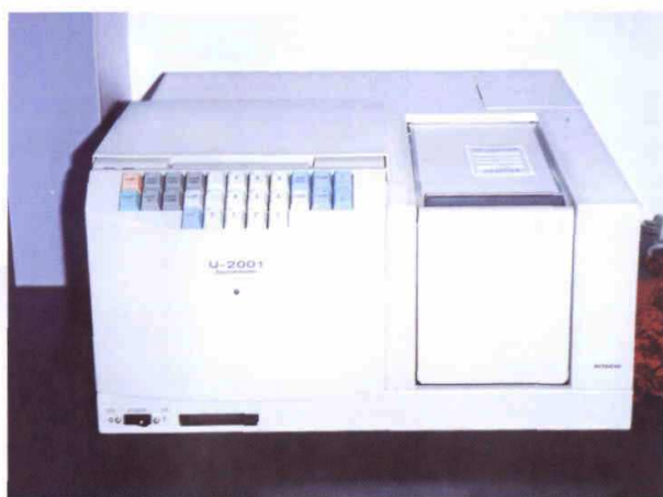
紫外可见分光光度计