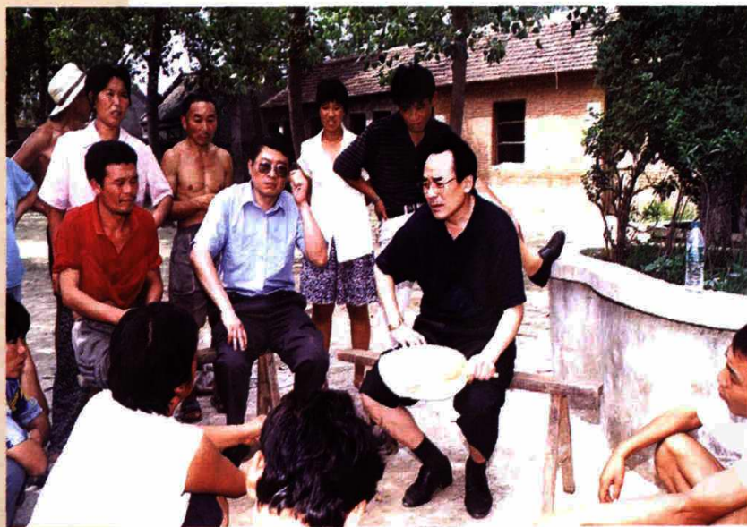
刘学周副厅长深入疫区调研