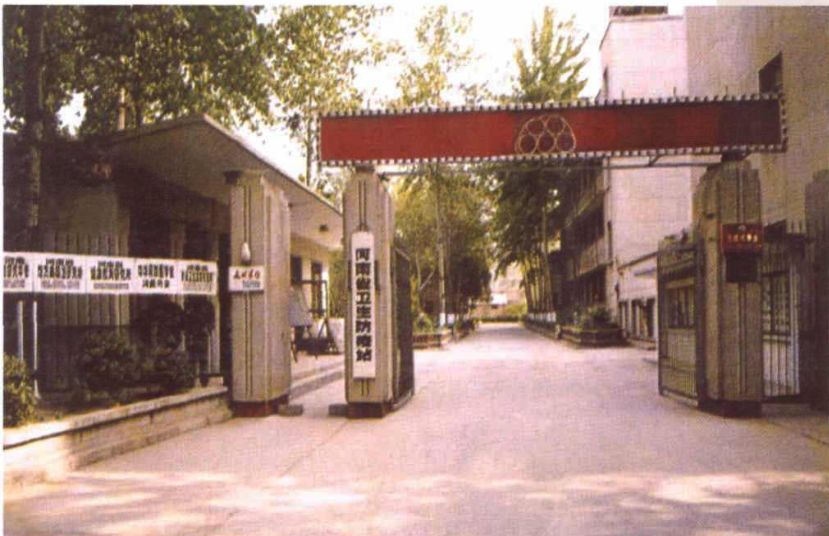
1970年至1999年我站郑州市纬五路东段47号改造前现址大门