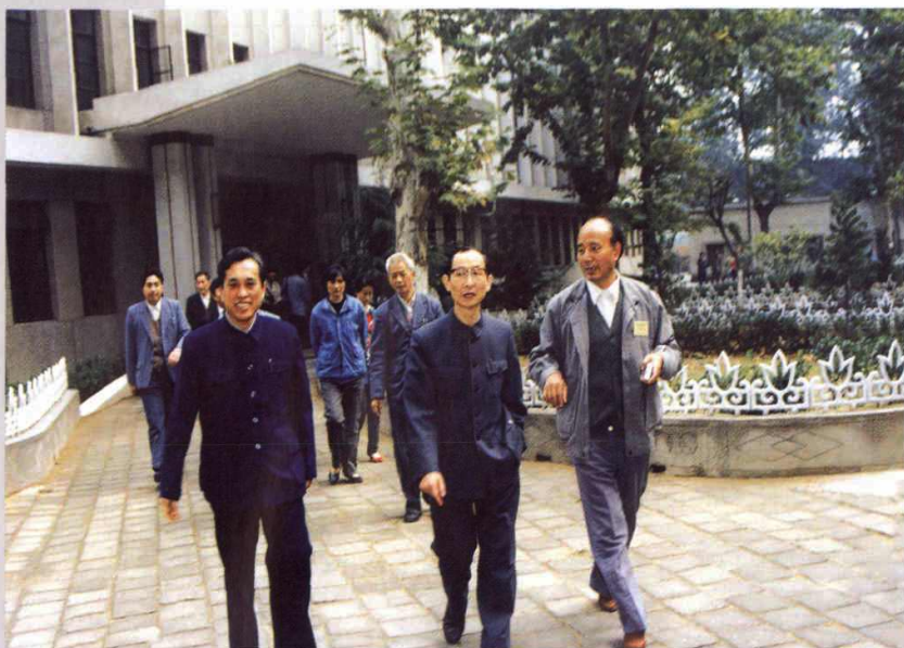
原卫生部陈敏章部长来我站视察