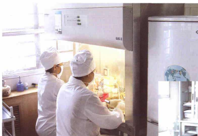
麻疹实验室工作人员做血清学检测