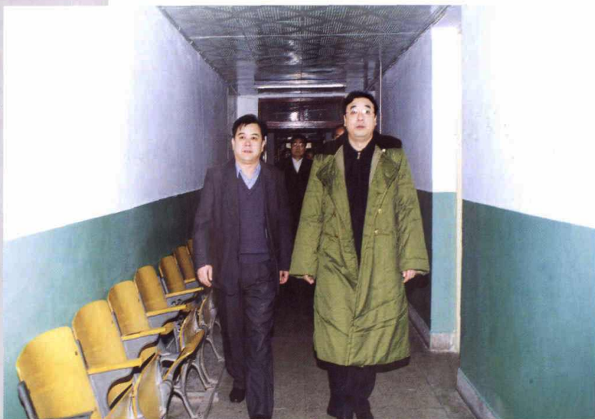
卫生部马晓伟副部长来我站视察