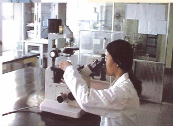
脊髓灰质炎实验室技术人员在工作