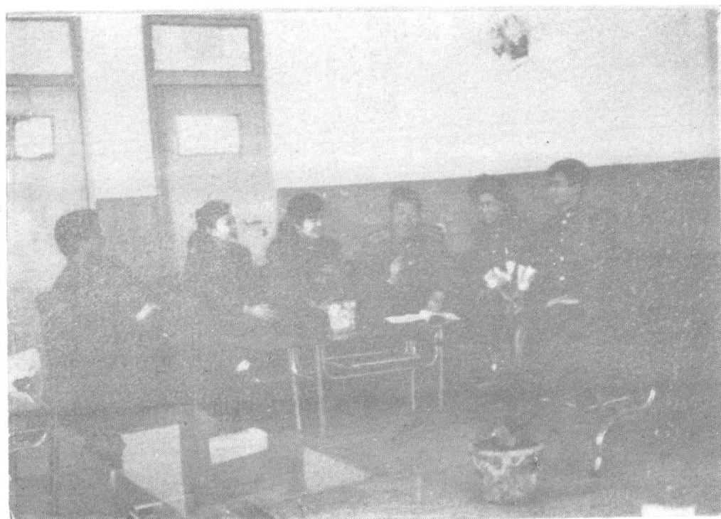
县个协部分工作人员