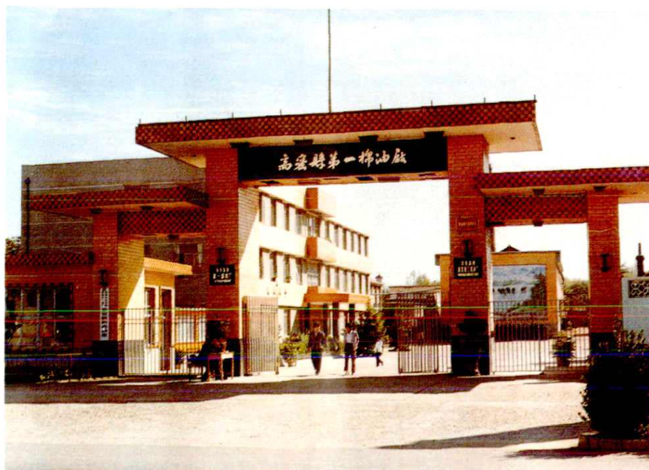
高密县第一棉油厂