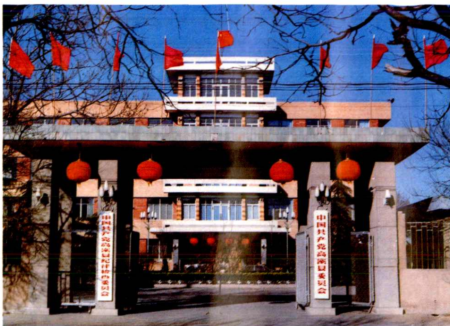
中国共产党高密县委员会