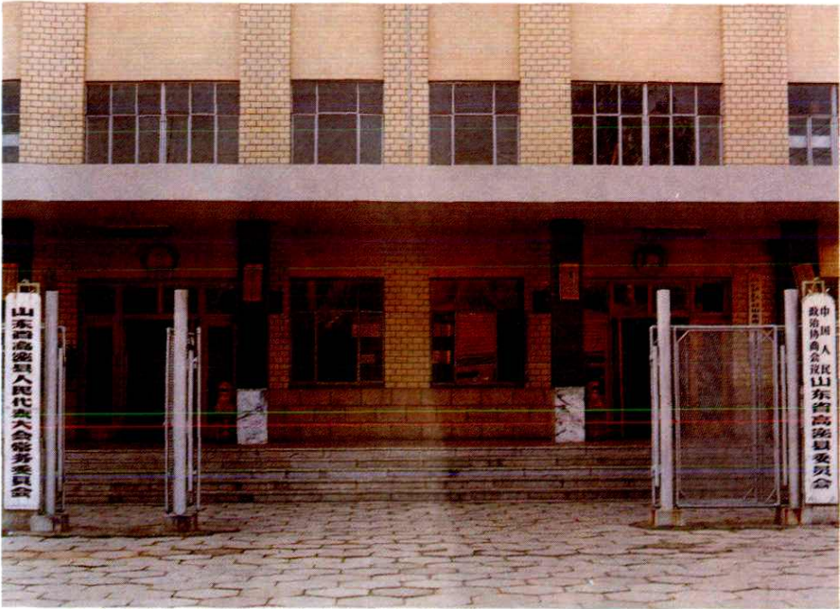
山东省高密县人民代表大会常务委员会 中国人民政治协商会议山东省高密县委员会