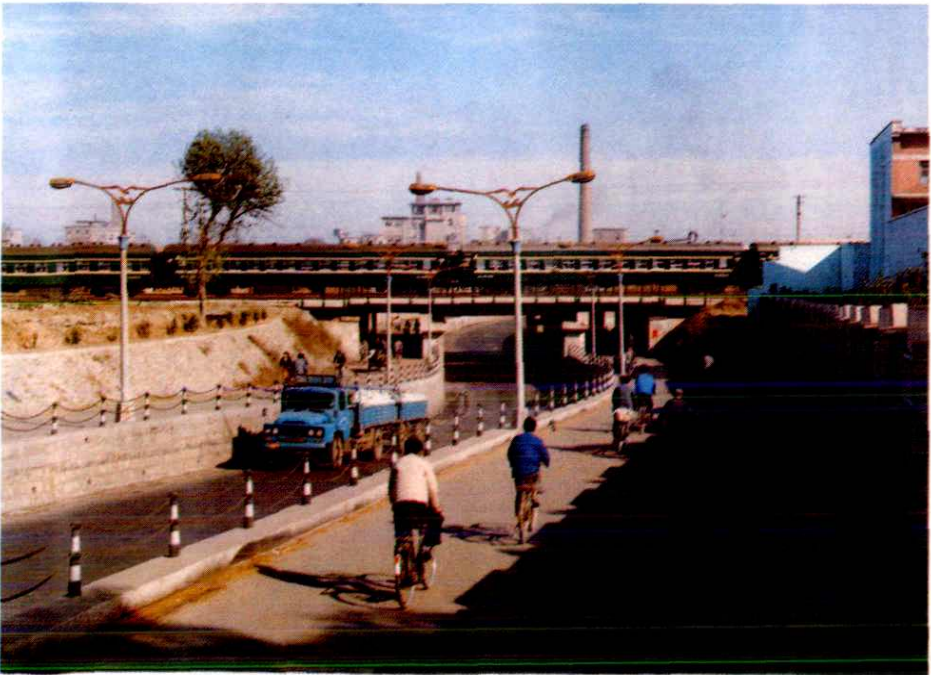
胶济铁路葛家庄立交桥