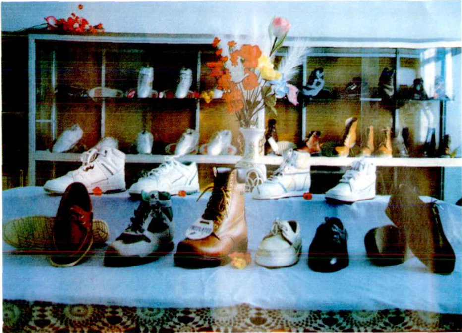
高密县皮鞋厂产品