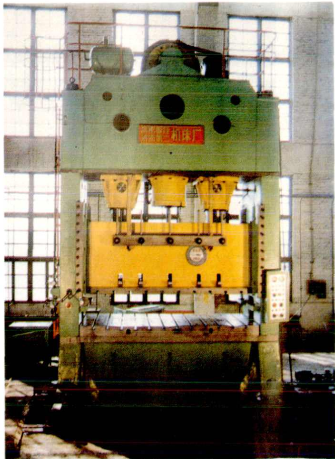
高密县锻压机床厂产品