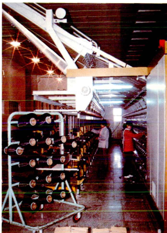
合成纤维厂长丝车间