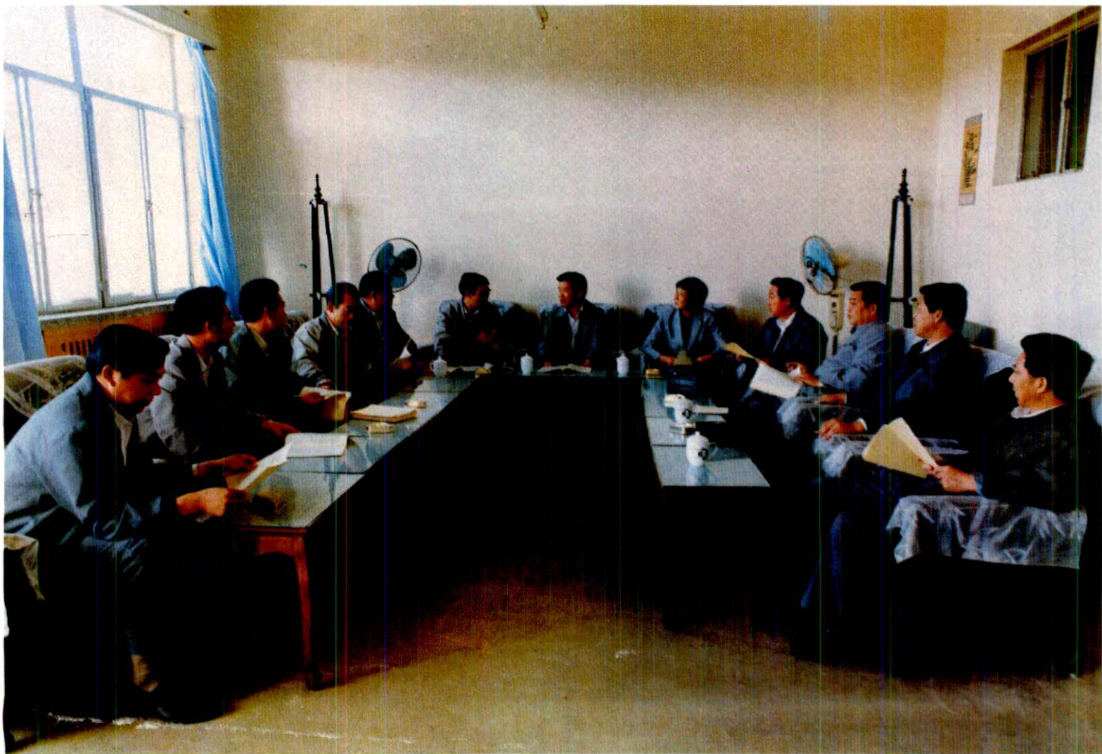
中共高密县委员会常务委员会全体成员在审定《高密县地名志》稿