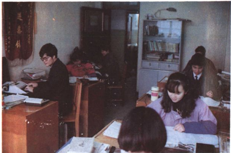
寧波中行進出口結算審單一瞥。