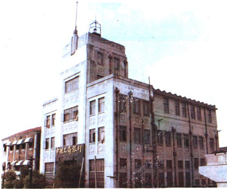
1978年10月重建後至1983年9月,寧波中行行址——外馬路23號〈現為寧波市工商銀行〉。