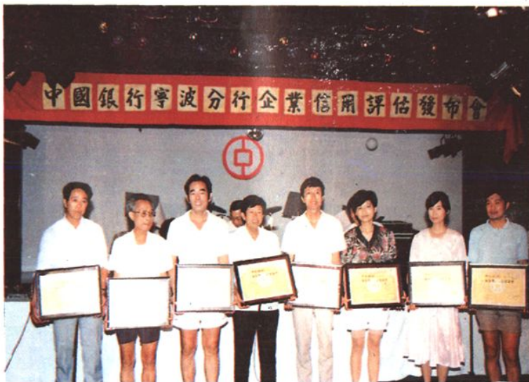
寧波中行1990年度企業信用評估發布會在金龍飯店舉行。