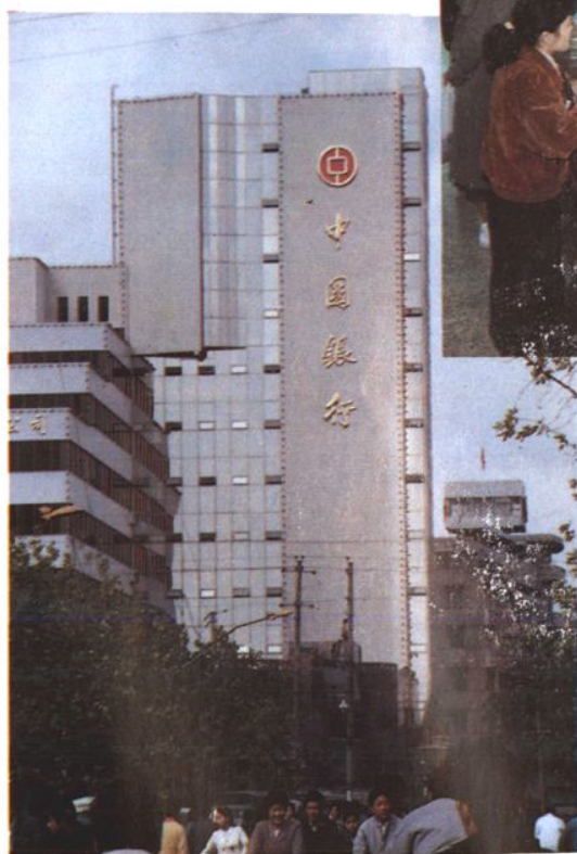
寧波中行即將遷入的新大樓。