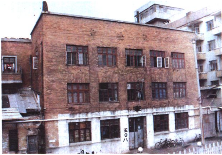
1933年〈民國二十二年〉寧波中行行址從外馬路67號遷入外馬路42號〈現為寧波市五金交電化工公司五〇八倉庫〉。