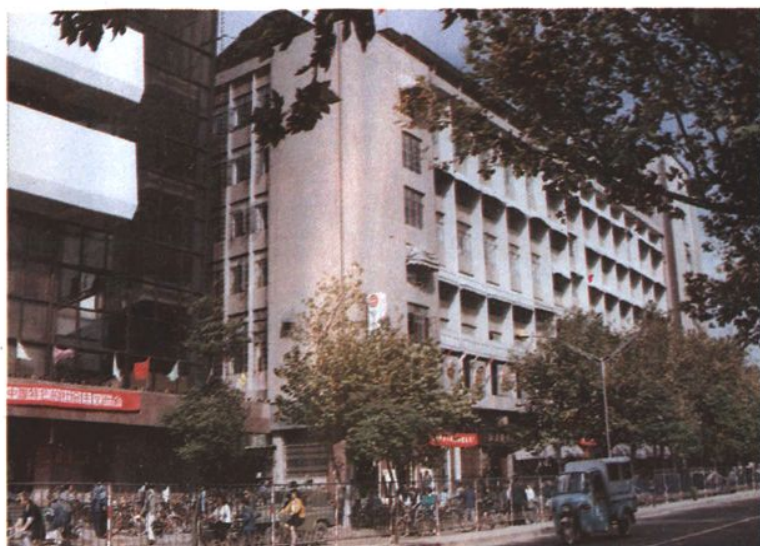
1983年10月至今，寧波中行行址——江廈街43號。