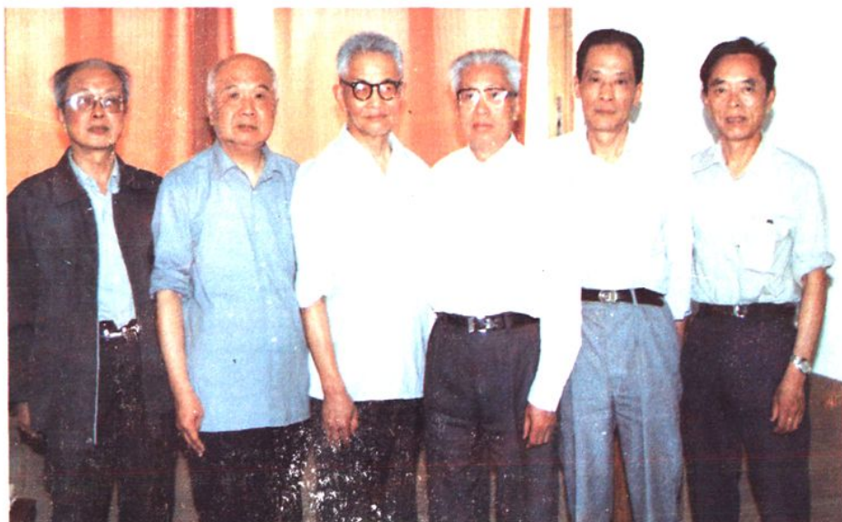
《中國銀行寧波分行志》顧問委員會