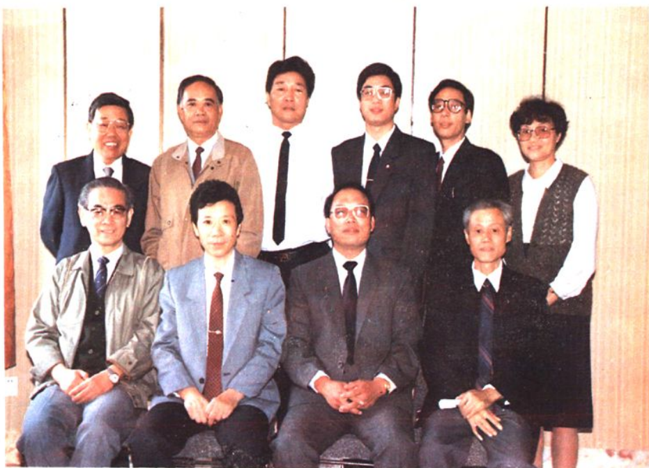
《中國銀行寧波分行志》編審委員會