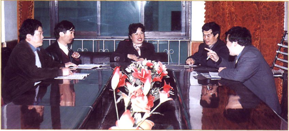
局领导班子在研究工作