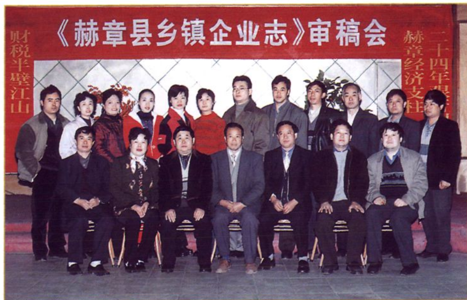
赫章县乡镇企业局机关干部职工合影 (2001年12月6日)。