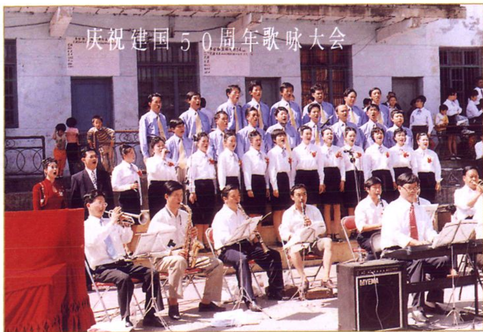
县乡镇企业局合唱队在县庆祝建国50周年歌咏大会上演唱。