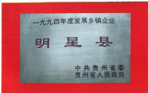
县乡企局获省委、省政府奖牌