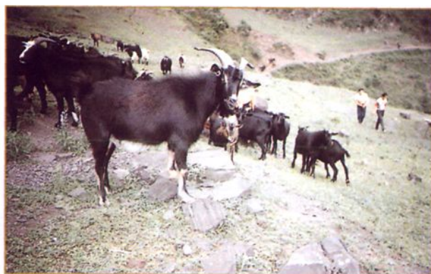
古达乡采取“公司加基地连农户”的模式发展种植业和养殖业。图为正在放牧的马头黑山羊。