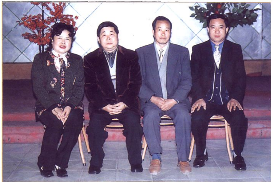
赫章县乡镇企业局第三、四、五、六任局长合影（2001年12月6日）