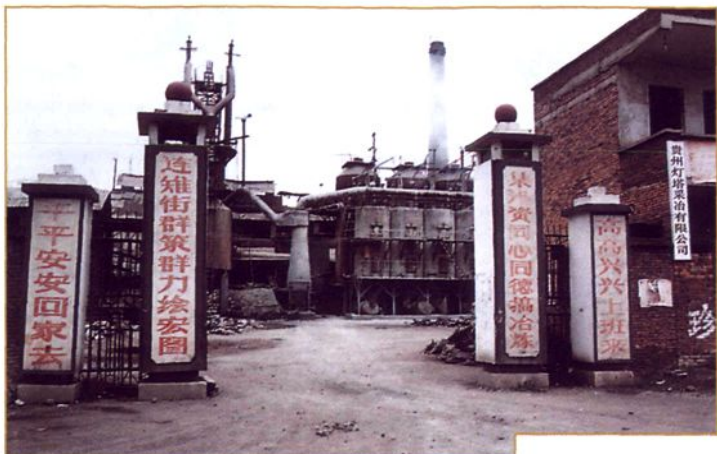
灯塔采冶有限公司