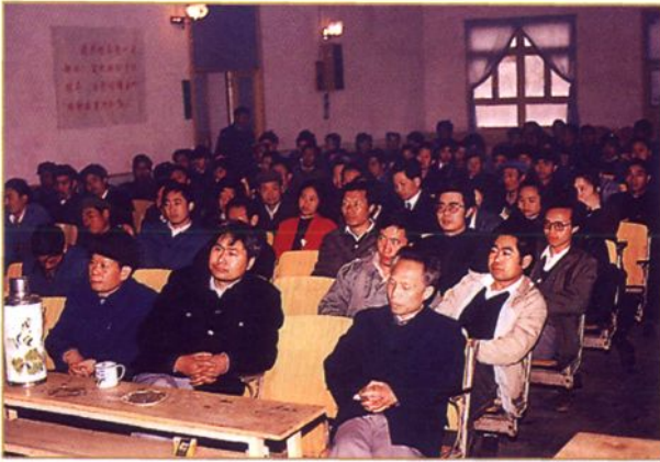
全县乡镇企业工作会会场一角