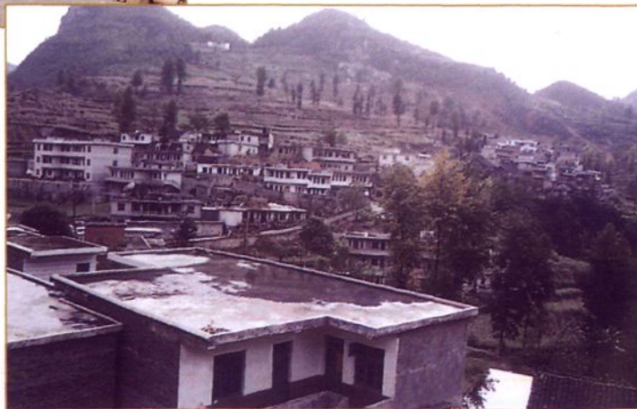
靠开发矿产资源致富的妈姑镇天桥村新貌