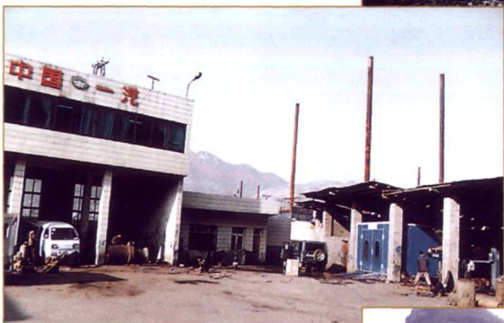
鸿飞铸冶业有限公司汽车修理场