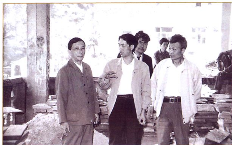
国务院扶贫办主任杨钟到企业了解情况。