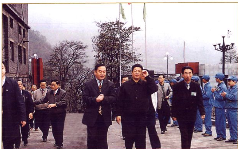
1999年11月，中共中央统战部部长王兆国视察诚达公司。