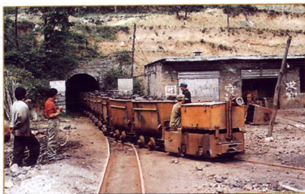
雄飞铁矿的翻斗车正运矿出井