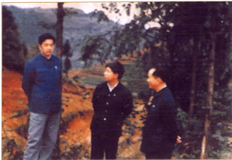
中共中央政治局常委、国家副主席、中央军委副主席胡锦涛任贵州省委书记时，1987年8月来赫章视察野马川冶炼厂时听取县乡镇企业局局长胡庭荣汇报工作。