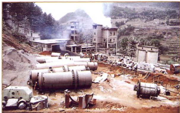
正在进行技术改造中的砂石水泥厂