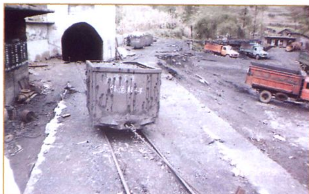
翻斗车运煤炭出井