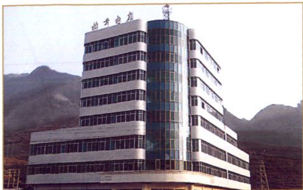
城关镇建筑公司承建的县供电调度大楼