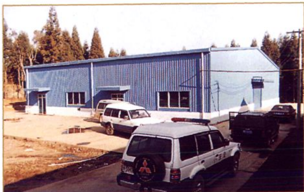
位于水塘林中的赫之林饮料有限公司