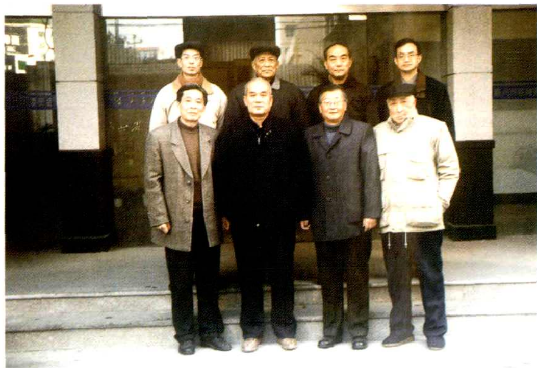
《嘉兴市教育志》编委合影