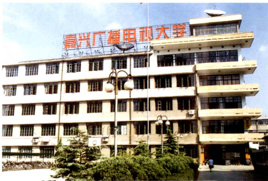
嘉兴广播电视大学