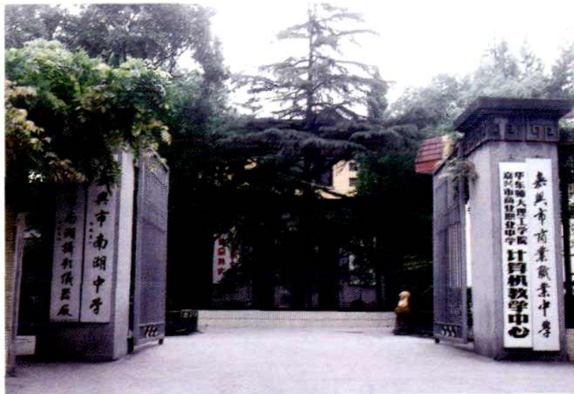
嘉兴市 商业职业中学 (南湖中学)