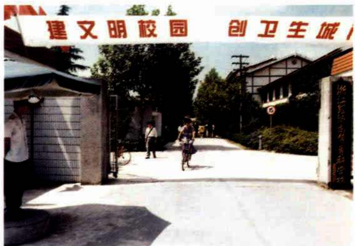
浙江经济高等专科学校