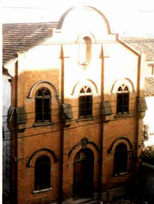
嘉兴民德女中小礼堂