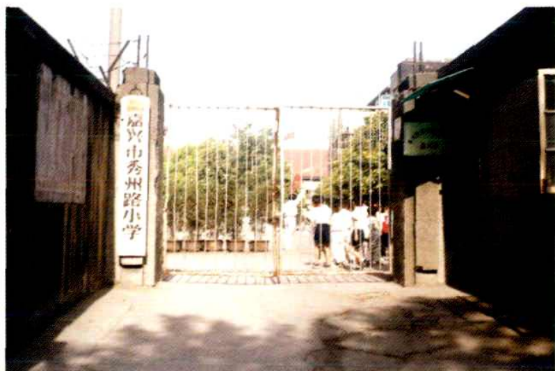
嘉兴市 秀州路小学