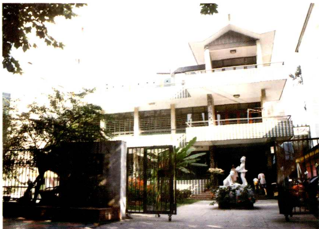
嘉兴市第一幼儿园