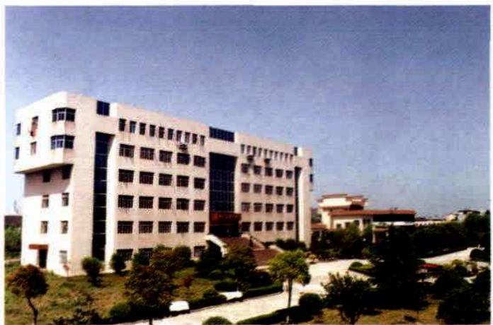
嘉兴高等专科学校