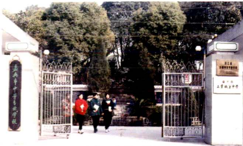
嘉兴市 中等专业学校