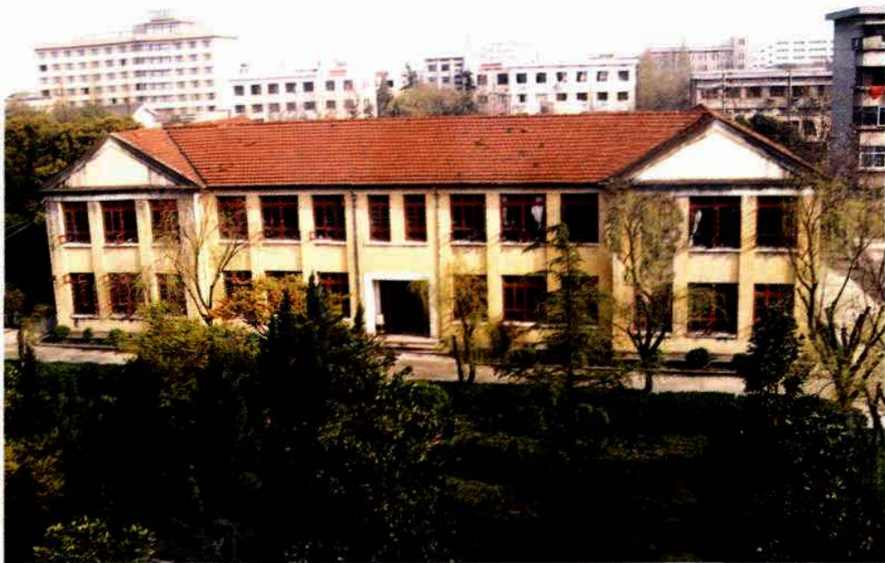
嘉兴第三中学 东教学楼