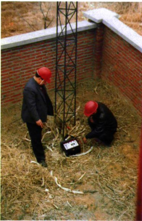
▲市安全检查人员现场检测避雷针