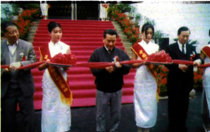
劳动部部长李伯勇、省委副书记王怀远等领导为中国沈阳劳动力市场开业剪彩

中国沈阳劳动力市场是经国家劳动部批准的区域性劳动力市场，是东北区域劳动力信息网络中心，于1995年10月15日正式建成并开业运作。中国沈阳劳动力市场以充分开发和合理配置劳动力资源，为经济建设和社会发展服务为宗旨，以立足沈阳、服务东北、辐射全国与国际劳动力市场接轨为指导思想，以供需见面、双向选择、公平竞争、互惠互利为原则，以会员制、代理制及周边城市实行理事会制为基本运作方式。