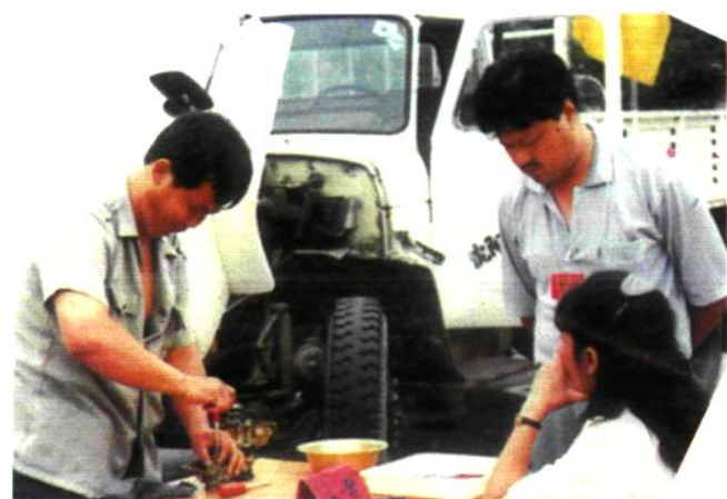
汽车修理赛场一角

为使沈阳市职业技能竞赛活动与国际奥林匹克技能竞赛接轨，在总结历年技能竞赛经验的基础上，市劳动局、市总工会、共青团沈阳市委、市妇联等部门多次举办全市职业技能竞赛活动，取得显著成果。1997年第四届职业技能竞赛活动中，有5万多名技术工人参加10个工种的选拔赛。有650名选手进入市级决赛。12月11日召开的第四届职业技能竞赛表彰会上对101名优秀选手进行表彰。授予30名选手为“技术状元”，71名为“技术能手”，8名被市政府评为劳动模范，2名被破格授予高级技师职务资格，19名被破格授予技师职务资格。