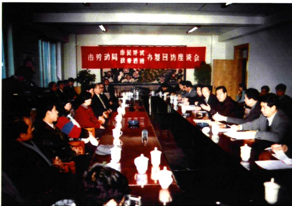
1999年1月14日，市长慕绥新来市劳动局视察市民投诉中心，并参加市民评议政府活动座谈会