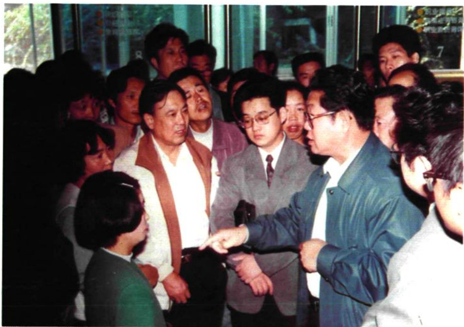
▲ 1996年9月8日市委书记张国光视察市劳动局工作时，在中国沈阳劳动力市场与求职者交谈

中国沈阳劳动力市场基本形成了以中国沈阳劳动力市场为龙头，以区、县(市)劳动力市场为重点，以街、乡镇职业介绍机构为依托，以民办职业介绍所为补充的职业介绍机构网络，并逐步扩大到地区，实现与国际接轨。全市共有职业介绍交流场地面积 9392 平方米，职业介绍工作人员 470 人，其中大专以上学历占 62%。配备微机 66 部，有专兼职信息员 1099 人。全市共建立各级各类职业介绍机构 294 个，其中市、区、县(市) 14 个，街、乡镇 252 个，民办 28 个。1996 年介绍就业和调剂安置 111472 人，其中安置企业富余职工 86762 人，安置失业人员 7856 人，安置其他待业人员 16854 人。