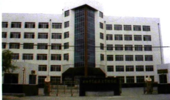
▲沈阳市高级技工学校