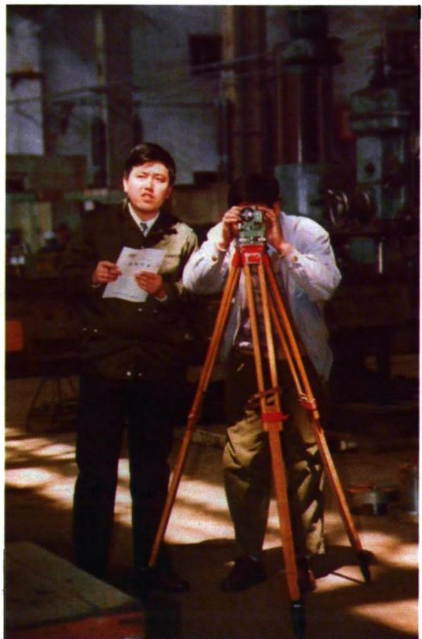
◀市安全检查人员在车间检测起重设备