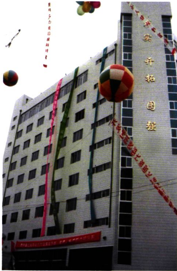
市劳动局新建办公大楼