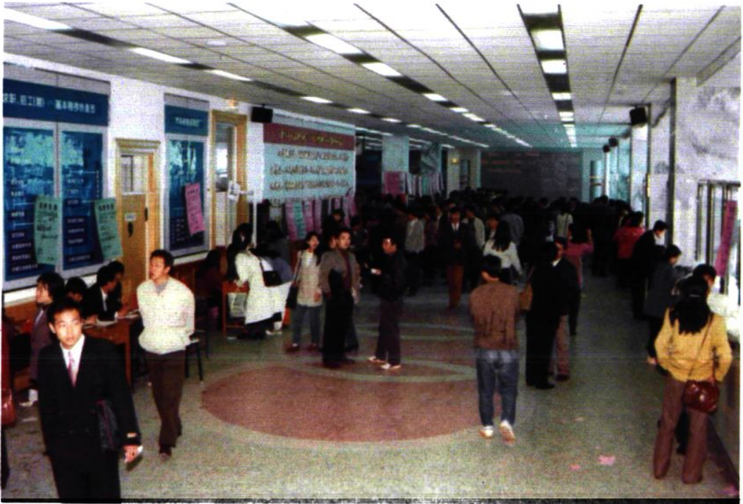
中国沈阳劳动力市场大厅一角