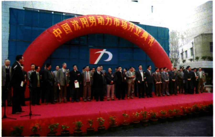
劳动部部长李伯勇及省、市领导参加中国沈阳劳动力市场开业典礼