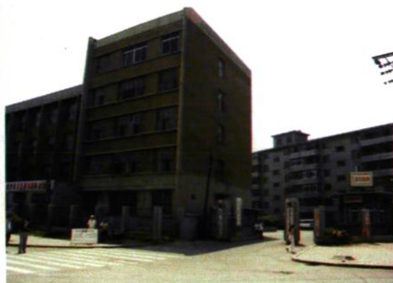
▲沈阳市锅炉压力容器检验研究所