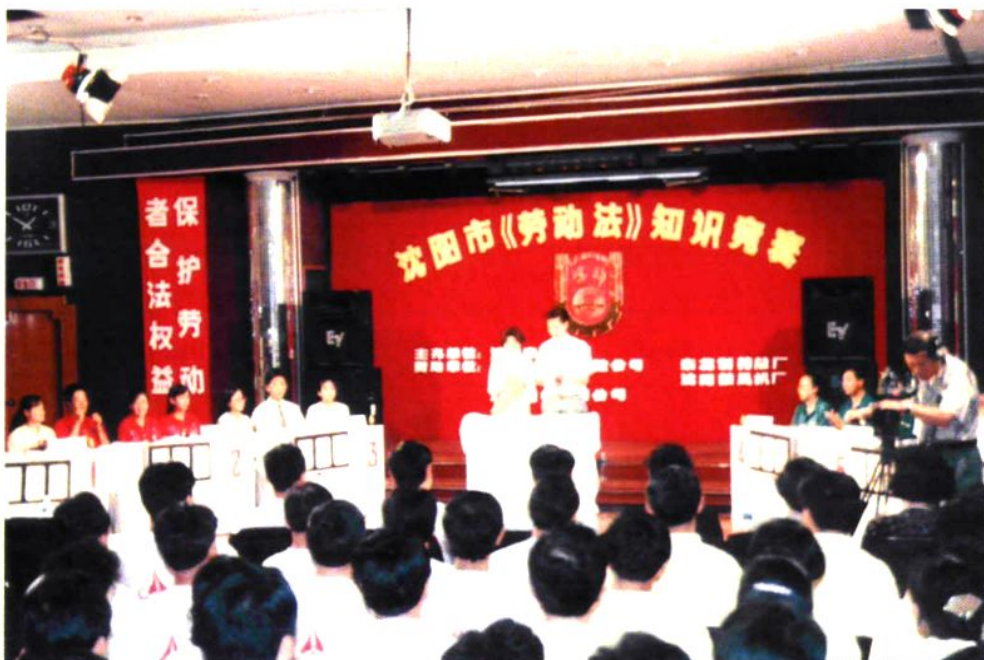
1995年市劳动局举办《劳动法》知识竞赛活动