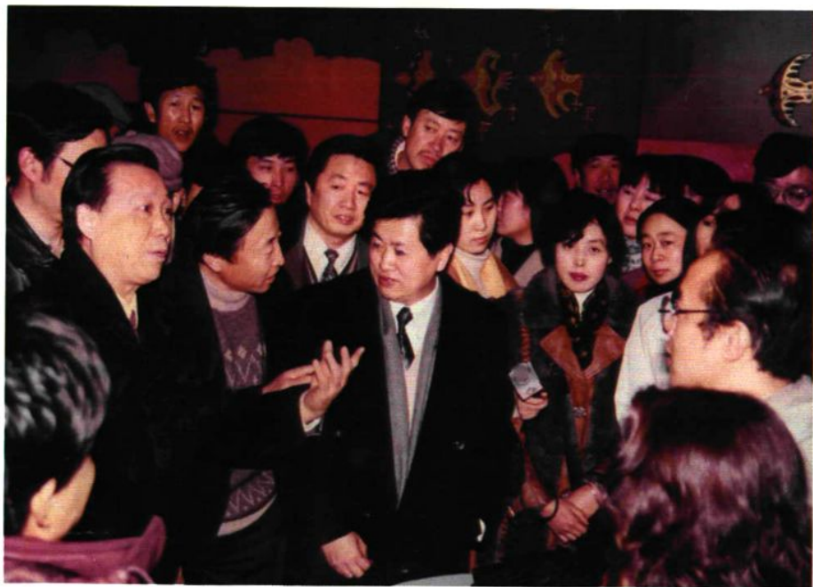
▲ 1996年1月11日，劳动部副部长朱家甄在市长张荣茂陪同下视察中国沈阳劳动力市场时与求职者交谈