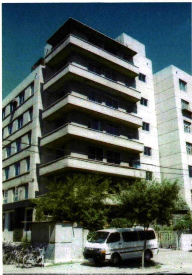
▲沈阳市劳动保护技术检测研究所