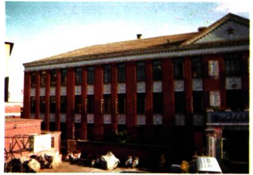
市劳动局原办公楼(1994年2月拆迁)