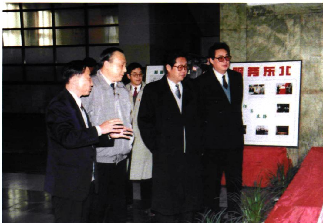
1996年10月24日，劳动部副部长林用三在市委书记张国光、省市劳动局领导陪同下，参观沈阳市劳动就业成果展