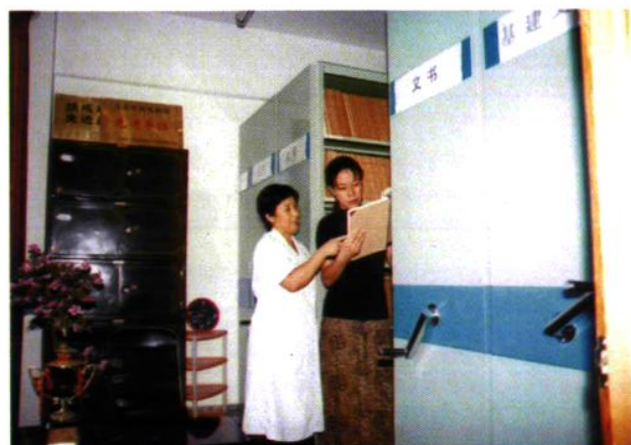
▲沈阳市劳动局档案室（省档案一级优秀管理单位）