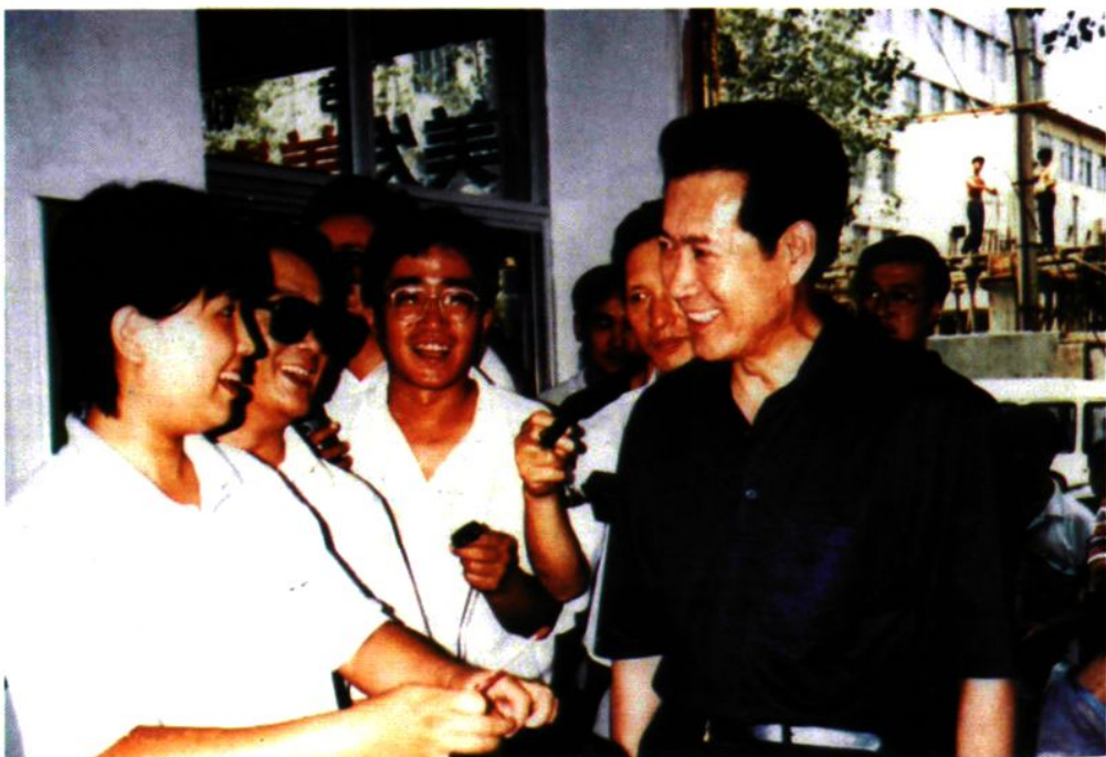
1997年,市长慕绥新视察下岗职工再就业培训基地