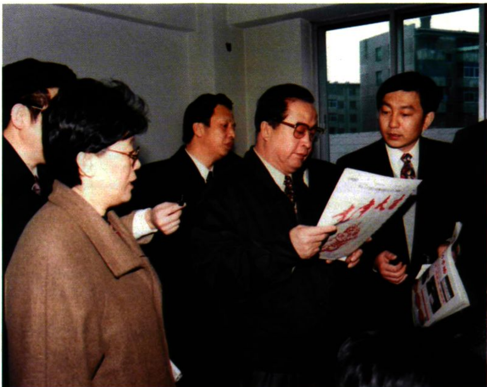
1998年3月18日,市委书记徐文才视察中国沈阳劳动力市场