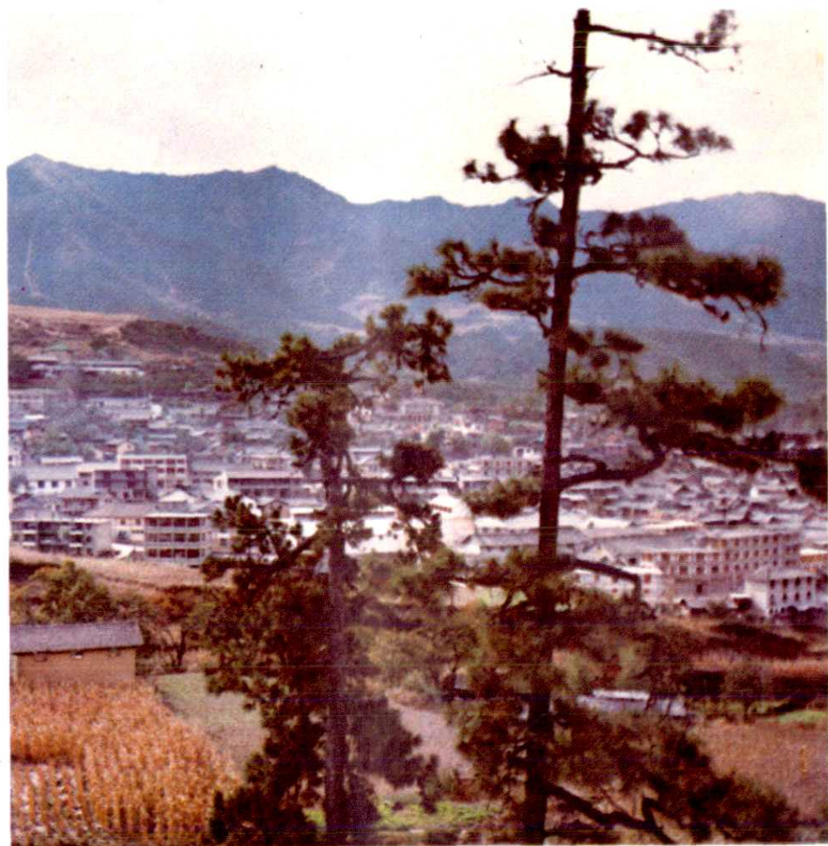
(图二) 维西傈僳族自治县、保和镇一角