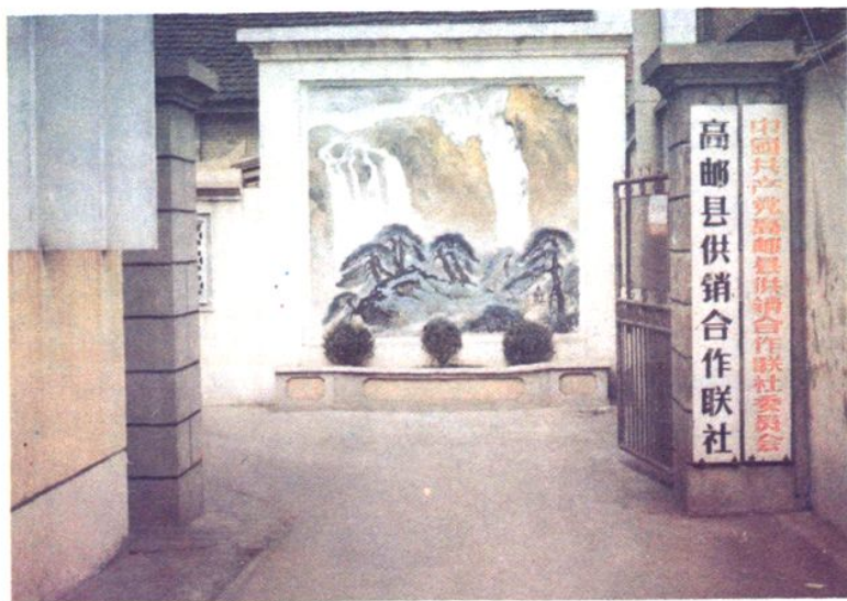
高邮县供销合作联社