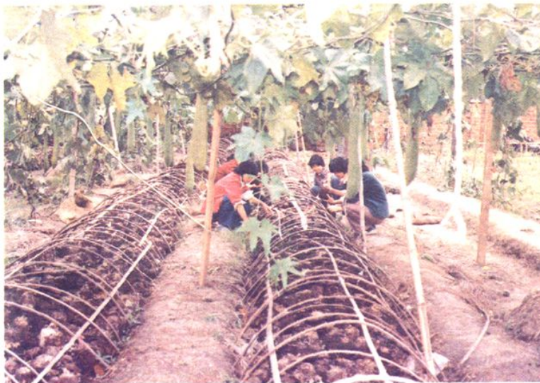
庭院立体栽培的黑木耳