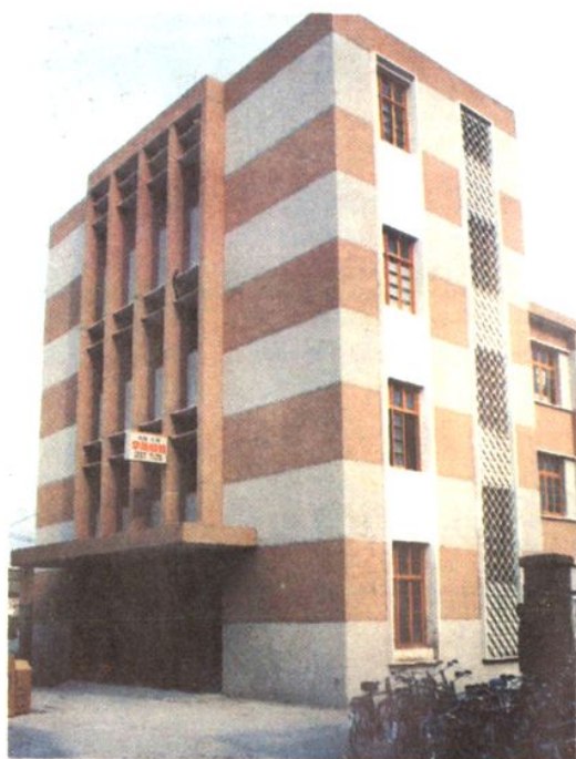
高邮县界首供销社华美服装厂大楼