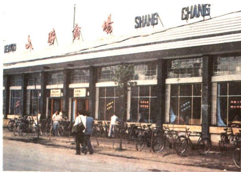
高邮县武安供销合作 社文游商场营业面积 一千八百平方米