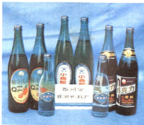
三垛珠湖饮料厂获奖的汽酒汽水