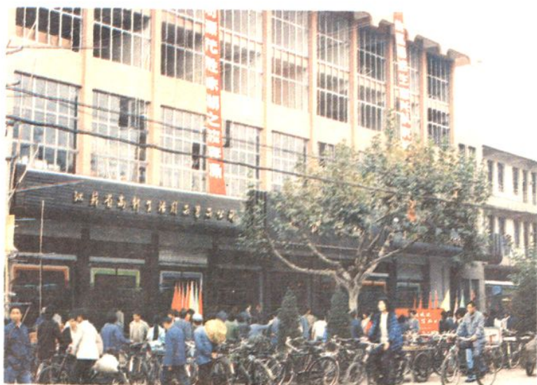
高邮县生活用品果品 公司京杭商场