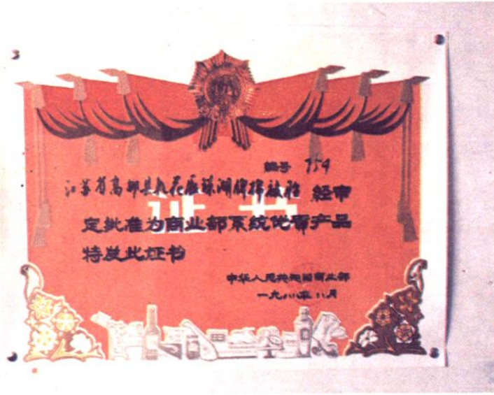
1988年8月，中华人民共和国商业部、颁发 高邮县轧花厂珠湖牌棉被胎优质产品证书