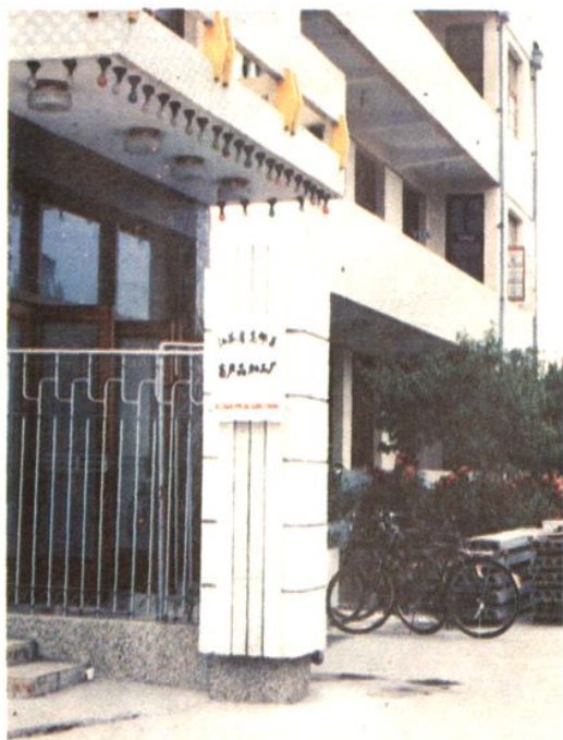
高邮县畜产品加工厂