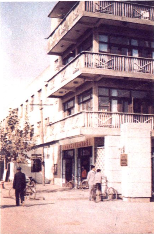
高邮县棉麻公司轧花厂办公楼