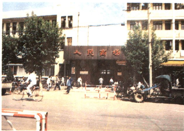
营业面积达三千平方 米的高邮县综合贸易 公司人民商场