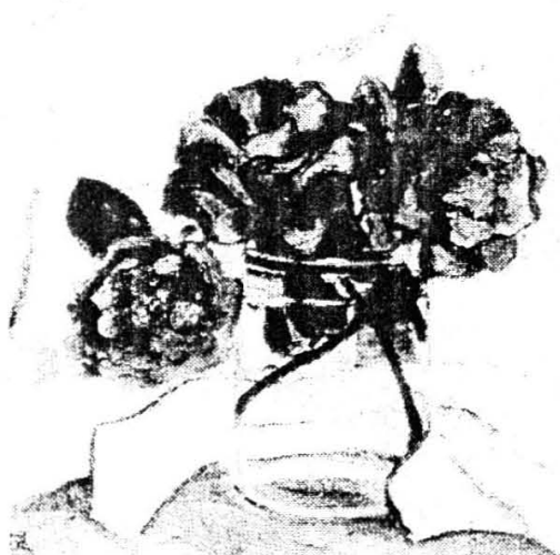
山茶花（布面油画） 39.5 \times 39\text{cm} ，作于1939年。