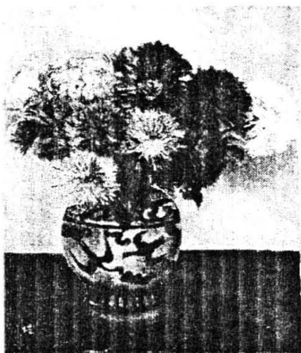
菊花 布面油画（双面油画） 50 \times 40\text{cm} ，1942—1944年间作于成都。上海美术馆收藏。