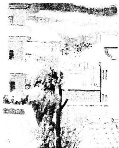
上海莆园（布面油画） 41 \times 30\text{cm} ，作于1949年。