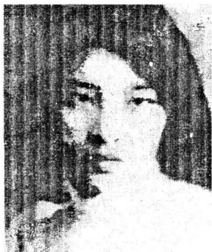
游寿(1906—1994)字介眉，霞浦县松城镇万贤街人。书法家、考古学家，这张照片摄于20年代。