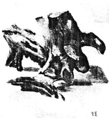
根（布面油画） 41 \times 33\text{cm} ，作于1947年。