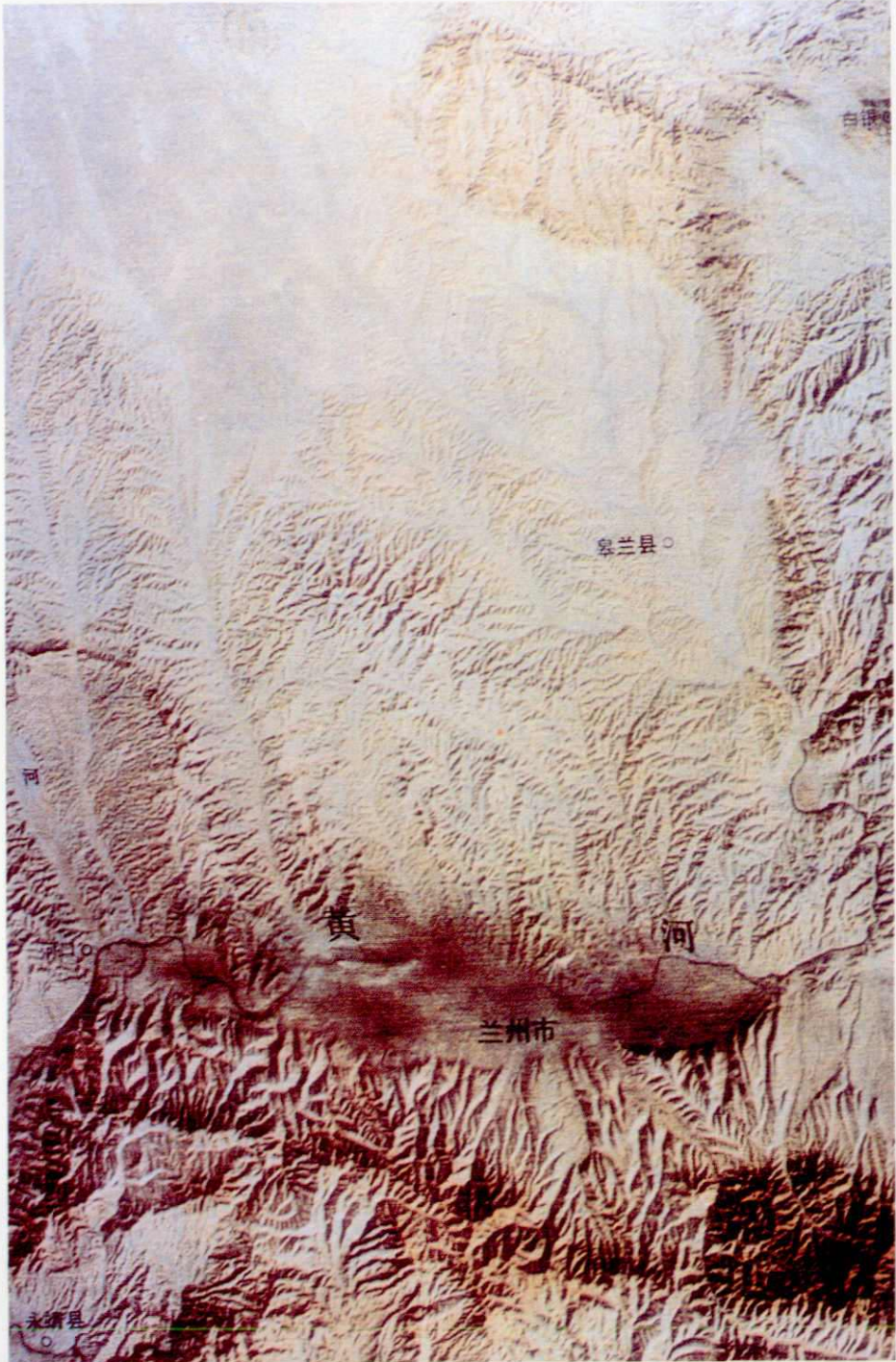
皋兰县地貌卫星照片