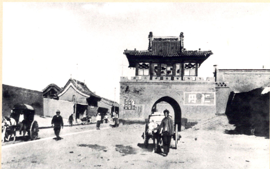
西阁外（摄于二十世纪三十年代）