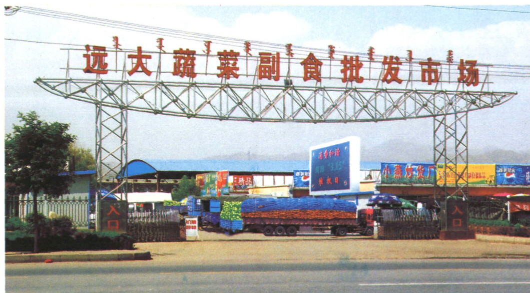
远大蔬菜副食批发市场