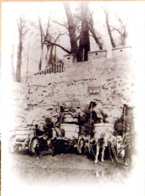
转龙藏(摄于二十 世纪三十年代)