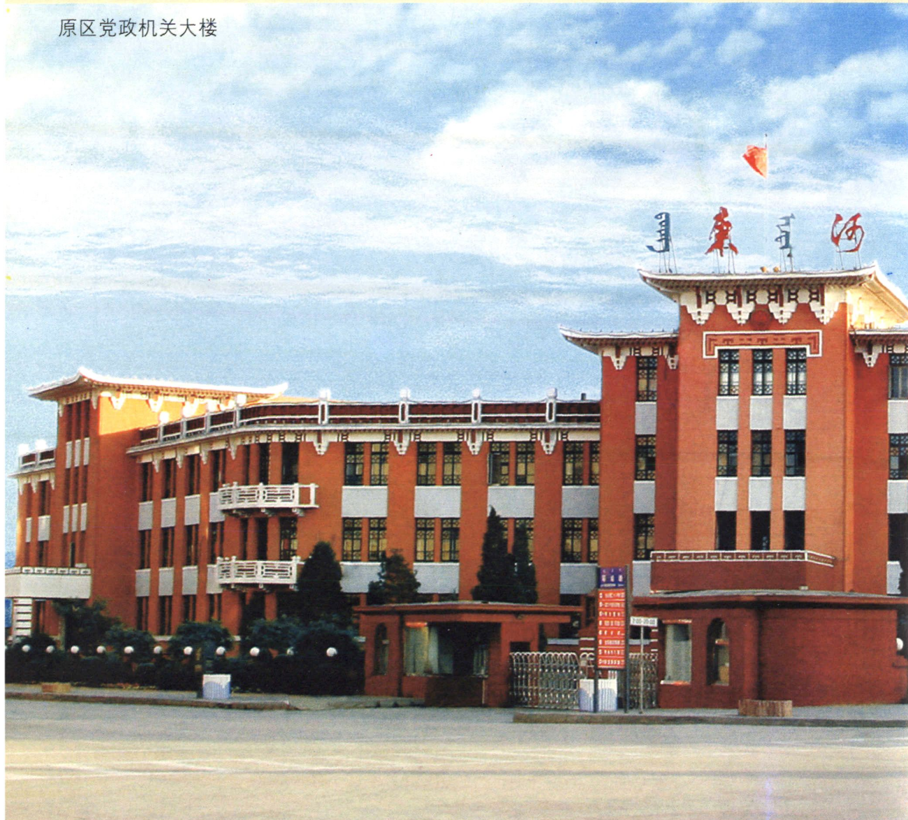
原区党政机关大楼