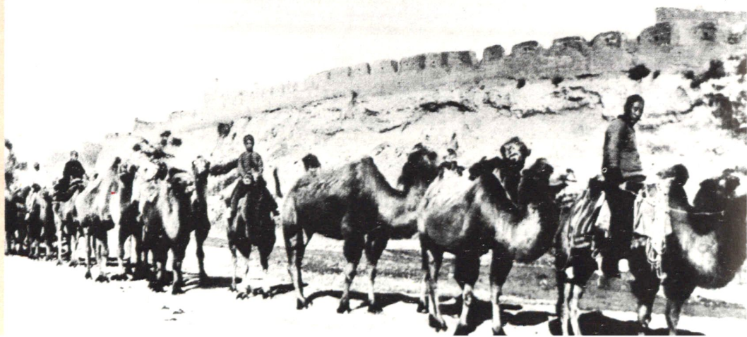
骆驼队 （摄于二十世 纪三十年代）