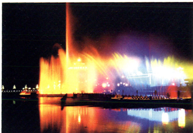
东河景区音乐喷泉