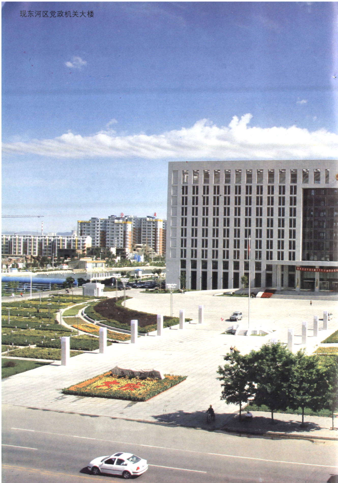
现东河区党政机关大楼