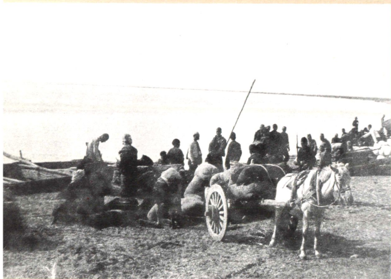
黄河码头 （摄于二十世纪 三十年代）