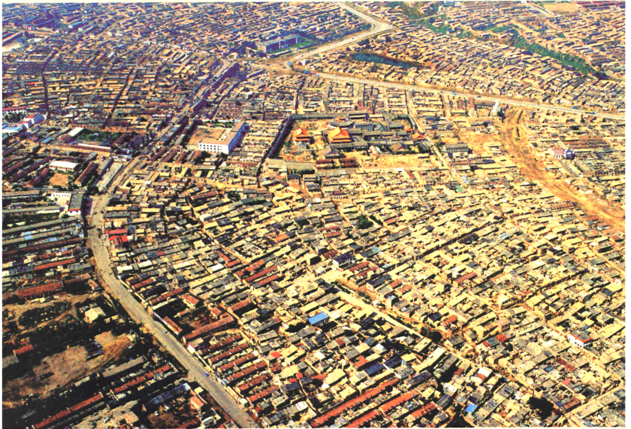
二十世纪八十年代北梁