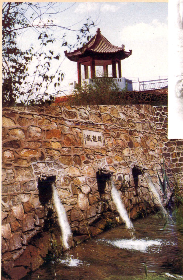
转龙藏(摄于二十一世纪初)