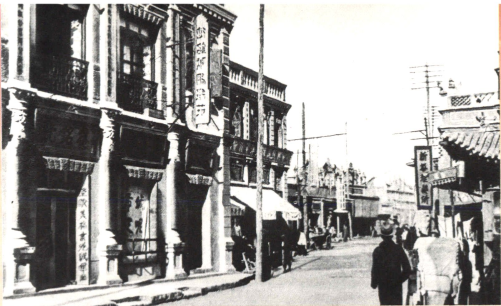
前大街（摄于二十世纪三十年代）