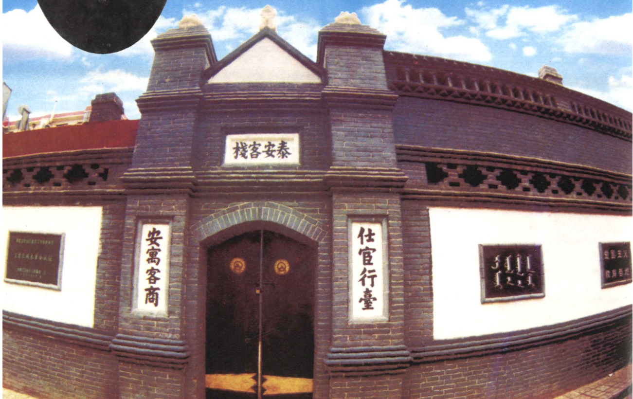
泰安客栈——王若飞纪念馆