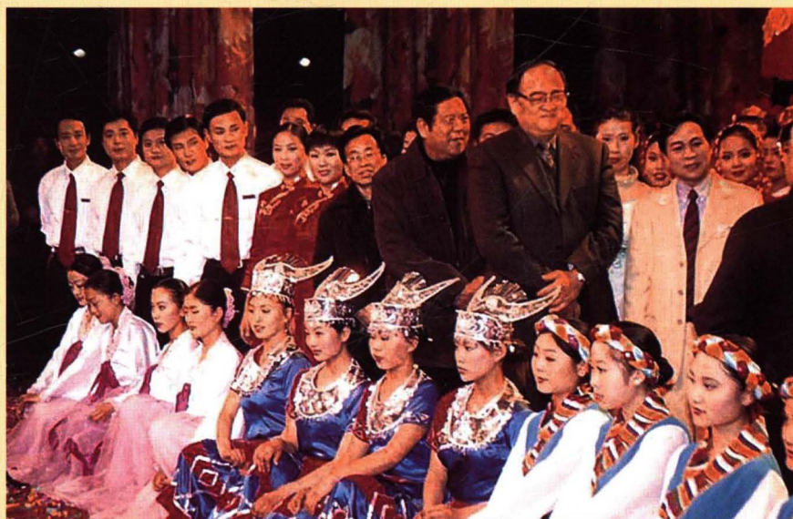
2003年12月，山东省副省长邵桂芳、省委宣传部副部长王凤胜、山东省文化厅厅长张长森接见滨州市参加山东省民营企业文艺汇演的演员