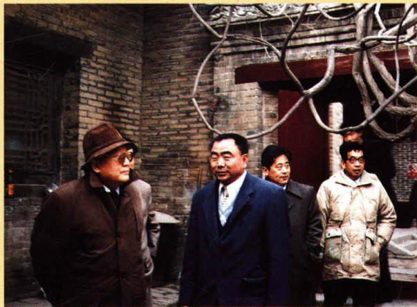
1992年，山东省人大常委会主任李振参观魏氏庄园