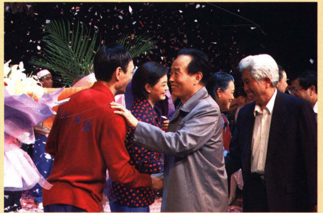
2009年9月，在山东省第九届文化艺术节期间，原省政协副主席王宗廉接见市吕剧团《杨广和》剧组演职员