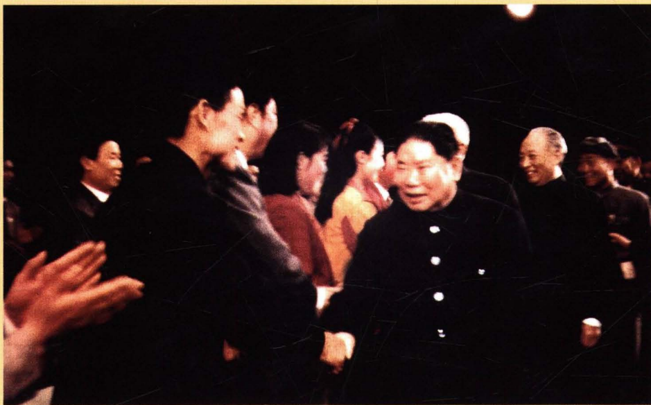
1988年4月，惠民地区吕剧团晋京演出《攀亲记》，中国人民解放军总参谋长杨得志、上将王平、文化部部长朱穆之接见剧组演职员