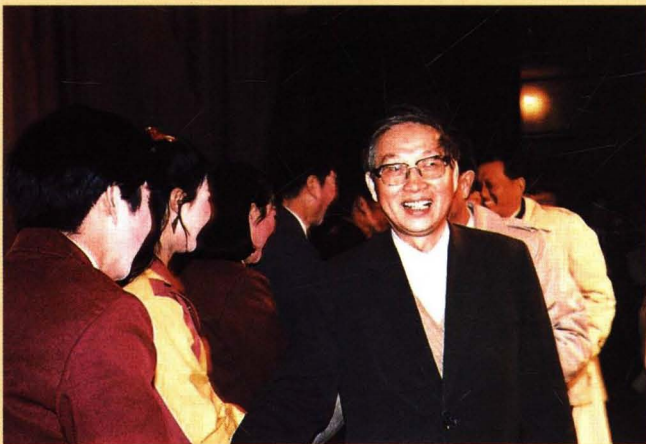
1988年4月，惠民地区吕剧团晋京演出现代戏《攀亲记》，文化部副部长王济夫观看演出并接见演职员