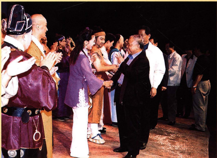
2002年10月，山东省委副书记王修智、省人大常委会副主任董凤基等领导接见市吕剧团《红雪》剧组全体演员