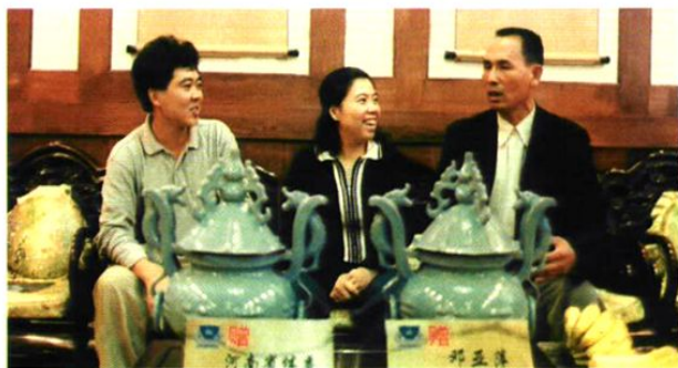
奥运冠军邓亚萍(中)和朱文立(右)在一起