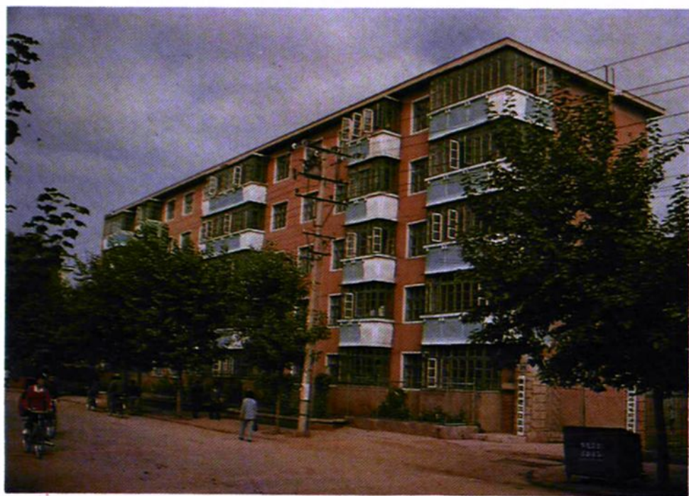
朝阳市外贸局职工家属楼