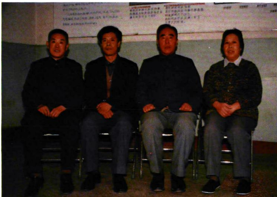
修志办公室成员合影