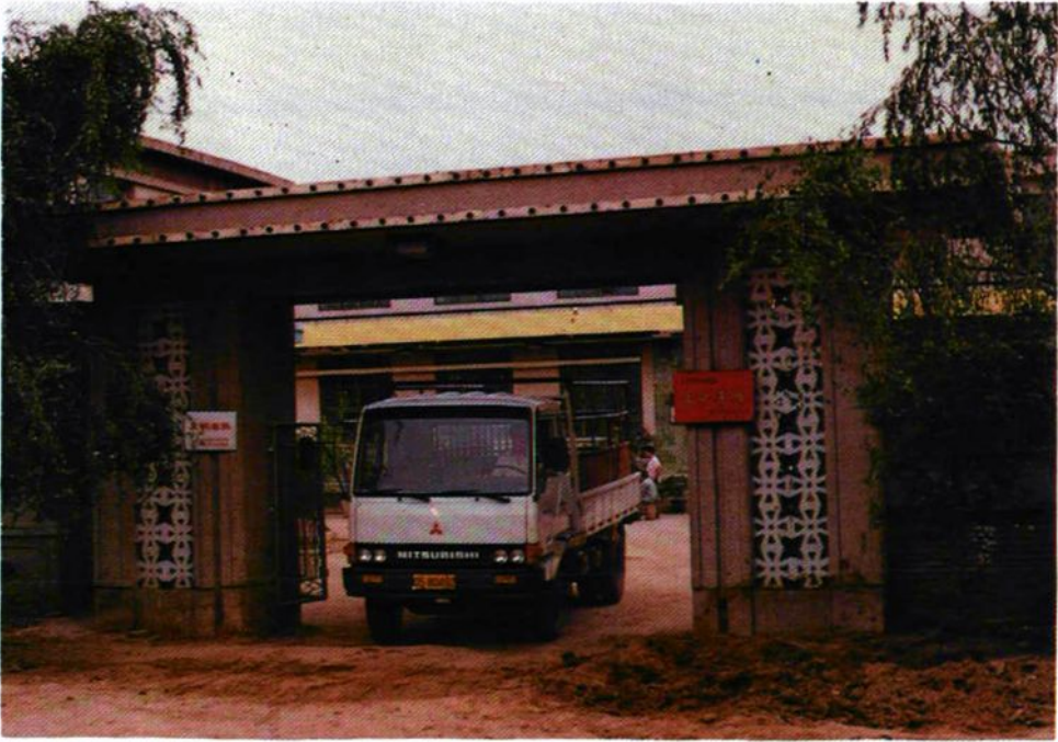
朝阳市外贸冷冻加工厂正门