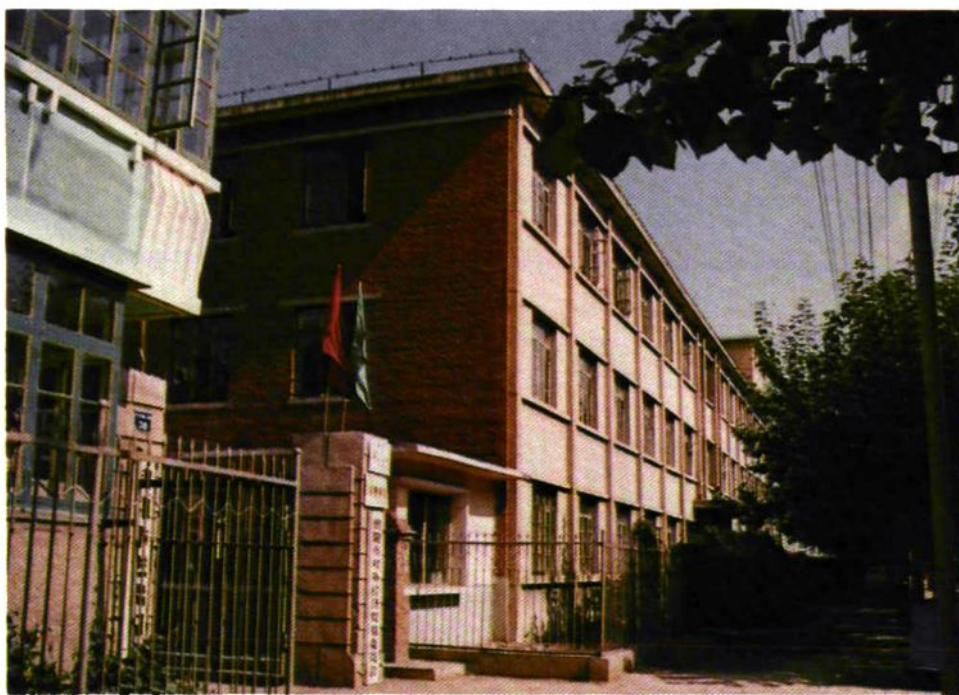
朝阳市外贸局办公楼