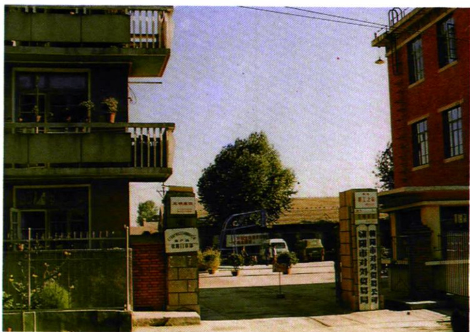
朝阳市外贸局正门