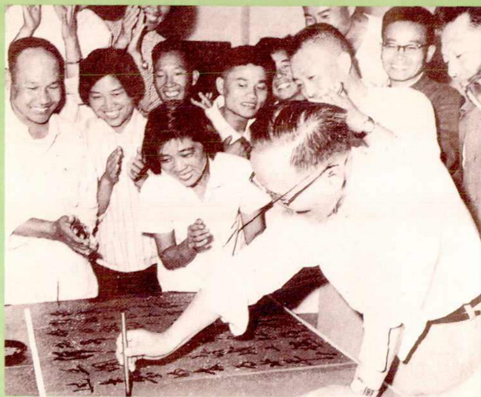
1959年郭沫若副委员长视察武汉钢铁公司时题诗