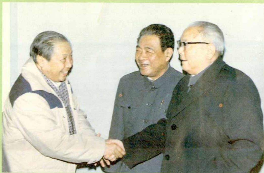
1984年李先念主席(右1)接见《九歌》歌舞诗乐剧作者程云(左1)