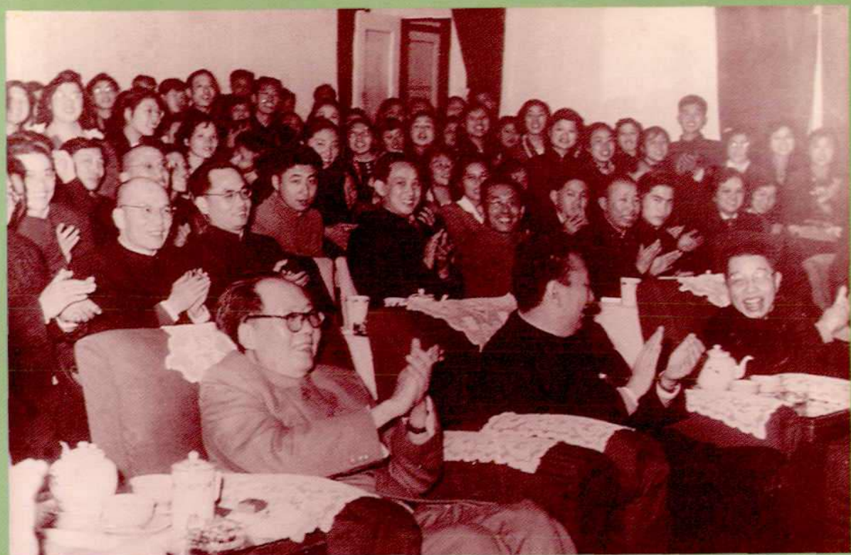
1956年毛泽东主席在汉口德明饭店接见武汉地区文艺工作者