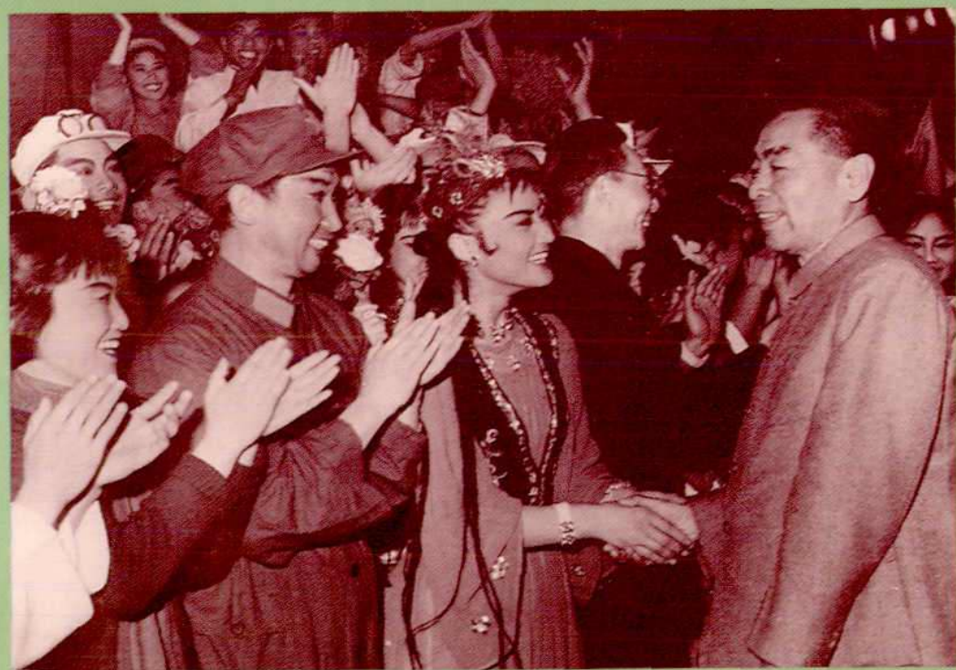
1956年周恩来总理在武汉接见武汉演出《东方红》的演员