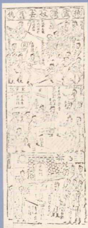
反映辛亥革命的木刻年画六幅中之一组