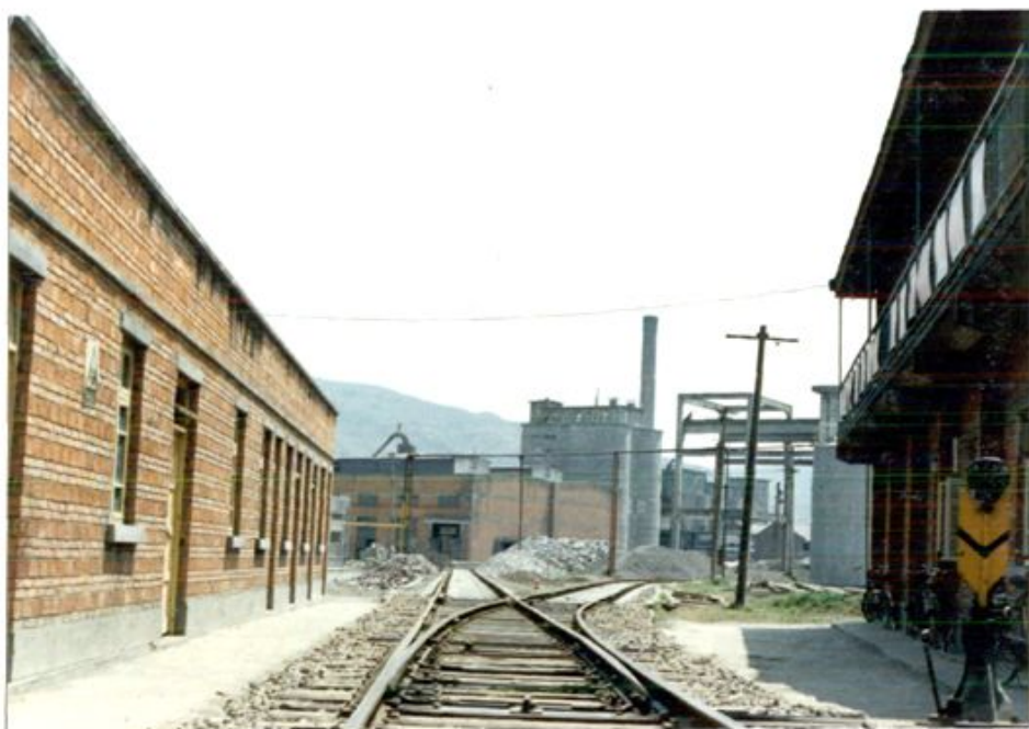
铁路专用线及搬道房