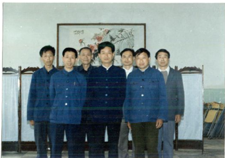
厂志编纂领导小组及编纂人员合影