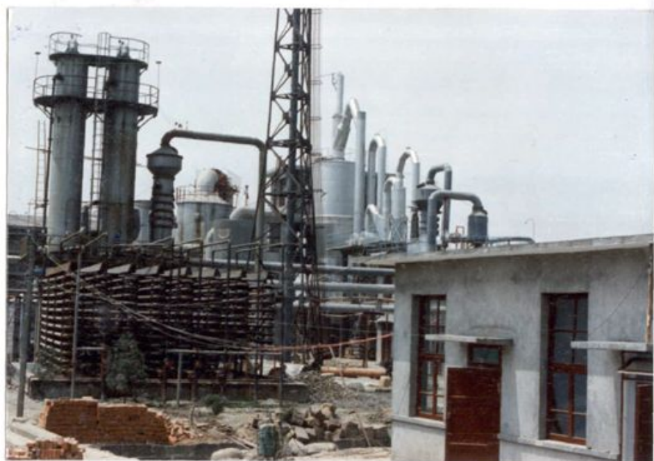
硫 酸 车 间