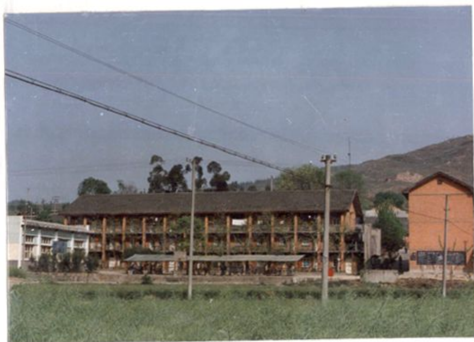
中坝磷肥厂生活区一角