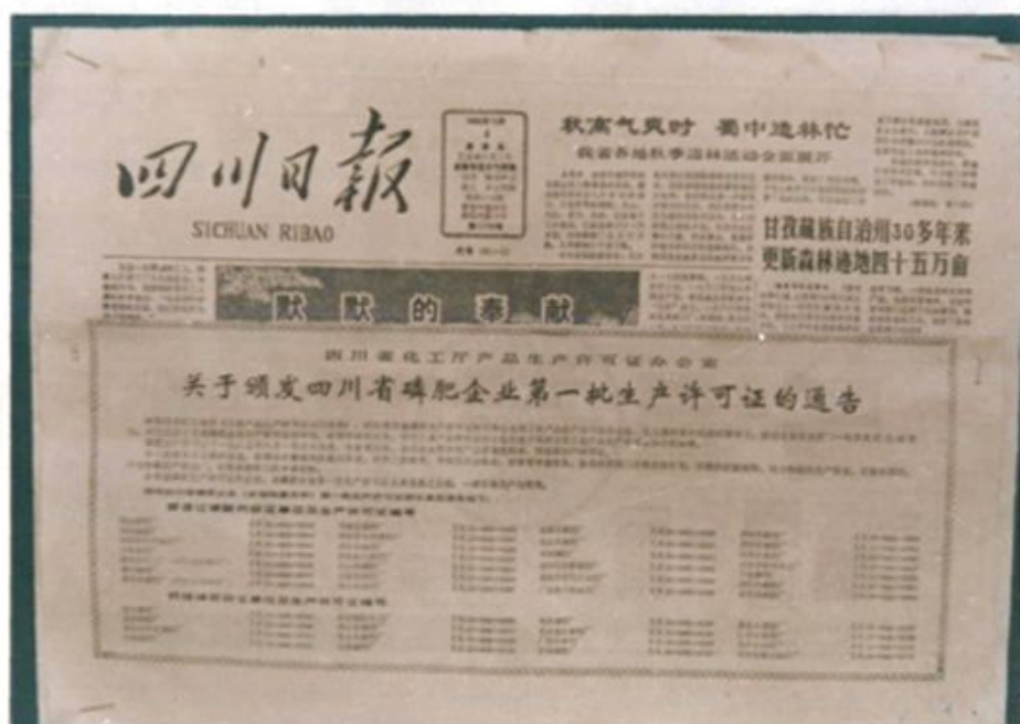
一九八五年八月一日获得四川省化工厅 第一批颁发的普钙和钙镁磷肥生产许可证