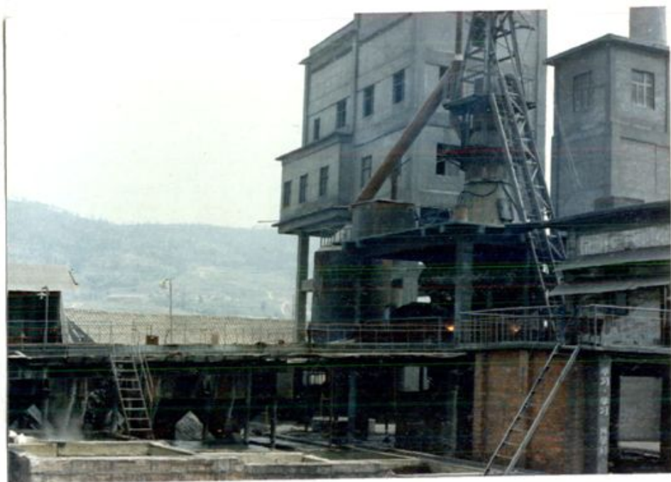
高 炉 车 间