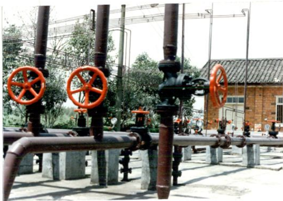
配气站及天然气管道