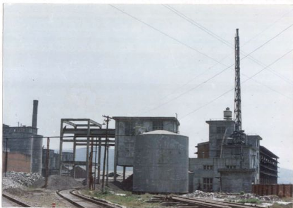
普 钙 车 间