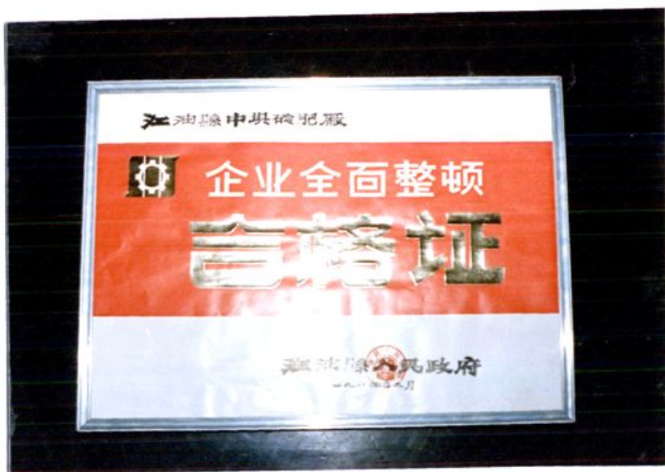
企业全面整顿验收合格证