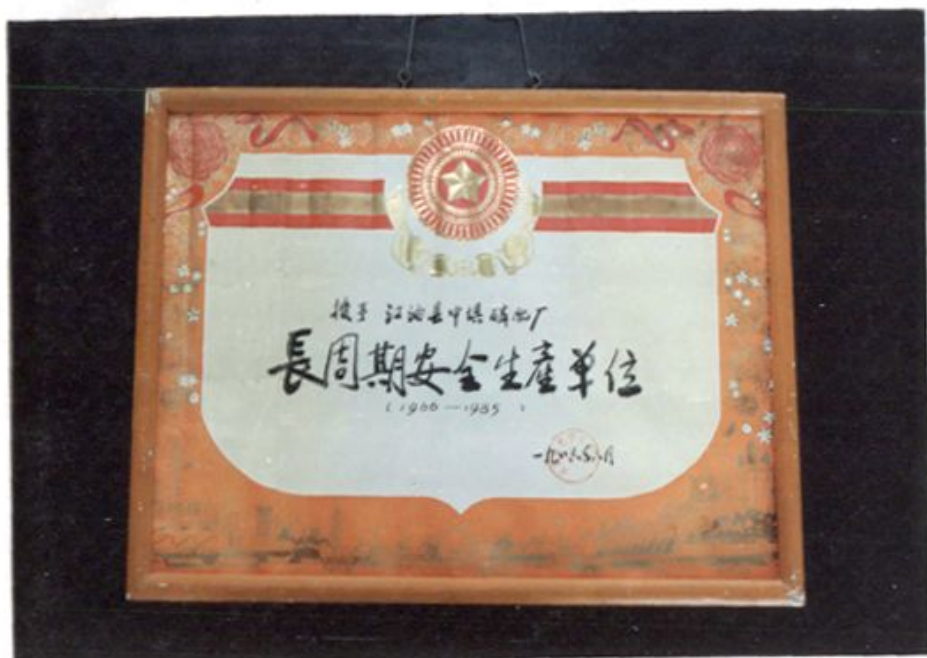
四川省化工局授予的“长周期安全生产单位”称号