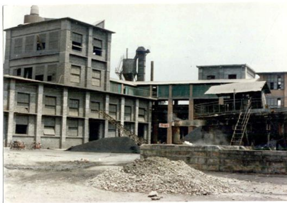
烘 磨 车 间