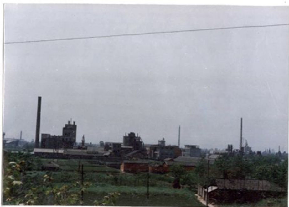
中坝磷肥厂生产区远眺