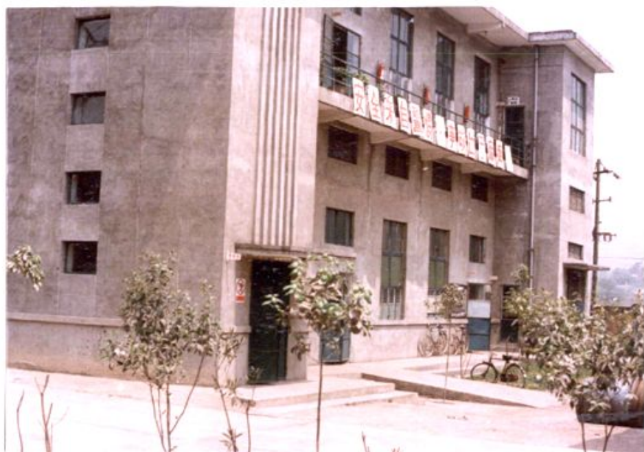
配 电 大 楼