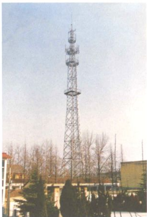
邮局九八年投资一百万元兴建一座移动铁塔