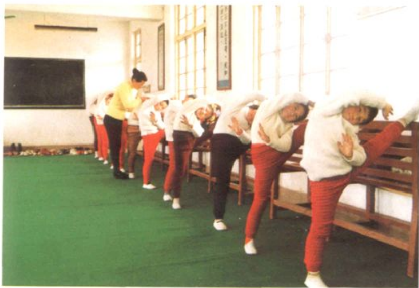
中心幼儿园儿童研练舞蹈