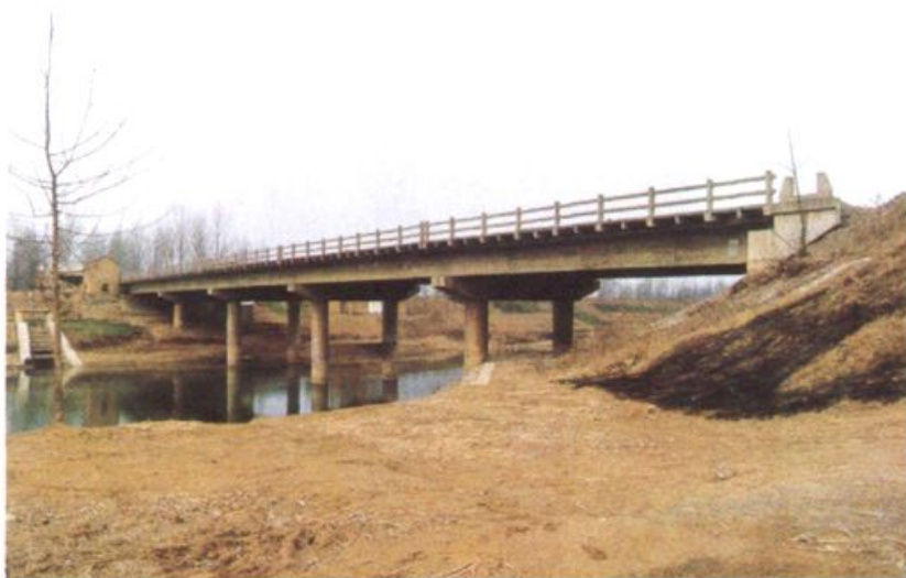
九二年国家投资兴建横跨郑集河大桥使南北变通途