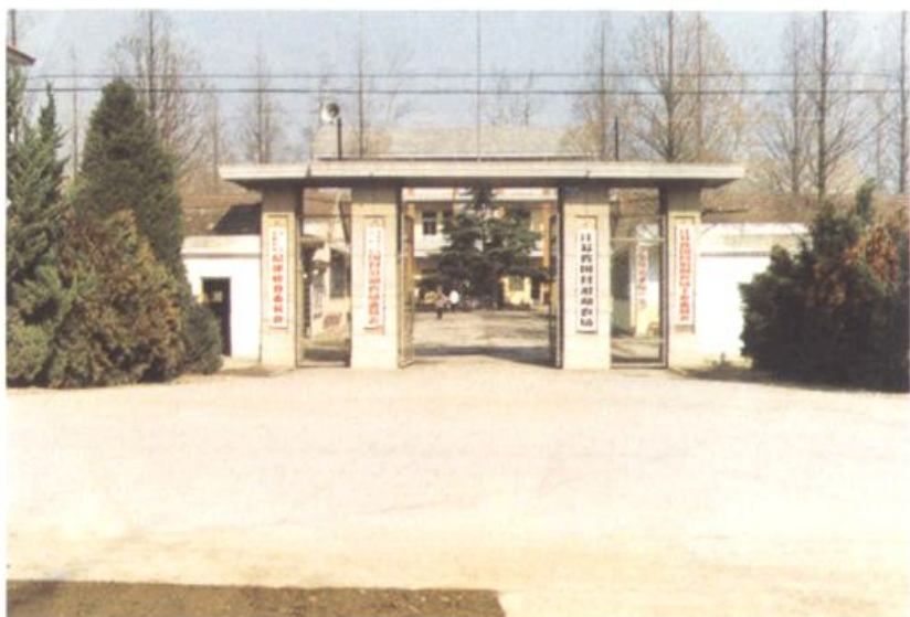
沿湖农场场部机关驻地