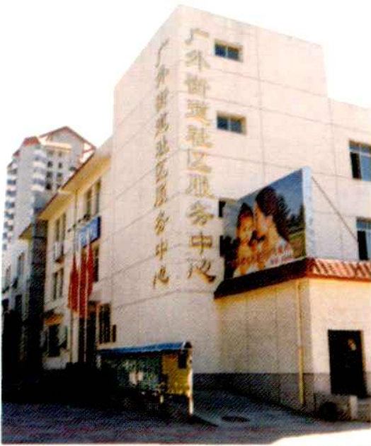
街道社区服务中心