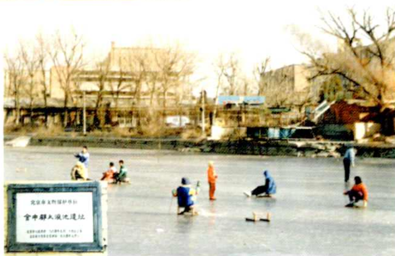
金中都太液池遗址