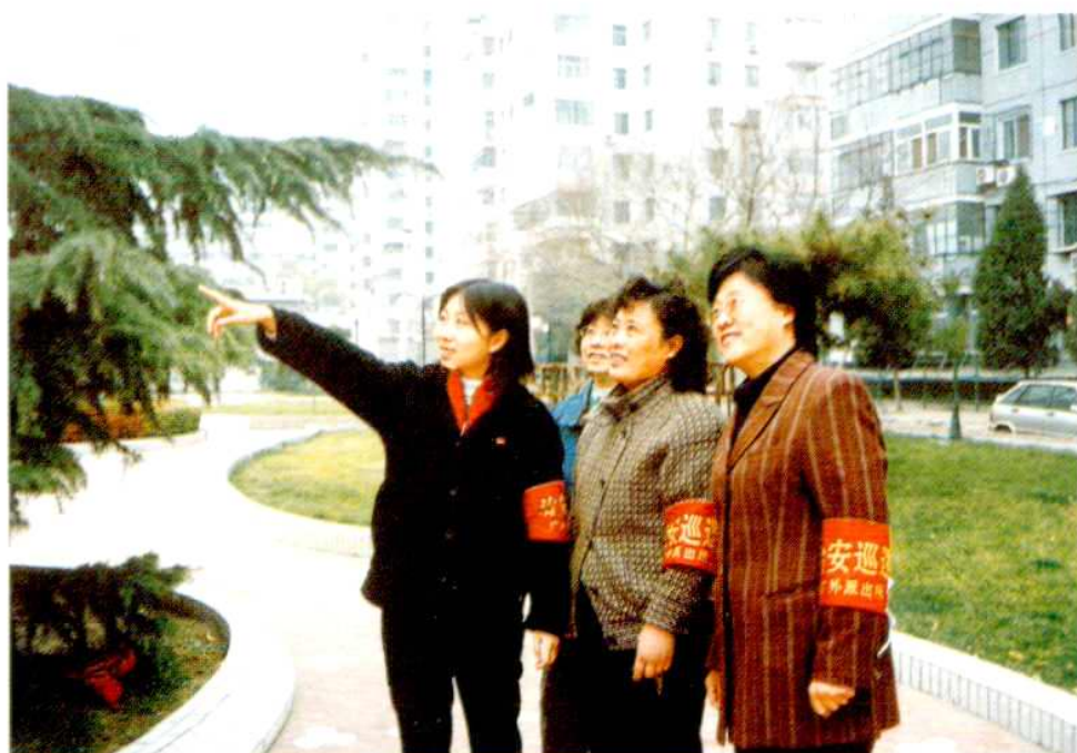
社区居委会干部带领居民参加社区治安巡逻