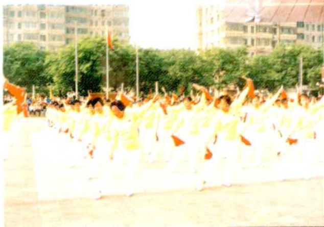
红莲文化广场群 众文体活动