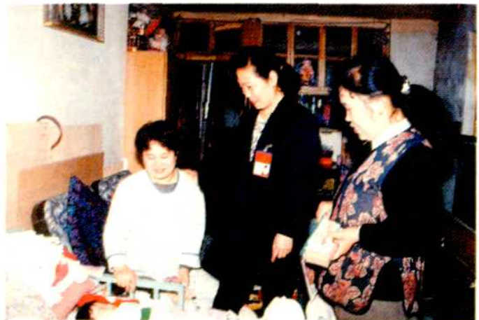
街道计生干部深入 居民家中看望新生儿