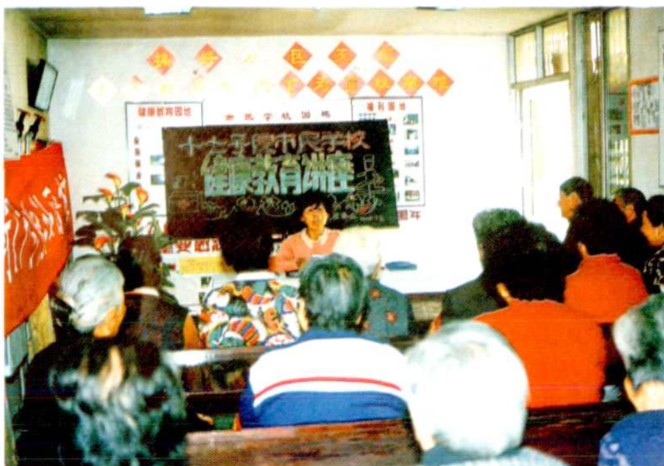
文明市民学校讲座