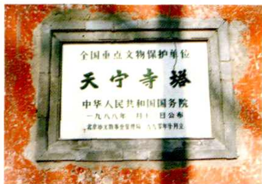
全国重点文物保护单位天宁寺塔