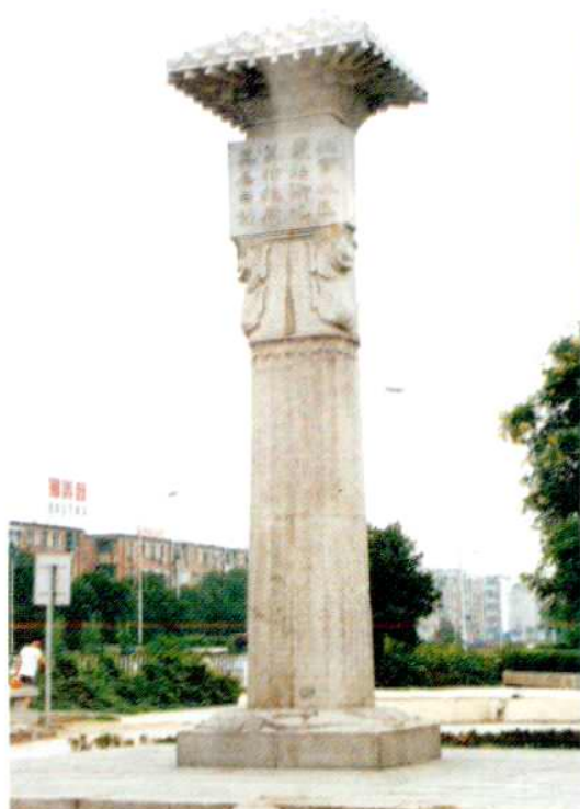
为纪念北京建城 3040 周年，在广外辖区的滨河公园建有北京建城纪念柱