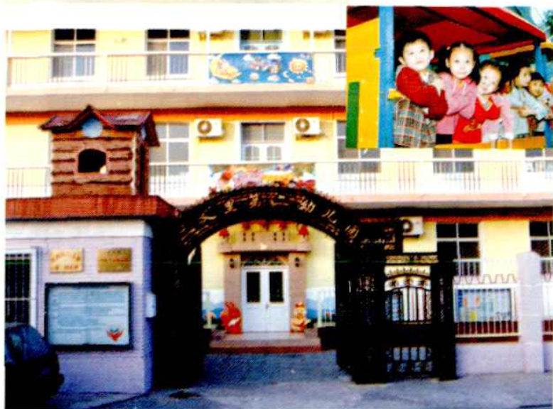
宣武区三义里 第二幼儿园