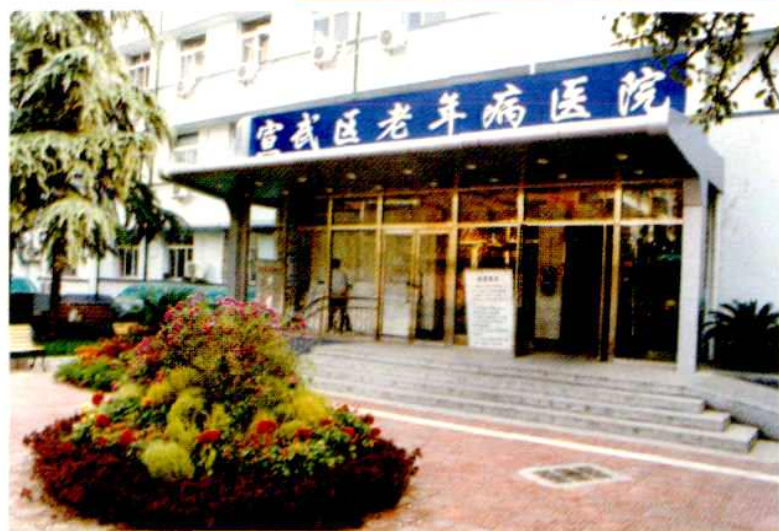
宣武区老年病 医院