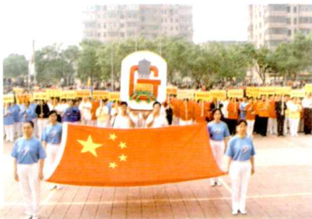
地区全民健身 体育节开幕式