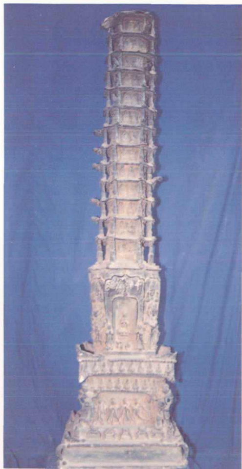
◀明代铜质千佛塔，高120厘米。现陈列在永川县文化馆。